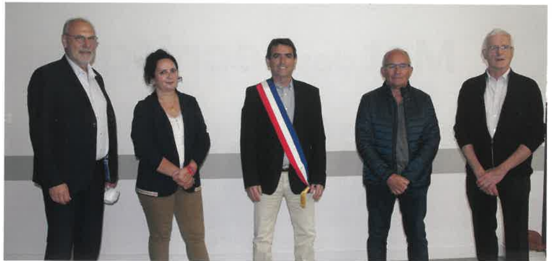
Le nouveau maire et ses adjoints