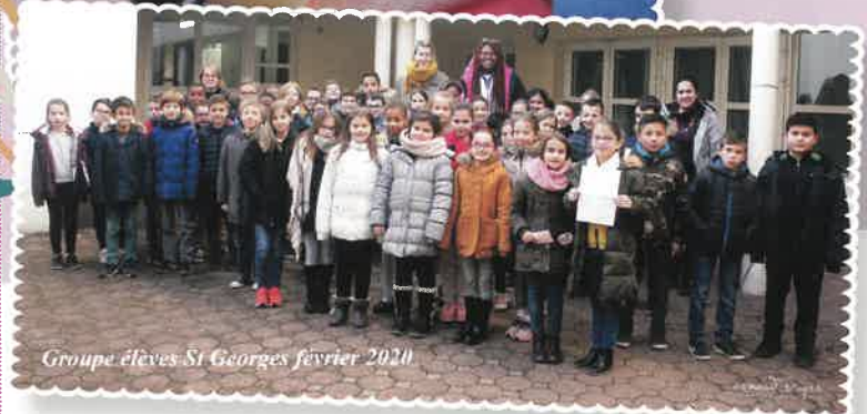
Groupe élèves St Georges février 2020