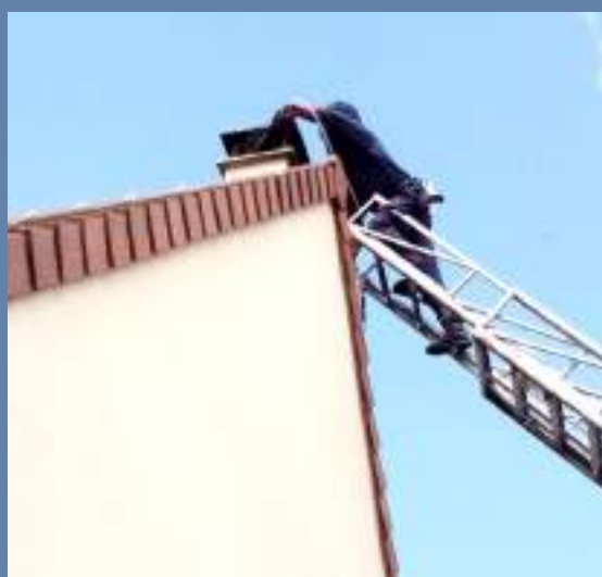
Intervention sur un nid de frelons asiatiques dans un conduit de cheminée.

Pompiers de la commune pour la destruction de nid: