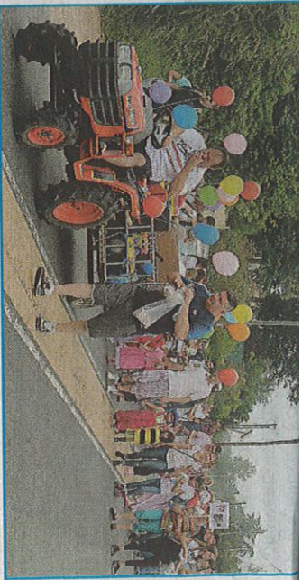
Petits et grands ont défilé dimanche dans les rues du village.