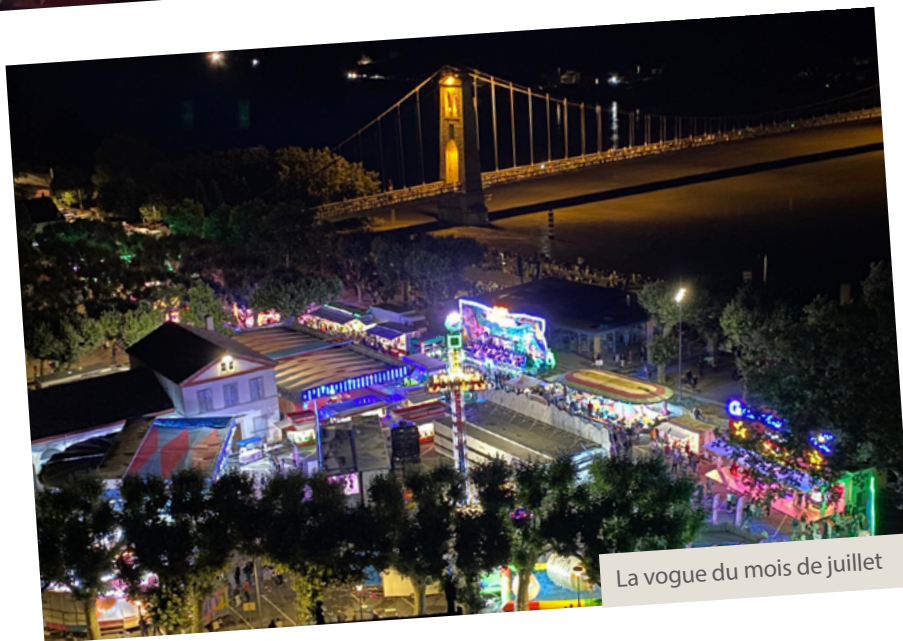
La vogue du mois de juillet