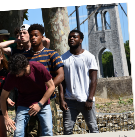
« au fil d'avril » avec la troupe ID Compagnie, rendait hommage à Gainsbourg le jour de la Fête de la musique.