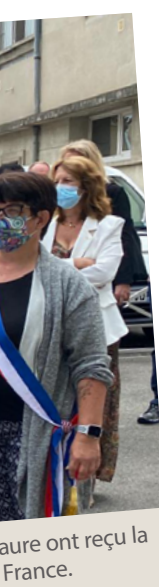
...e ont reçu la France.