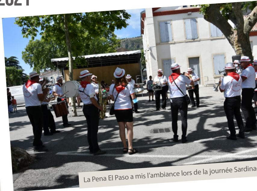
La Pena El Paso a mis l'ambiance lors de la journée Sardinia