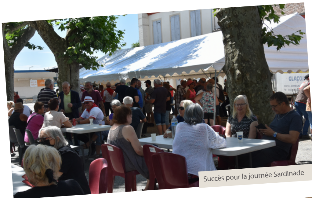
Succès pour la journée Sardinaide