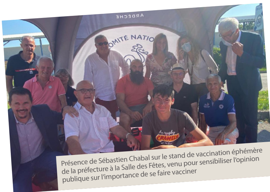
Présence de Sébastien Chabal sur le stand de vaccination éphémère de la préfecture à la Salle des Fêtes, venu pour sensibiliser l'opinion publique sur l'importance de se faire vacciner