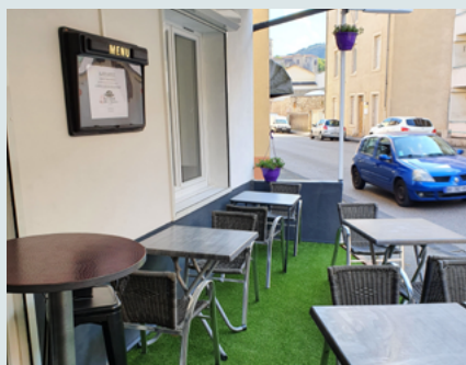
Au Bon Appétit Tél. 06 16 20 20 55 18 Av. Louis Anteriou www.facebook.com/Au-Bon-Appetit