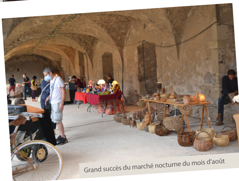
Grand succès du marché nocturne du mois d'août