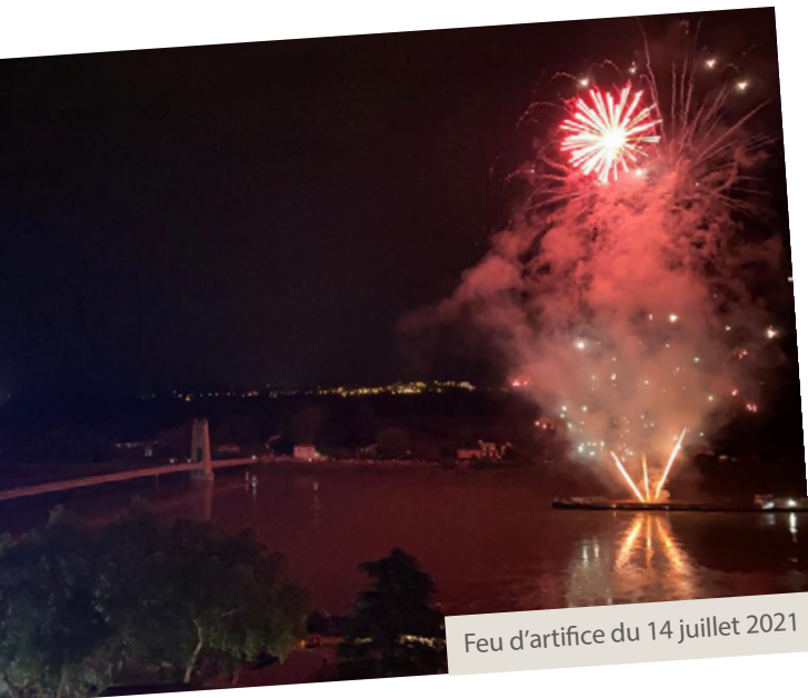
Feu d'artifice du 14 juillet 2021