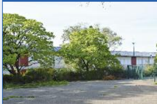
Le toit de l'école élémentaire du Petit Moulin