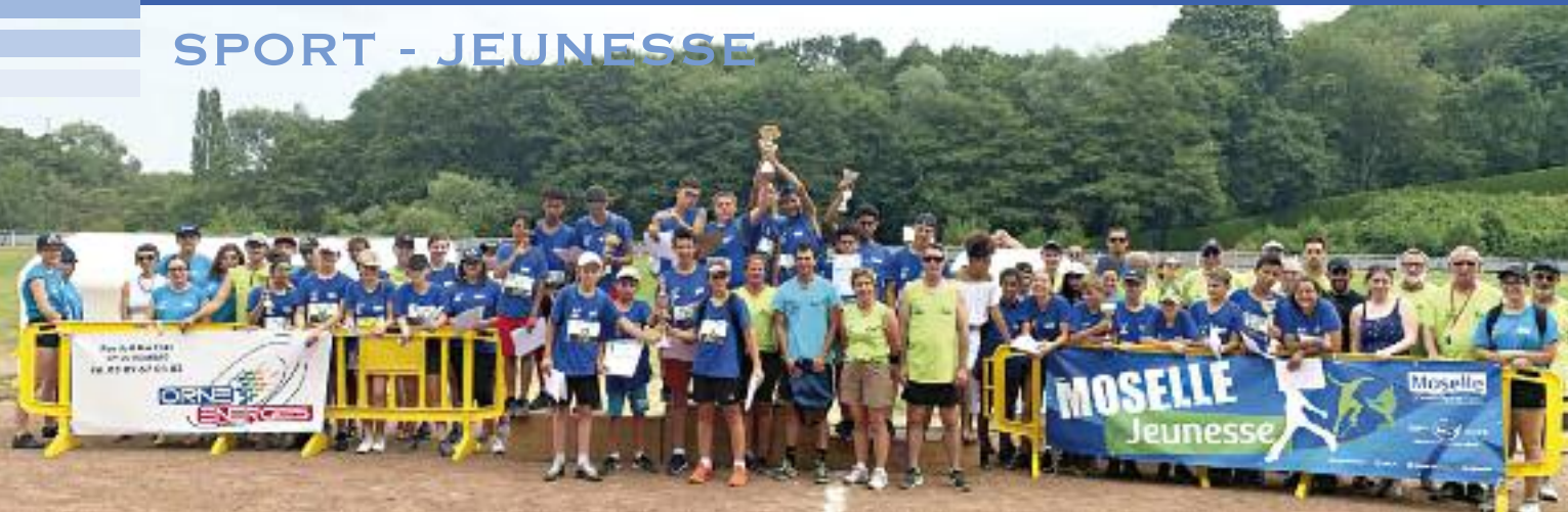
Participants et encadrants autour du podium sur le stade du Fond Saint Martin