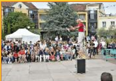
Les Moldaves : du cirque et des rires