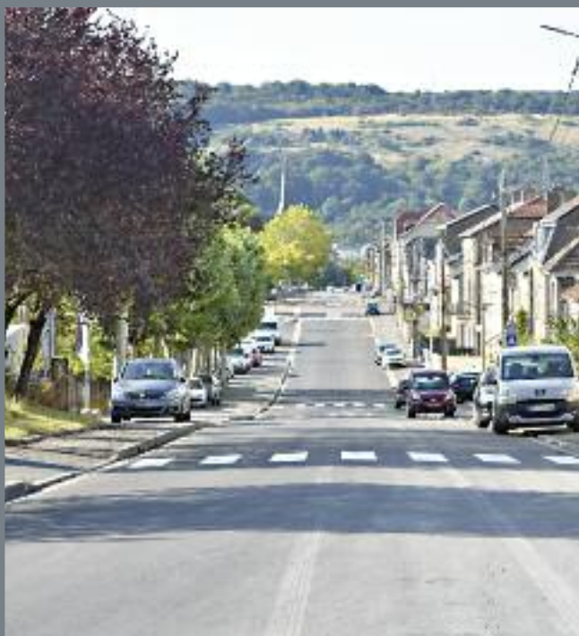
Certains trottoirs sont presque aussi larges que la chaussée