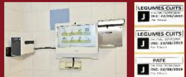
1 - De droite à gauche : le scanner, l'unité centrale de gestion et l'imprimante 2 - Exemples d'étiquettes de traçabilité avec leurs multiples informations