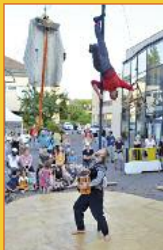
La poésie acrobatique des "Accords de mat"

Grâce aux efforts de tous, à la qualité des spectacles et des animations proposés et à l'ambiance conviviale, toujours de mise sur la place de l'Hôtel de Ville, des milliers d'habitants de Rombas et de la vallée de l'Orne ont, pour la 17 ème année consécutive, plébiscité Les Estivales et ont massivement répondu présents aux rendez-vous des vendredis de l'été.