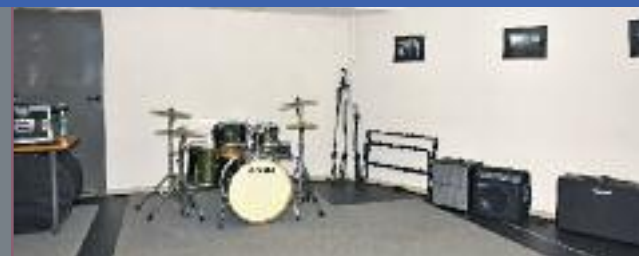
Instruments et matériel de musique sont à disposition des jeunes

Les conditions d'accès sont disponibles auprès de Julie au : 06 75 74 79 87 ou en prenant contact directement par le Facebook de l'Espace Jeunes.