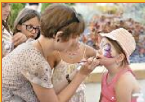
Moment magique pour les petits grâce à Mélo make up