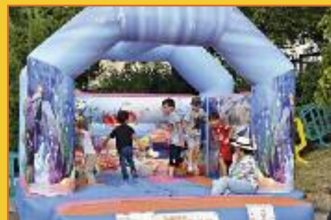
Le château gonflable a toujours ses adeptes