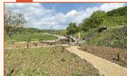
Aménagement d'un verger pédagogique