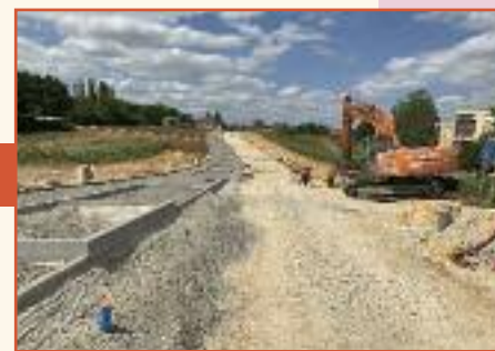
Aménagement d'un lotissement