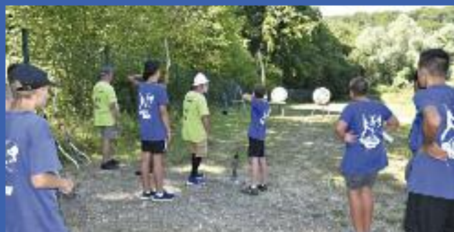
Tir à l'arc avec la 1 ère Compagnie d'Arc de Rombas