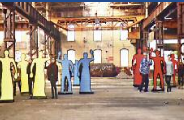
Traces et mémoires ouvrières saison 2