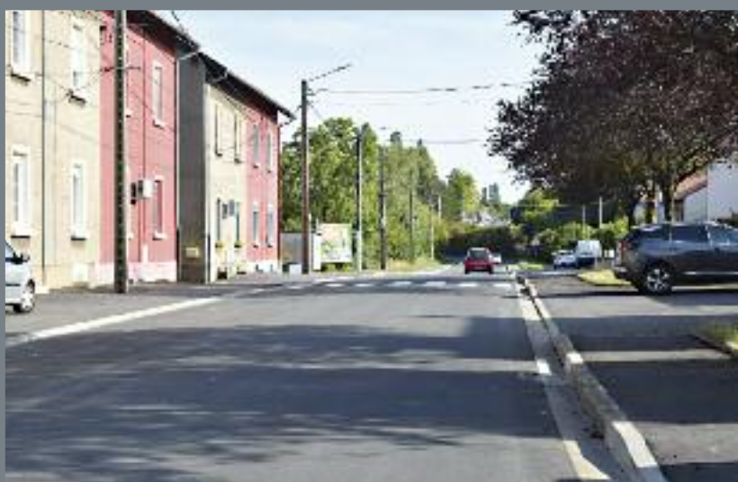
La partie haute de la rue de Metz