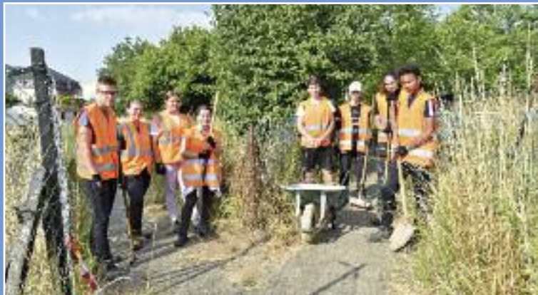
Désherbage des ruelles

désherbage des rues et ruelles, le montage et la tenue de certains stands des estivales, l'entretien et la remise en peinture de grilles et barrières, le service à table et le nettoyage de l'Agora lors des centres aérés et l'entretien des locaux administratifs.