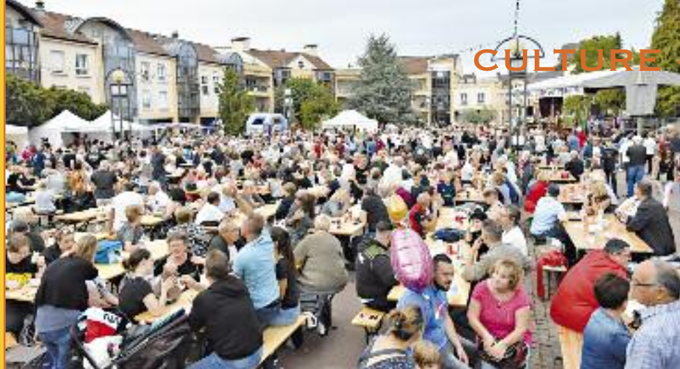
Le public toujours fidèle au rendez-vous des Estivales