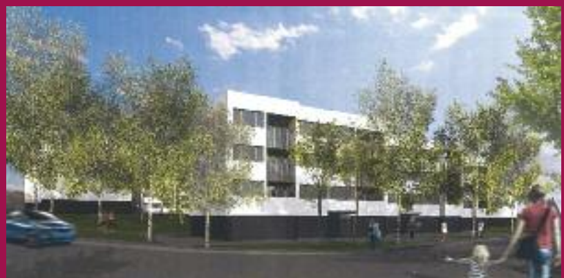
Vue d'architecte de la rue du Muguet (conception Demathieu Bard)