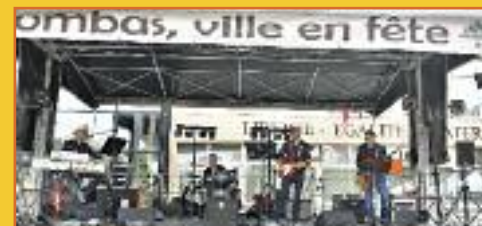
Les orchestres : indispensables à la réussite des Estivales