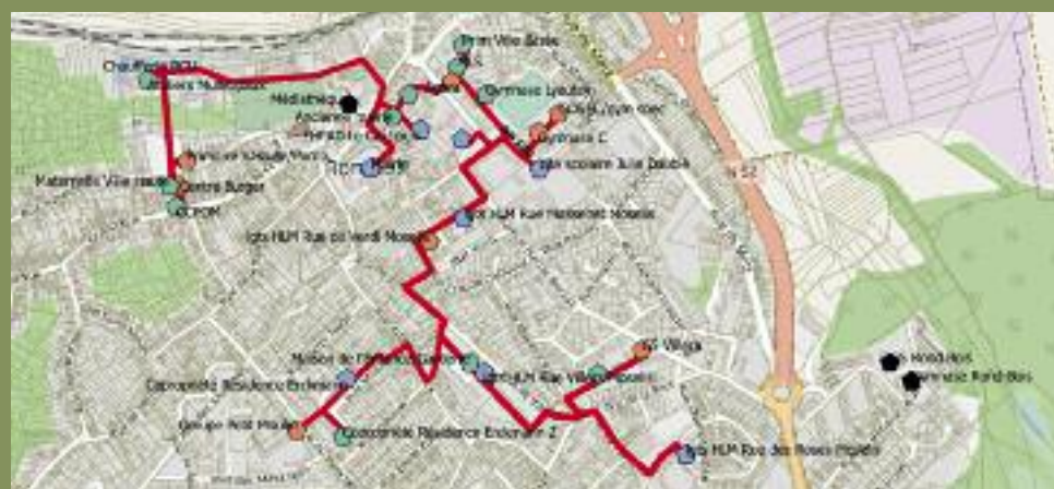
Le projet de réseau de chauffage urbain (avec la localisation de la chaudière en haut à gauche).

Ce projet piloté conjointement par la Ville et Orne Energies, actuellement en phase d'étude et d'appel d'offres devrait entrer en phase opérationnelle de construction au cours de l'année 2020.