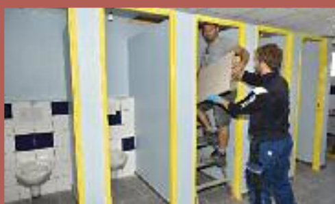
Rénovation des toilettes du sol ou plafond