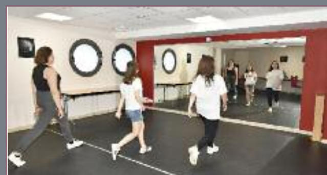
Espace dédié à la danse équipé de son grand miroir