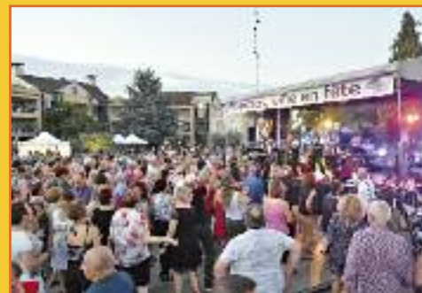
Les Estivales c'est aussi la danse !