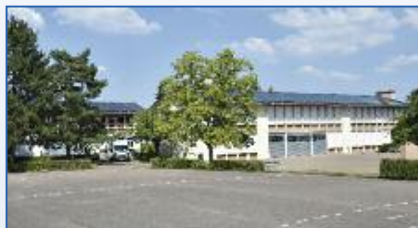
Les toitures rénovées de l'école élémentaires de Villers et leurs panneaux photovoltaïques

C'est donc plus d'un demi-mégawatt d'électricité verte, soit plus de la consommation moyenne annuelle de 155 foyers, qui sera désormais produit à Rombas, annulant du même coup les 155 tonnes de CO2 qui auraient été nécessaires à sa production par un autre procédé.