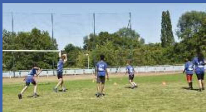
Flag ball au Fond Saint Martin