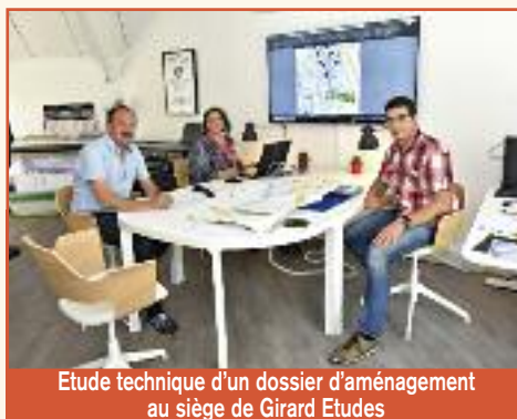
Etude technique d'un dossier d'aménagement au siège de Girard Etudes

Girard Etudes 5 rue du 8 Mai 1945 57120 ROMBAS Tél. : 03 87 80 65 88 contact@girardetudes.fr girardetudes.fr