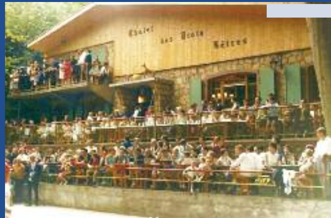
Chalet des Trois Hêtres. Massée sur les 2 paliers et le balcon, la foule assiste à un tournoi international de cyclo-ball accueillant selon des années, des équipes venues d'Allemagne, de Belgique, de Suisse, d'Alsace, du lyonnais, et, pour la première fois en 2019, de Paris... toutes contre La Flèche !