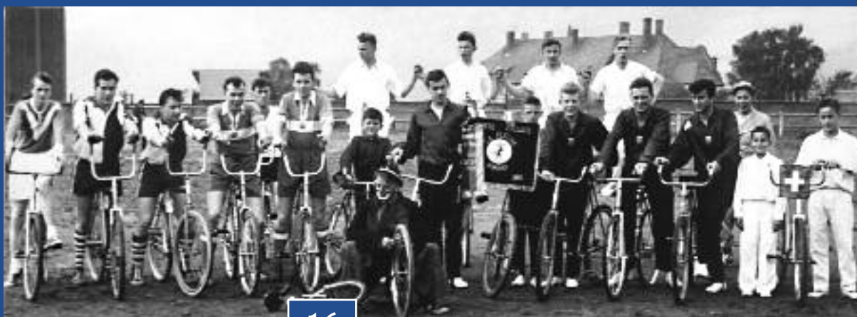
Tournoi international de cyclo-ball (avec participation d'une équipe suisse) organisé par La Flèche au stade de football où un plancher en bois était spécialement aménagé. Au centre, le drapeau du club, officiellement remis en 1955.

La Flèche fut de toutes les manifestations de la ville. Manifestations sportives d'abord, par l'organisation de compétitions avec des équipes alsaciennes. Manifestations artistiques ensuite pour les multiples démonstrations de cycle artistique sur le stade de football, dans diverses salles de Rombas ou de la vallée de l'Orne. Manifestations festives enfin, avec participation des deux sections aux nombreux défilés sportifs, associatifs, carnavalesques, voire patriotiques et autres à travers les rues de la ville, puis sur la place de la République.