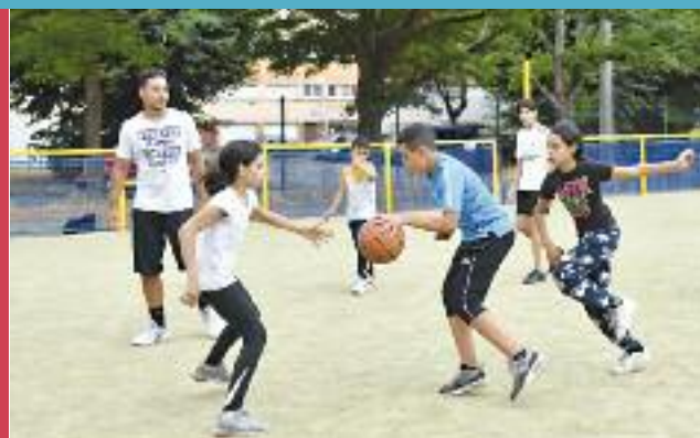
Match de basket au Petit Moulin

Pour ceux qui n'étaient pas tentés par les 16,5 kilomètres de la Foll Dingue ou les 6,5 kilomètres de la mini Foll'Dingue, le RAC proposait en parallèle et pour la première fois une marche nordique qui empruntait également un agréable parcours boisé.