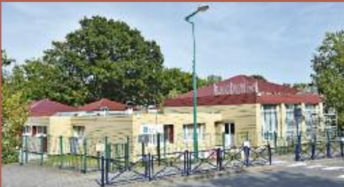
Un changement d'aspect aussi radical que positif pour l'école élémentaire du Rond Bois

A l'intérieur, les élèves, comme le personnel enseignant, apprécieront la rénovation complète du bloc sanitaire. Toilettes, lavabos, sols et murs carrelés, plafonds, tout est neuf. Bien entendu des toilettes aux normes "handicapés" font partie des nouveaux aménagements.