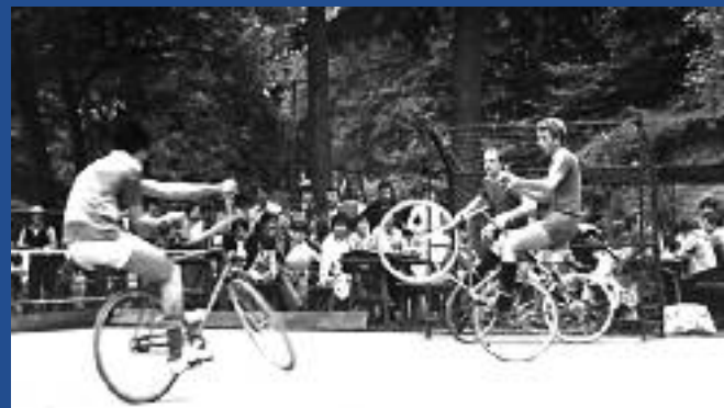
Plateforme de compétition de cyclo-ball aux Trois Hêtres. A gauche, un joueur offensif frappe la balle de sa roue avant vers le but adverse que les deux joueurs de l'équipe opposée tentent de repousser (années 1960).