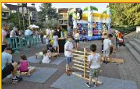
Les plus jeunes avaient de quoi s'amuser sur le stand de la Maison de l'Enfance