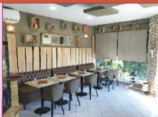
Marcimini Grill vous accueille dans un superbe cadre boisé et chaleureux

Marcimini Grill dispose d'un accès pour les personnes à mobilité réduite.