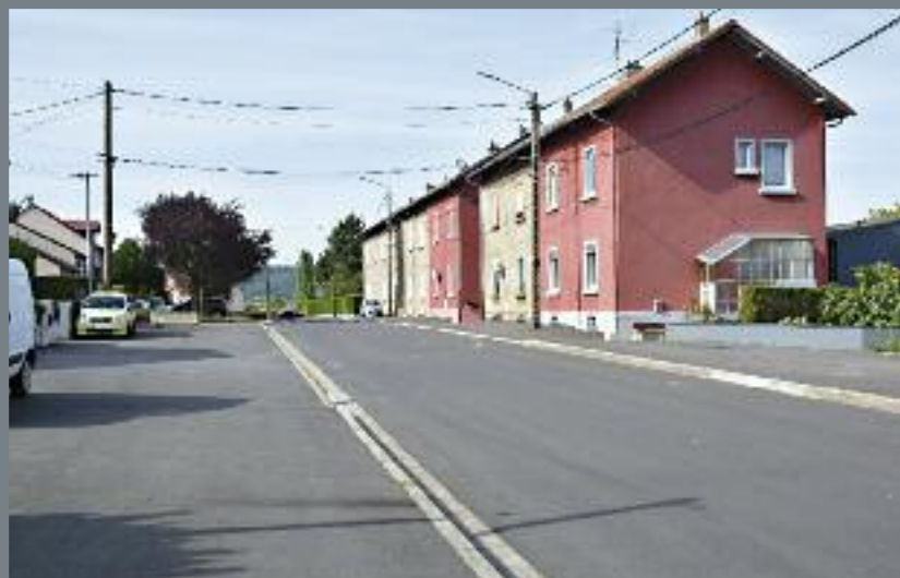
La rue de Metz vue depuis la partie haute en direction du temple.