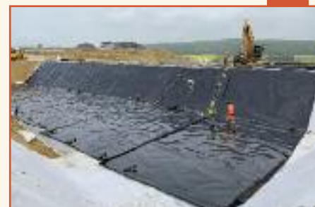
Maîtrise d'œuvre pour la réalisation d'un centre d'enfouissement technique

Particulièrement expérimentée dans le domaine de la voirie et des réseaux divers, Girard Etudes allie une longue pratique et une technicité reconnue à une proximité très appréciée par les collectivités comme par les donneurs d'ordre privés.