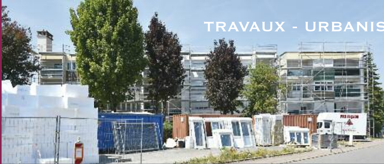
Vue depuis la rue du Champ Robert