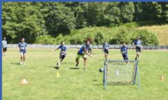
Partie de Tchouk ball