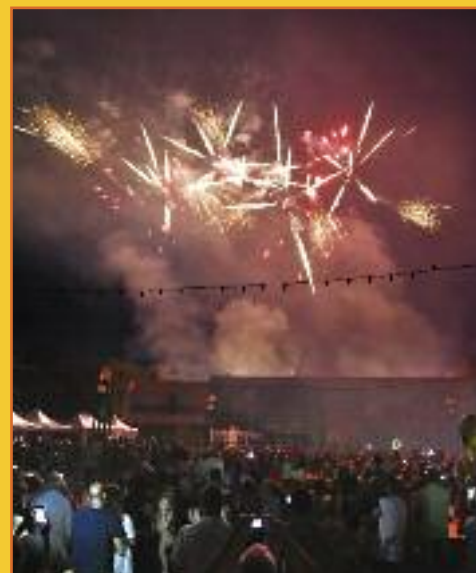
Pas d'Estivales sans feu d'artifice d'ouverture et de clôture