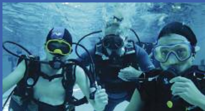
Plongée à la piscine de Joeuf