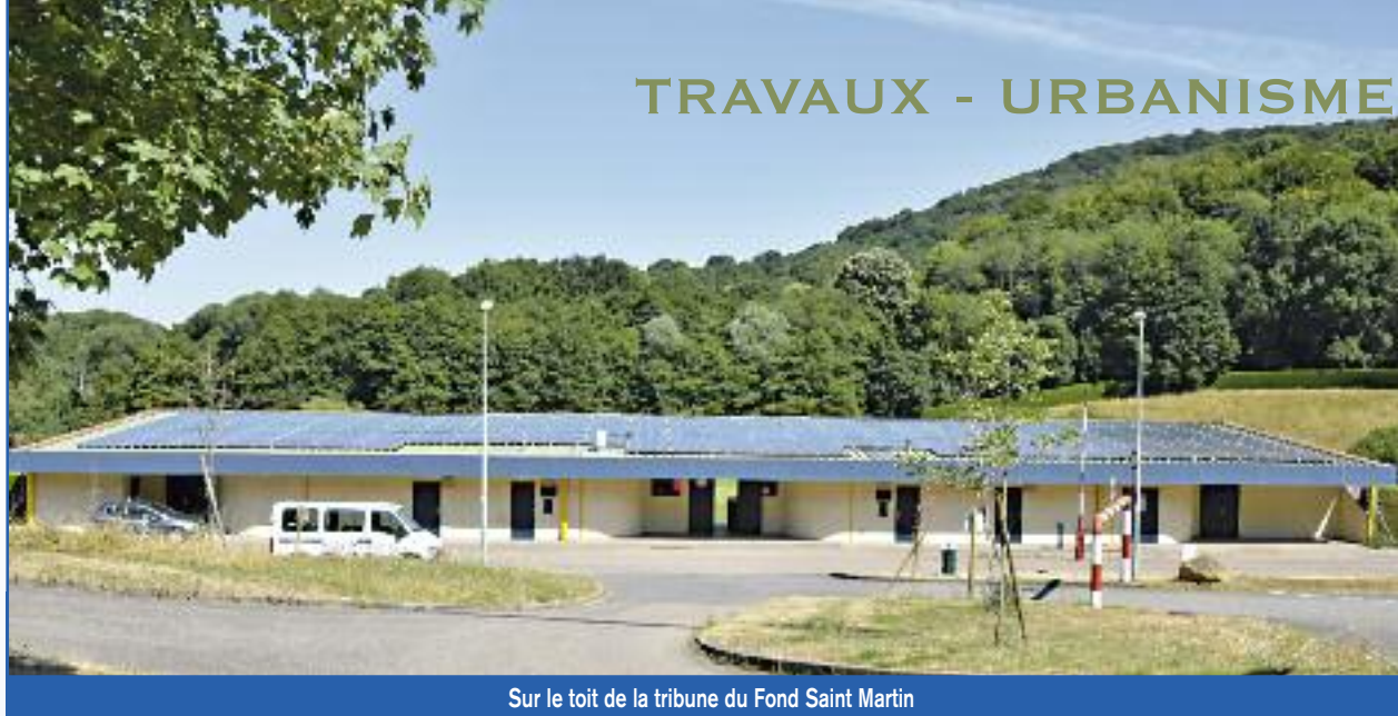
Sur le toit de la tribune du Fond Saint Martin