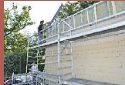
La pose des plaques de béton fibré par dessus la couche d'isolant thermique