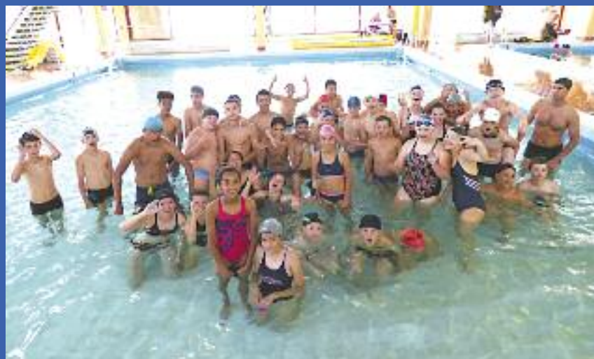
Epreuves aquatiques à la piscine de Joeuf

Cette année, les 40 jeunes qui s'y sont inscrits ont ainsi pu s'initier au tchoukball, au tir à la carabine, à la tyrolienne ou encore à la plongée en piscine en complément d'un riche éventail de disciplines sportives (course d'orientation, tir à l'arc, tennis, vélo, musculation, échecs, run and bike, pétanque ...). Si toutes les équipes ont été méritantes et sont reparties avec des lots, les gagnants de l'édition 2019 sont la "Team Kiwi" chez les moins de 14 ans et "les Torchons" pour les plus de 14 ans. Ils remportent une journée à Center Parcs organisée par le Service Jeunesse.