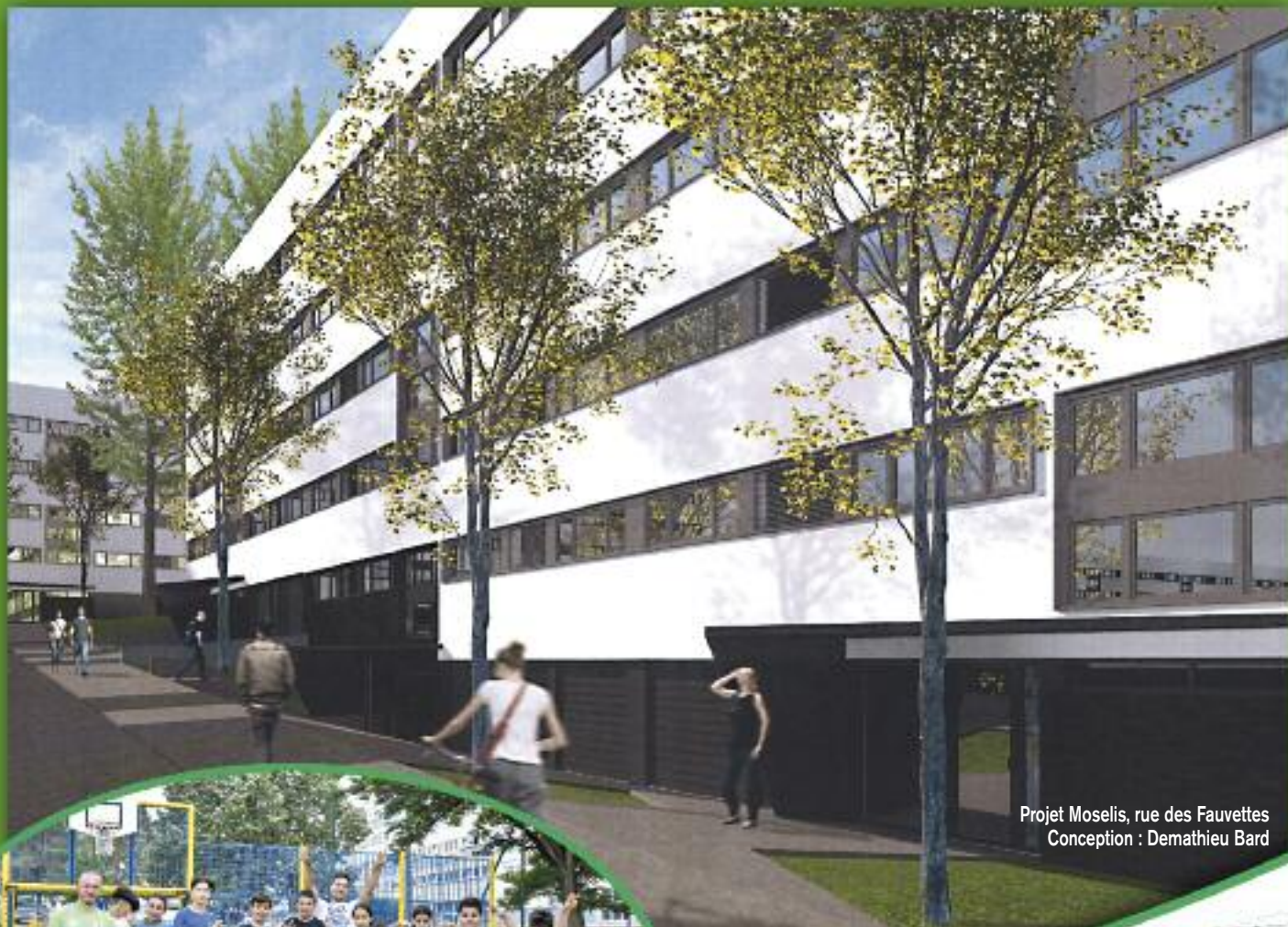
Projet Moselis, rue des Fauvettes Conception : Demathieu Bard