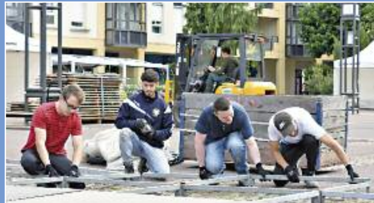
Assemblage du parquet de danse pour Les Estivales