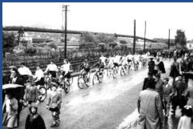
Malgré la pluie, participation de la Société Cycliste la Flèche à un défilé sportif (rue de la Gare) dans les années 1950.