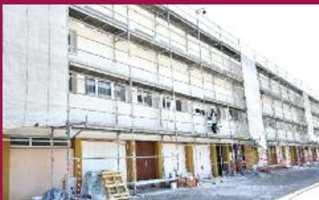
Travaux en cours rue des Mésanges

Pour ces 226 logements, les travaux en cours constituent un facteur d'économies d'énergie non négligeable de nature à optimiser les dépenses de chauffage supportées par les locataires. L'objectif de performance énergétique recherché après travaux est de ramener tous les logements à un niveau de Diagnostic de Performance Energétique de type C (consommation entre 91 à 150 KWH/m 2 par an) et si possible de type B (consommation entre 50 à 90 KWH/m 2 par an). En effet, le programme vise la certification Haute Performance énergétique. Avec 226 logements rombasiens rénovés simultanément, il s'agit à ce jour de la plus vaste opération de réhabilitation thermique menée dans notre localité.