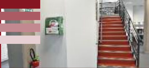
Dans le hall d'accueil de la Pléiade

En outre, la police Municipale dispose d'un défibrillateur mobile qui peut être rapidement être mis en œuvre lors d'interventions.