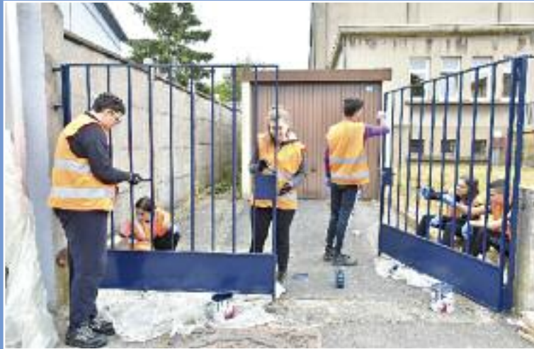
Remise en peinture du portail et de la grille du Gymnase Lyautey