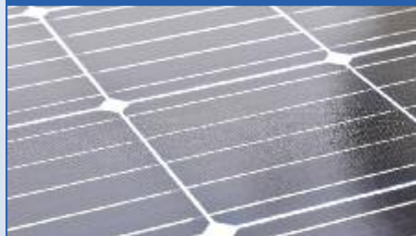
< Pose des panneaux sur le toit du Cosec