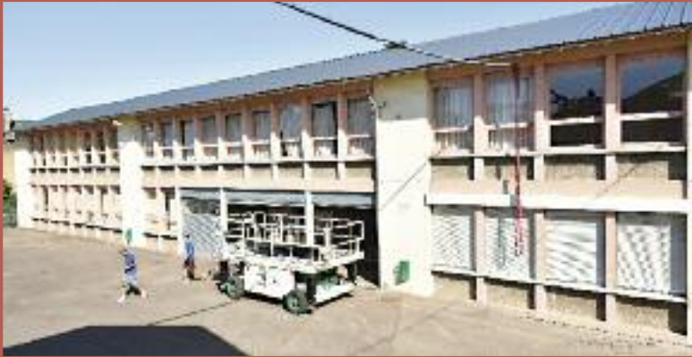
Les toitures rénovées avant la pose des panneaux photovoltaïques