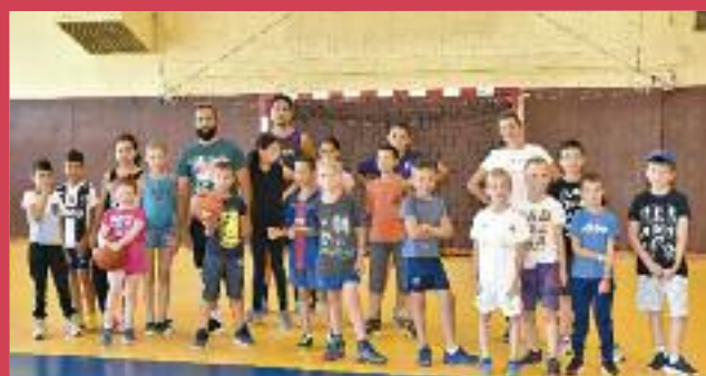
Sports collectifs au Cosec