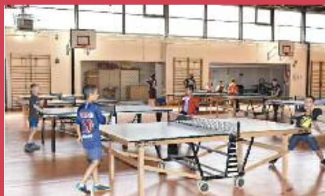
Tennis de table au gymnase B