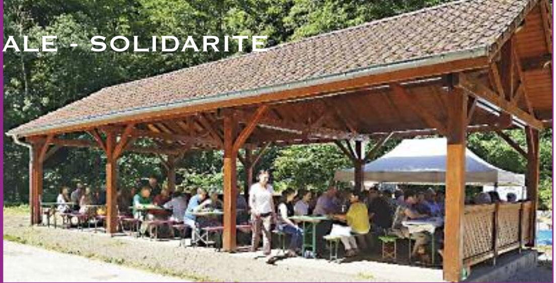
Du soleil, un délicieux repas, un cadre naturel agréable et 80 convives ravis.