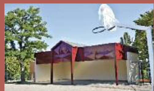
Le préau a été rénové lui aussi