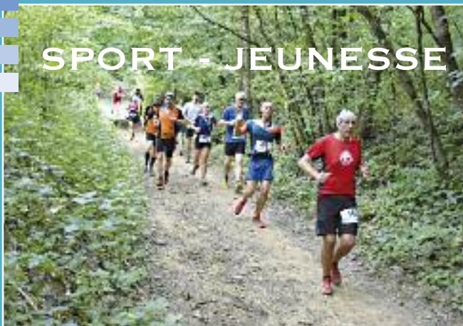
Les coureurs en pleine descente