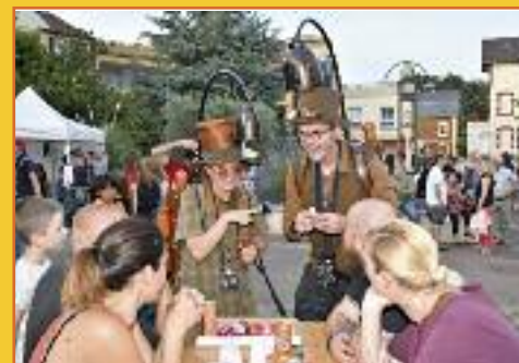
L'humour décalé de la compagnie Ebadidon