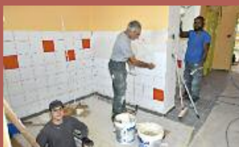
Création de toilettes pour les personnes à mobilité réduite