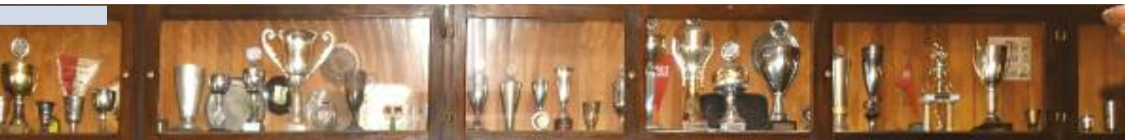
Une partie des coupes, trophées et autres récompenses obtenues par La Flèche à Rombas, ailleurs en France ou à l'étranger.