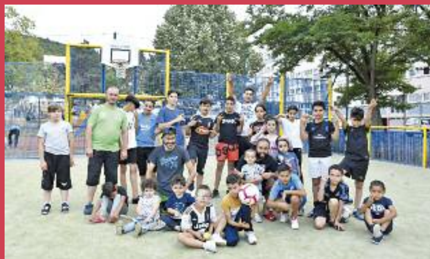
Organisation d'activités sportives dans les quartiers

Comme chaque année, la Ville de Rombas proposait des animations sportives pour les jeunes à partir de 7 ans. Les jeunes n'ont eu que l'embaras du choix tant les activités étaient nombreuses. Parmi elles, de grands classiques comme le tennis, le badminton, le tennis de table, le basket ball et bien sûr le football, mais aussi des activités plus originales comme le kayak, et aussi de nouveaux sports comme le tchoukball et le Kinball, venu d'Amérique du Nord qui se pratique par équipes avec une très impressionnante balle d'un kilo et d'1,22 m de diamètre (voir 4 e de couverture). Ces activités se sont déroulées dans les gymnases et sur les différentes installations sportives de la ville, mais aussi, pour sortir les enfants de leur cadre habituel, au centre thermal d'Amnéville, à Metz plage, à la base de loisirs de Moineville et dans d'autres lieux encore.