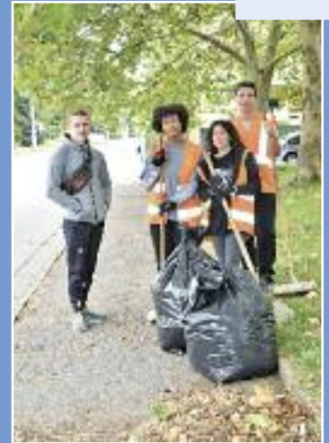
Désherbage et entretien de la rue Chantereine