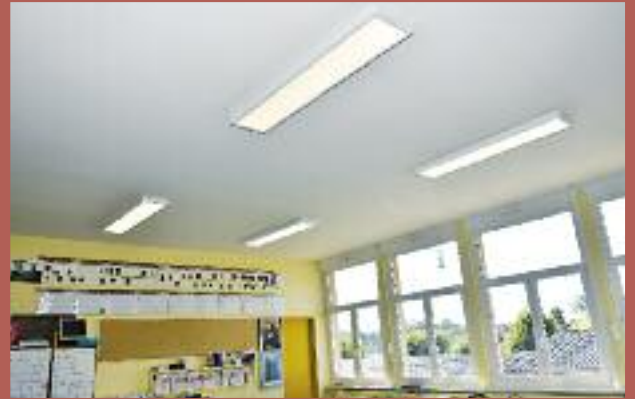
Les dalles à Leds ont remplacé les néons