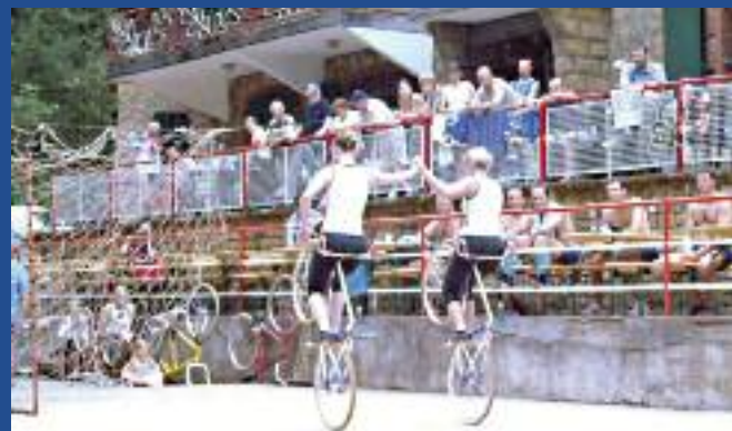
Démonstration de cyclisme artistique (et acrobatique) par deux jeunes femmes. Pour les 2 sections les entraînements eurent d'abord lieu dans une salle paroissiale (rue de la Paix), puis dans la salle du café Reisdorfer et actuellement au gymnase de l'école de Villers.