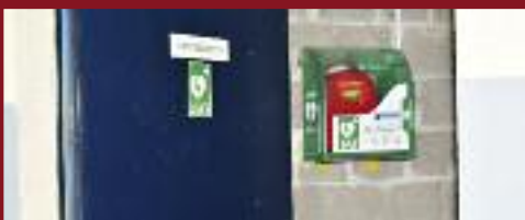
Pour les sportifs comme pour les spectateurs, le défibrillateur de la tribune du stade du Fond Saint Martin