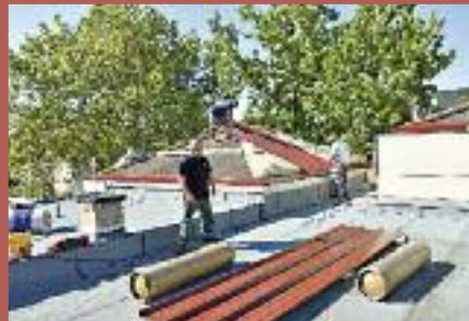
Rénovation et isolation des toitures