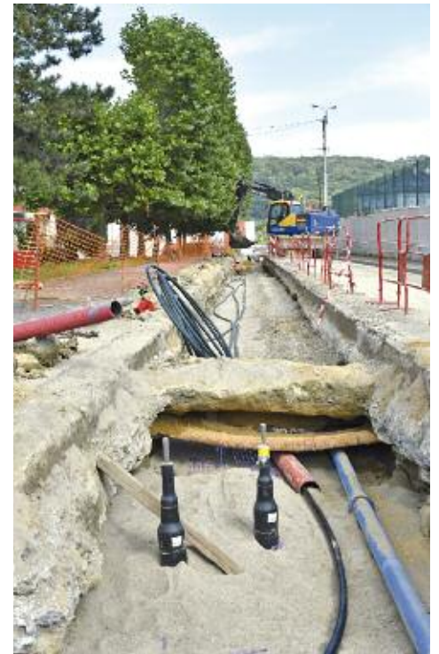
Les travaux de pose des tuyaux d'eau chaude sont quasiment achevés (ici rue Lyautey)

La chaufferie biomasse sera donc prête pour les premiers frimas d'automne, et pourra apporter la chaleur nécessaire aux écoles et autres bâtiments publics ou logements très prochainement.