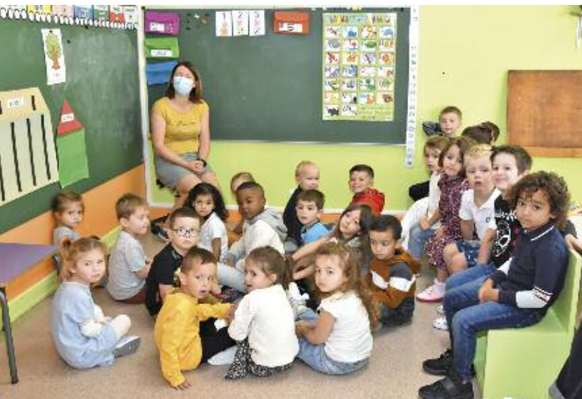
Ecole Maternelle de Villers