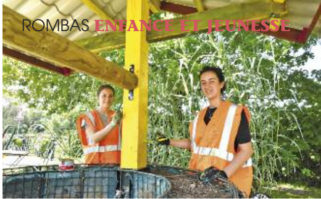
Rénovation du puits près du pont de l'Orne