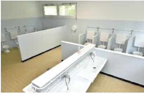
A la maternelle du Rond Bois le bloc sanitaire a été entièrement rénové et repeint