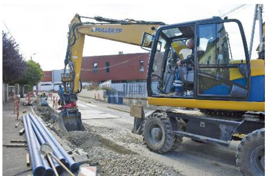
En périphérie des travaux, certains gestionnaires de réseaux saisissent l'opportunité pour rénover leur propre installation. Ici (rue Lyautey) le SIEGVO remplace l'ancien réseau d'approvisionnement en eau potable par des conduites neuves