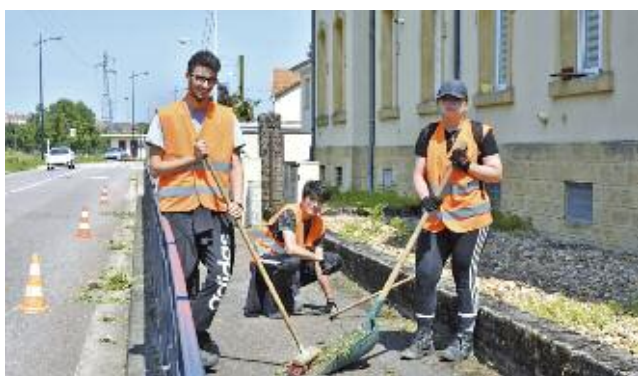
Désherbage du trottoir rue de l'Usine