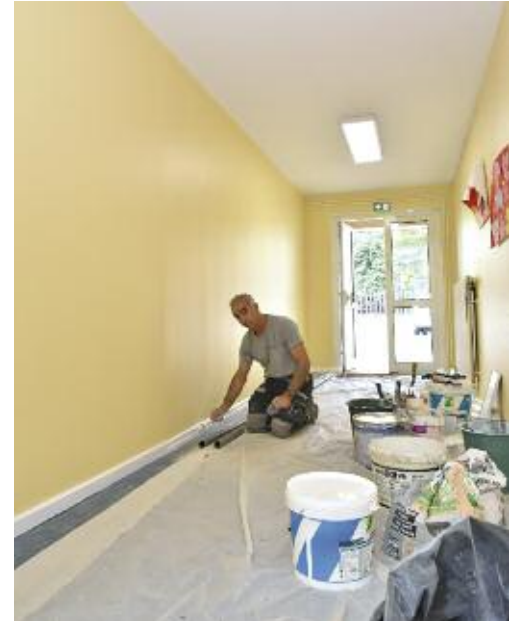
Les travaux ont été effectués par les Ateliers Municipaux

Aménagement de nouveaux bureaux pour la médecine scolaire et la psychologue scolaire