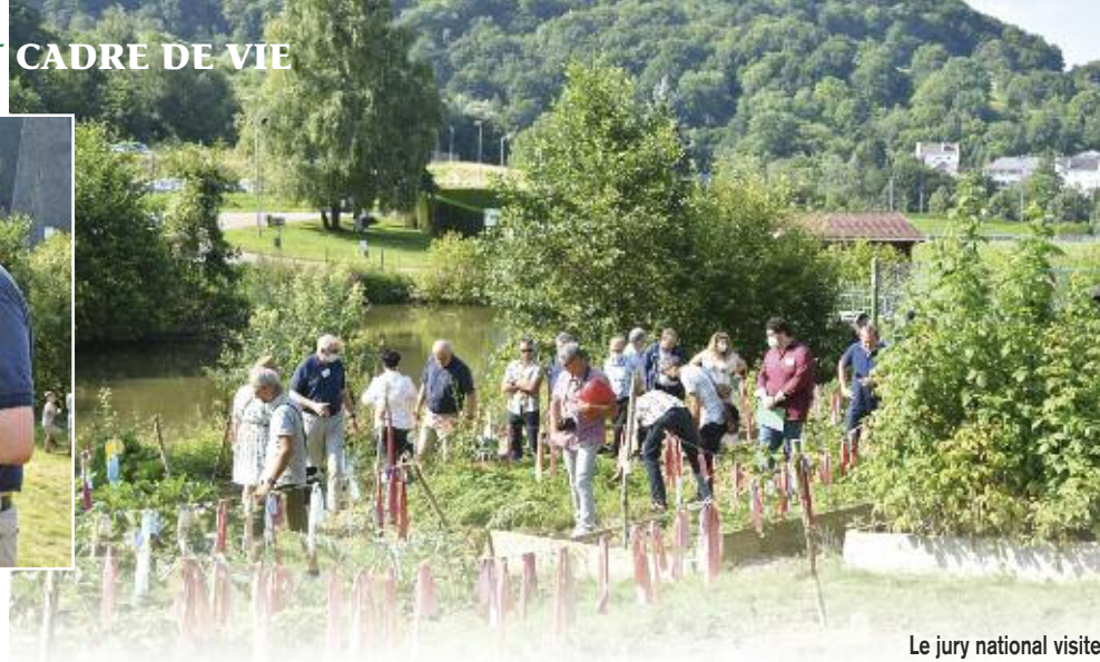
Le jury national visite les jardins du Fond Saint Martin