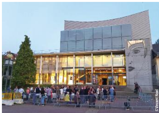
L'Espace Culturel a célébré ses 20 ans de programmation le 8 septembre