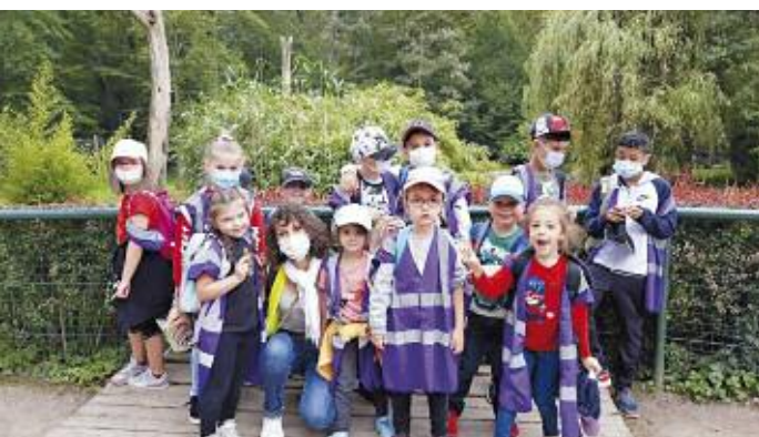
Visite au Parc Merveilleux de Bettembourg