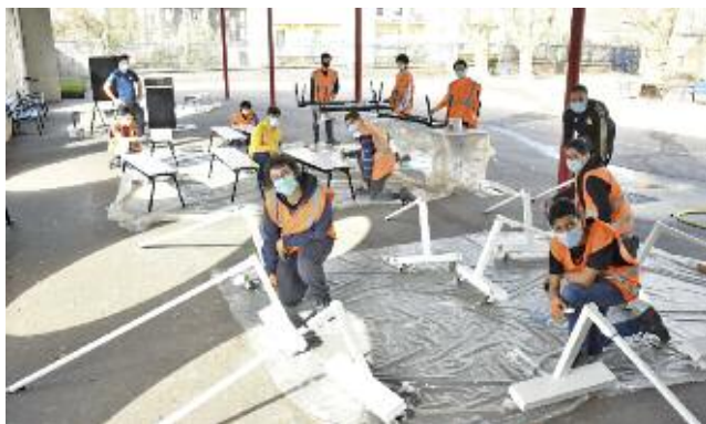
Remise en peinture des poteaux de badminton du gymnase C