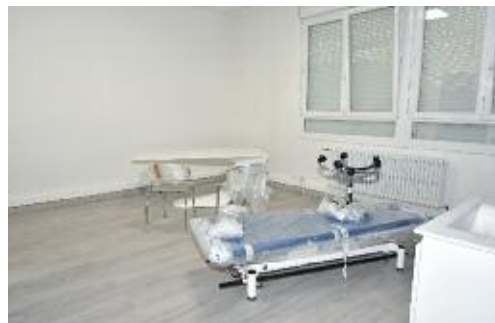
Le cabinet du kinésithérapeute en cours d'aménagement

L es ateliers municipaux ont réalisé dernièrement l'extension du Pôle santé du Petit Moulin. Dans les locaux anciennement utilisés par la médecine scolaire, ils ont aménagé un cabinet avec salle d'attente dans lequel exerce désormais un nouveau kinésithérapeute.