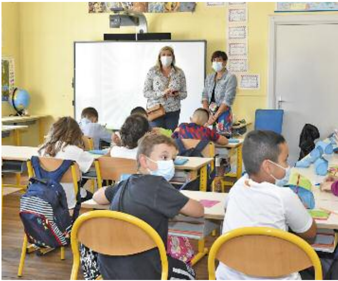
A l'école élémentaire de la Ville Basse