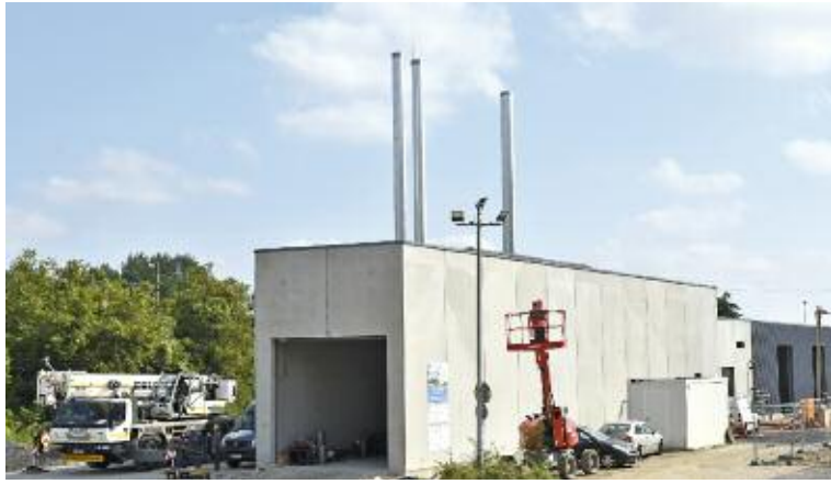
La chaufferie biomasse est désormais dotée de tous ses équipements