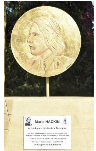
Le médaillon en acier doré à l'or fin et la plaque commémorative