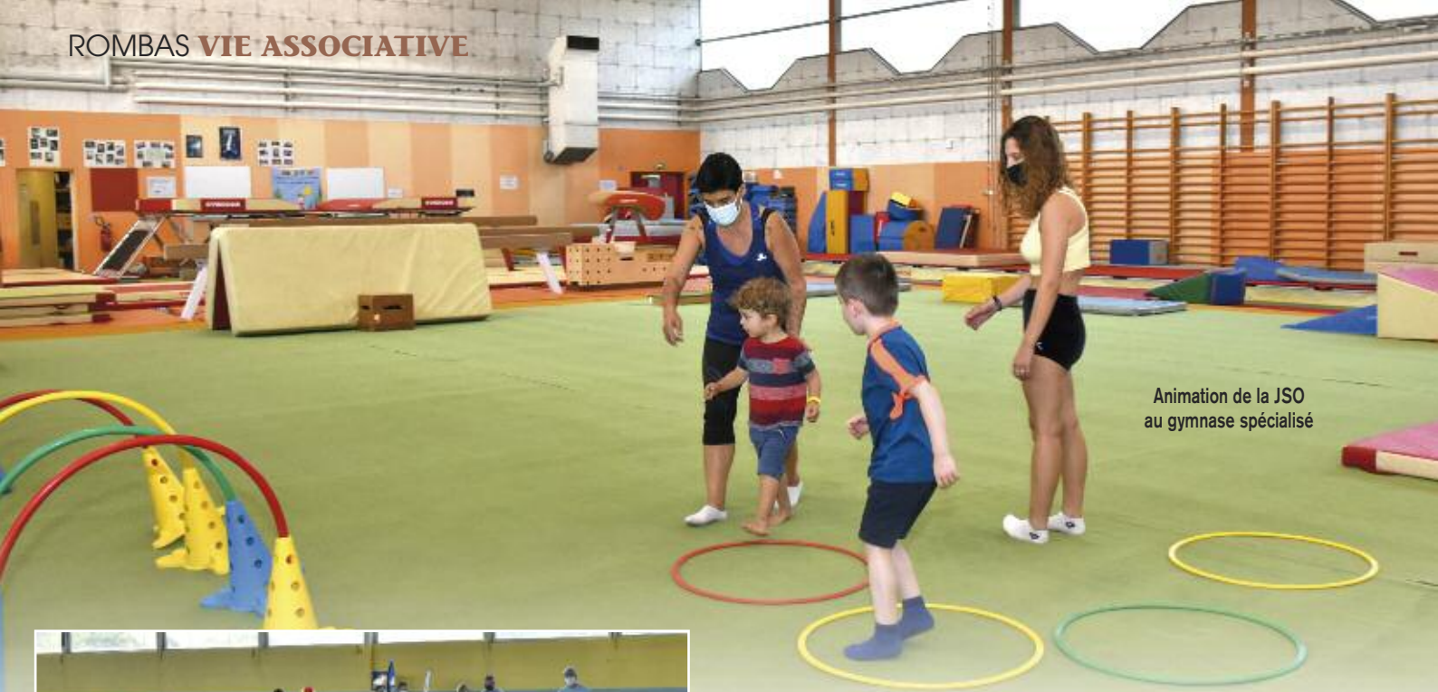
Animation de la JSO au gymnase spécialisé