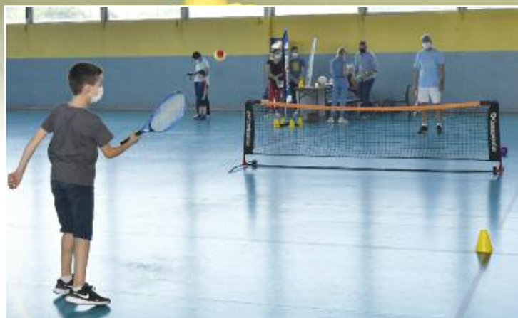
Atelier tennis au gymnase C par le TCVO