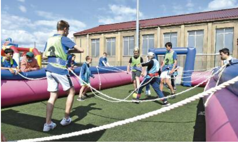
Une partie de baby foot géant sur le stade du lycée