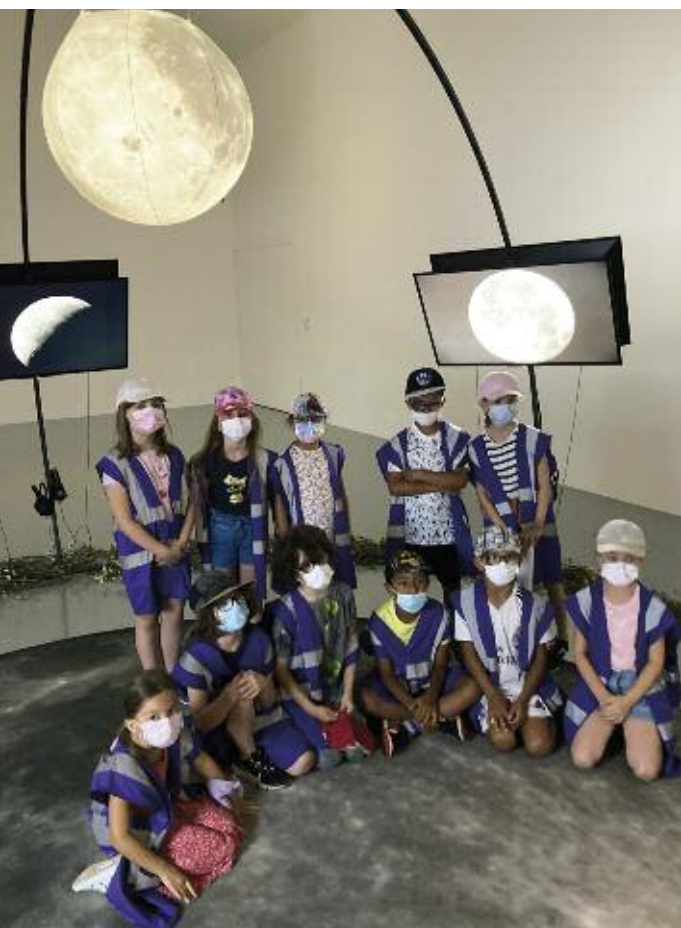
Sortie au FRAC de Metz