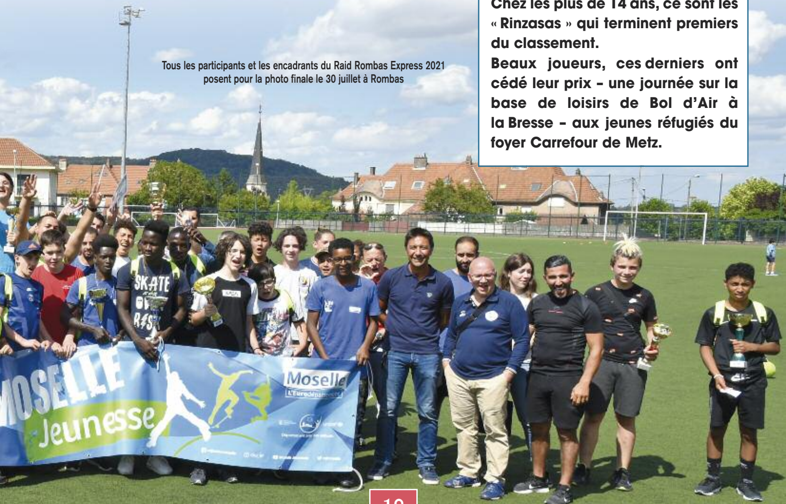
Tous les participants et les encadrants du Raid Rombas Express 2021 posent pour la photo finale le 30 juillet à Rombas

Le tout proposé et encadré par les membres des clubs sportifs des villes de Rombas, Clouange, Rosselange, Moyeuve-Grande et Maizières-lès-Metz. La piscine de Joeuf, quant à elle, a privatisé ses bassins le temps d'un après-midi.