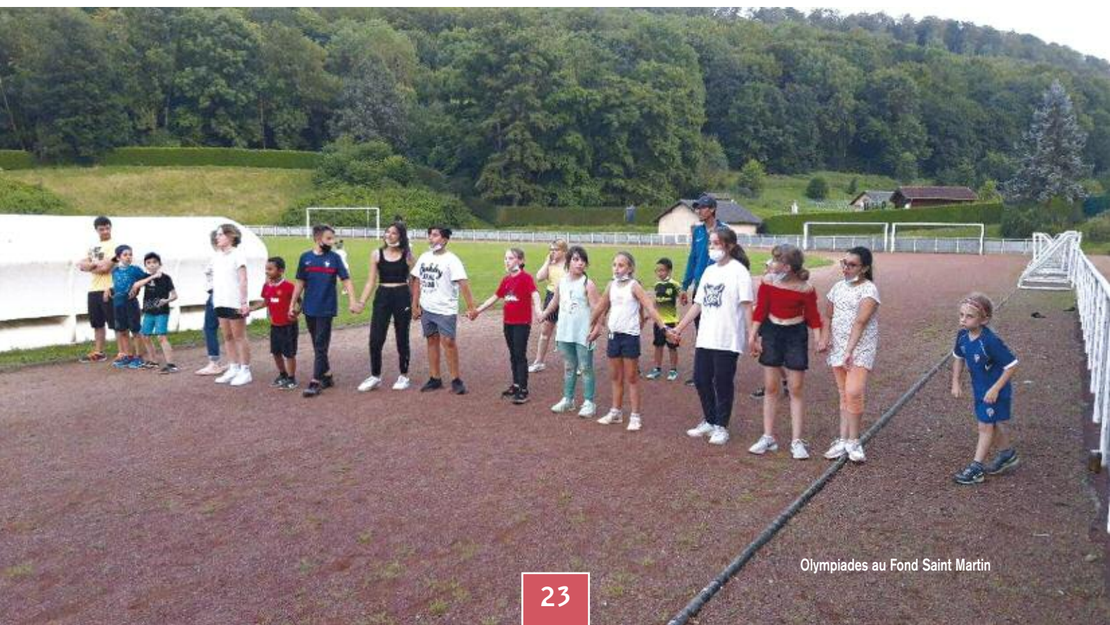
Olympiades au Fond Saint Martin