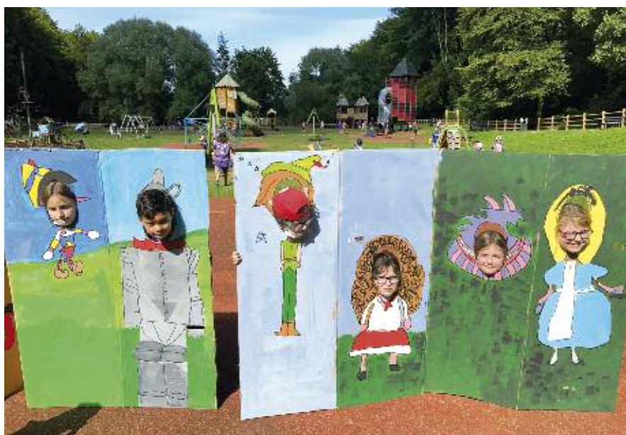
Photo call au Fond Saint Martin

De bien jolis souvenirs de cet été 2021, en attendant d'en créer d'autres lors du prochain centre aéré d'automne.