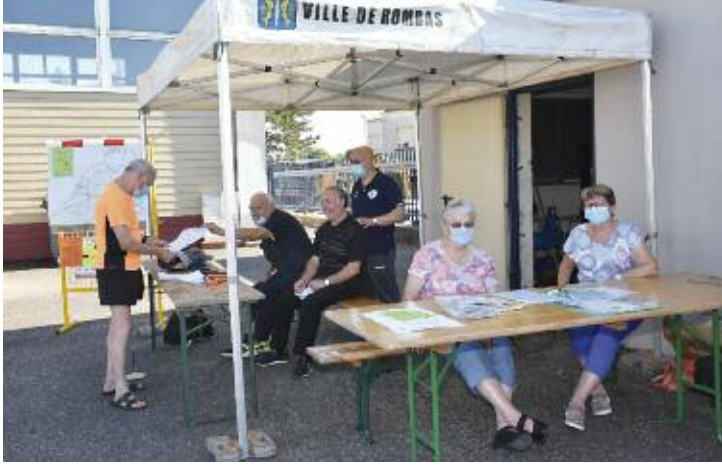
Stand du Ping Pong Vétérans