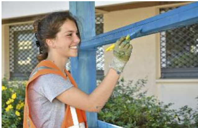
Mise en peinture du Troc aux plantes