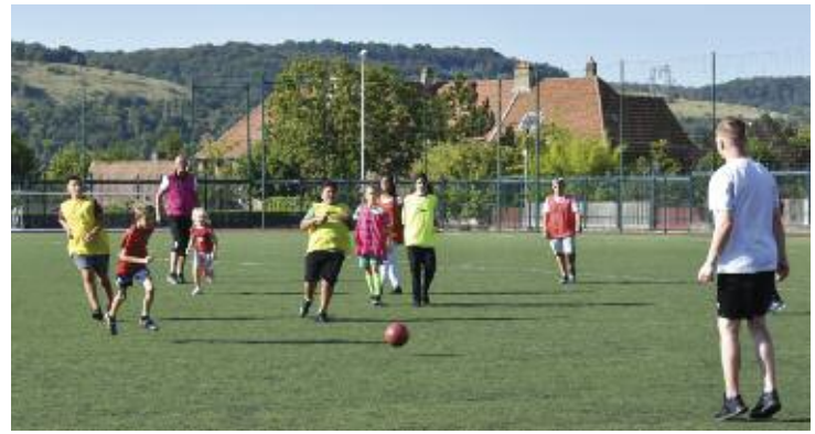
Animation football sur le stade par l'ULR

➤ Cette formule, issue d'un partenariat entre la Ville et les associations sportives, était tellement séduisante qu'elle a attiré de nombreux visiteurs. Sportifs individuels ou familles, il y en avait pour tous les publics et tous les âges : aikido, badminton, basketball, football, gymnastique, handball, ping-pong, vélo, tennis, équilibre et mémoire.