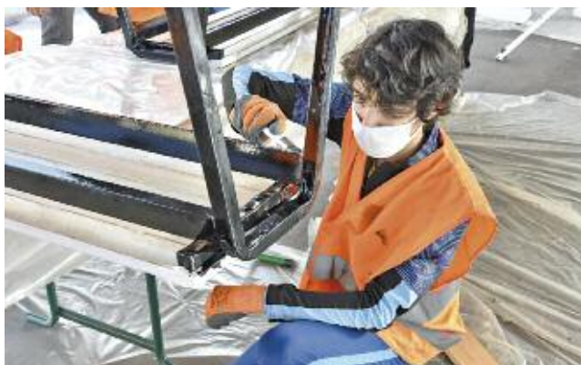
Remise en peinture des bancs du gymnase C