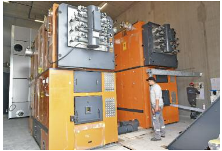
Les deux chaudières bois