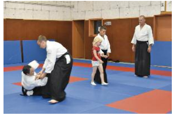
Animation au dojo par l'Aïkido Club

Associations et visiteurs sont repartis satisfaits de leur journée et persuadés que ces premières portes ouvertes des associations sportives de Rombas seront suivies d'autres éditions lors des prochaines rentrées.