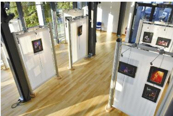
Exposition 20 ans de spectacles à l'Espace Culturel

L'occasion d'apprécier une animation musicale sur scène avec le groupe « The Bend » et de diffuser une rétrospective vidéo réalisée par Rombas TéléVision, la « télé locale » de l'Office Municipal de la Culture à partir des précieuses archives vidéo des deux dernières décennies. Ce fut également le moment idéal pour parler de la rentrée culturelle et présenter le programme de la saison 2021-2022.