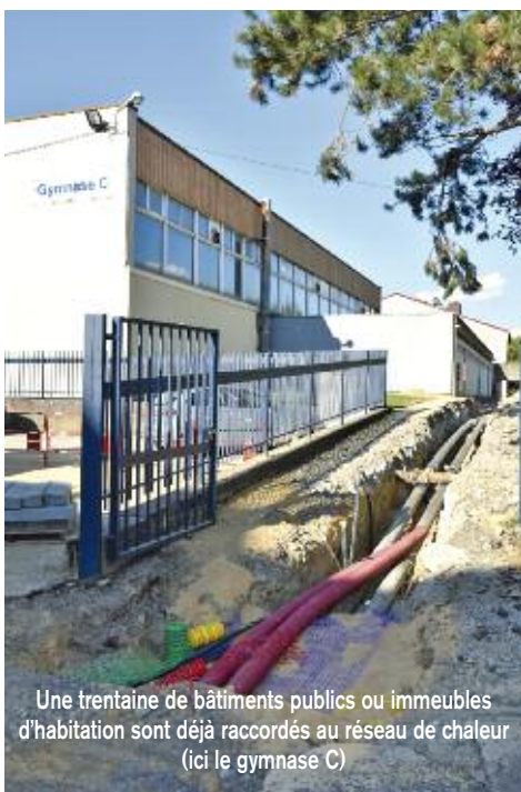
Une trentaine de bâtiments publics ou immeubles d'habitation sont déjà raccordés au réseau de chaleur (ici le gymnase C)

Moins de douze mois auront suffi pour doter la ville de Rombas d'un équipement exceptionnel et conforter son image positive, encore plus écologique et vertueuse.