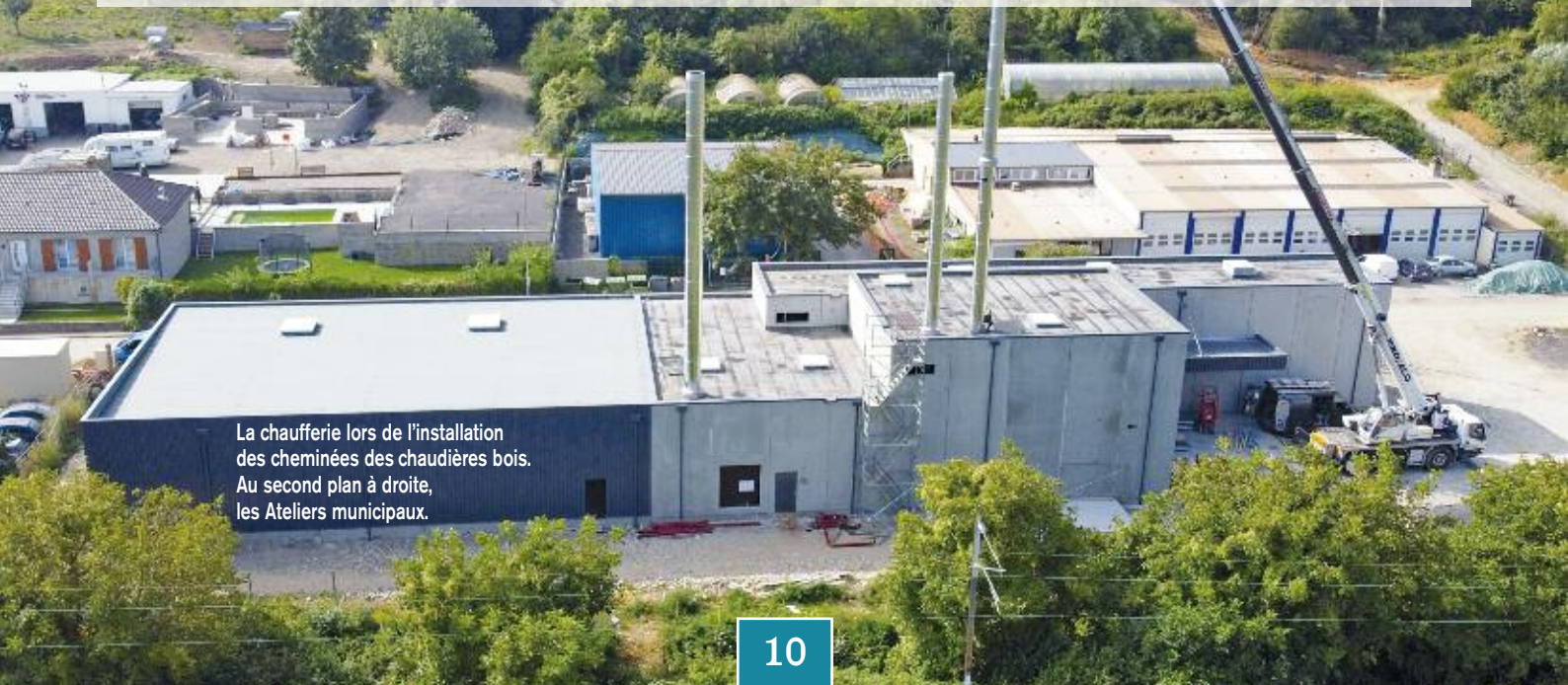
La chaufferie lors de l'installation des cheminées des chaudières bois. Au second plan à droite, les Ateliers municipaux.

Sa vocation est de compenser la forte demande d'eau chaude à certaines heures de pointe. Il permet ainsi de maintenir le réseau à température et pression constante même lorsque les échanges thermiques sont les plus forts entre le réseau de chaleur et les utilisateurs. En effet, le réseau de chaleur ne sert pas seulement à fournir les calories nécessaires pour le chauffage. Des échangeurs thermiques mis en place dans les bâtiments raccordés servent aussi à mettre à température l'eau chaude sanitaire.