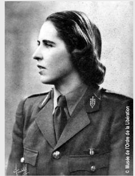
© Musée de l'Ordre de la Libération

Les 1038 Compagnons de la Libération ne comptent parmi eux que 6 femmes. Marie Hackin fut la première d'entre elles. Et les époux Hackin sont le seul couple dont les deux membres sont « Compagnons de la Libération ».