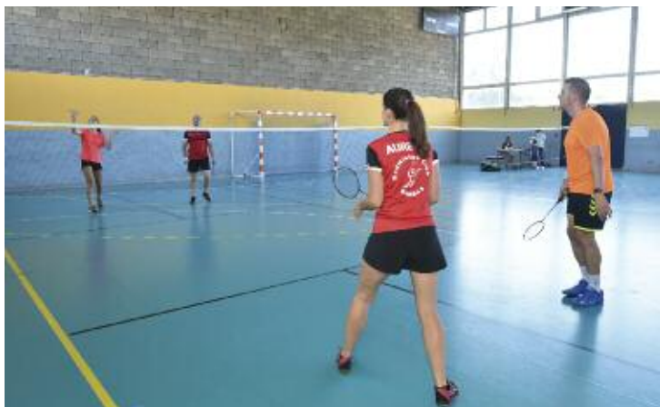
Atelier du Badminton Club au gymnase C