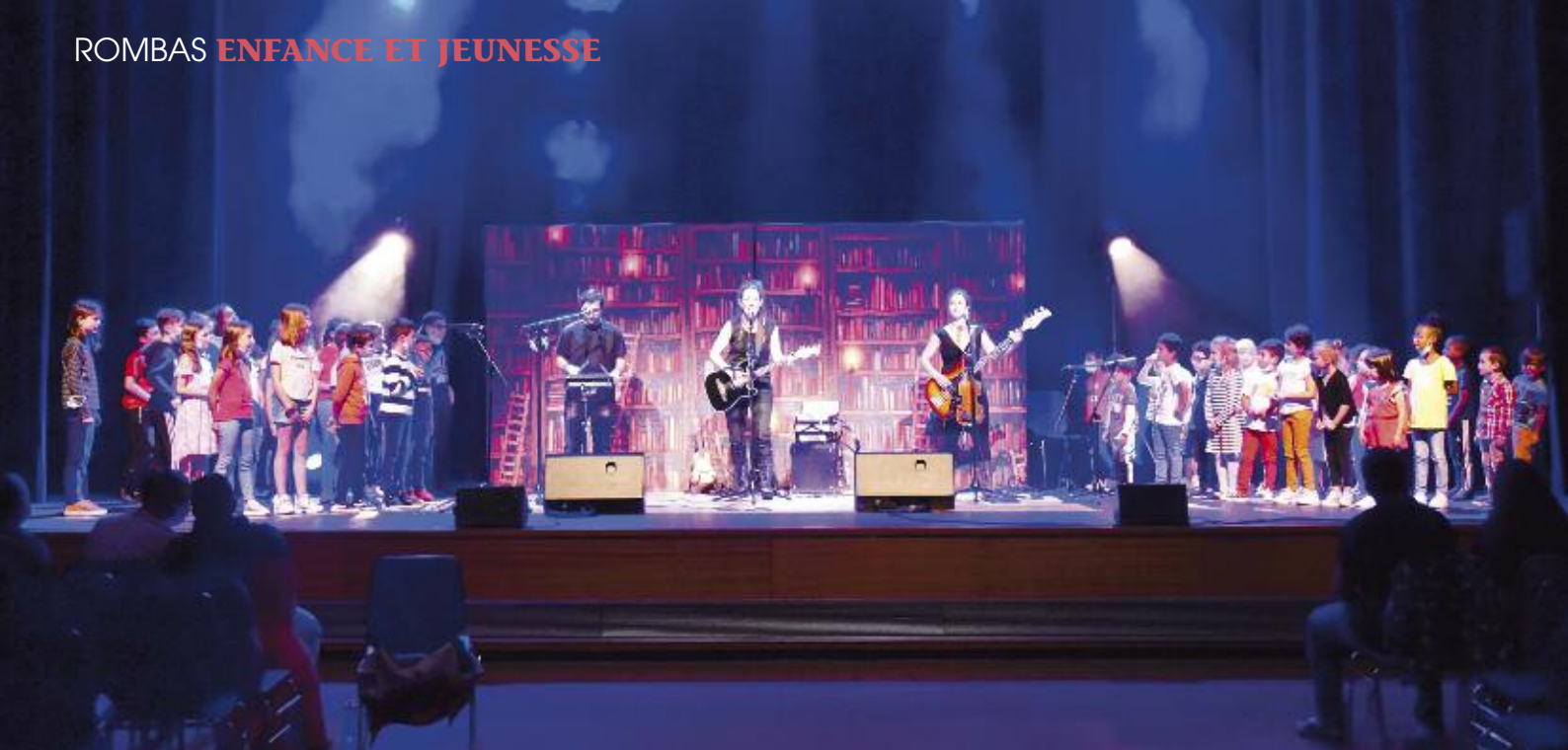
Spectacle musical interprété par les enfants du centre aéré et encadré par Mylène Willaume