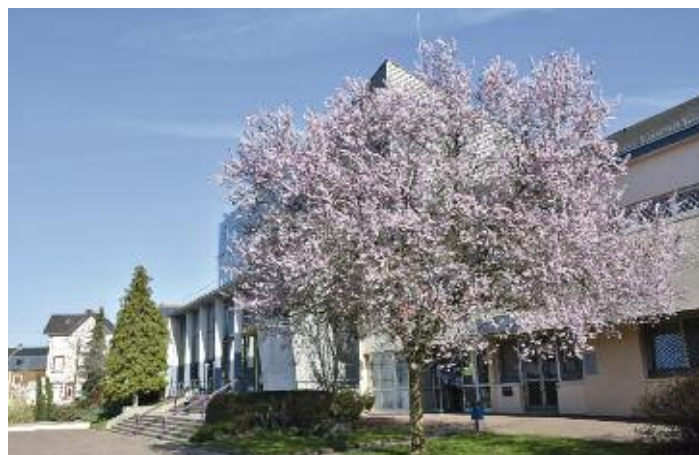
Le patrimoine arboré est un des critères majeurs pour l'obtention de la 4 e fleur