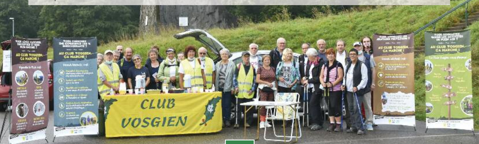
Les randonneurs accueillis au Fond Saint Martin par le Club Vosgien