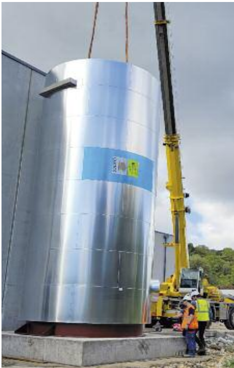
Le ballon d'eau chaude de 50 mètres cubes en cours d'installation