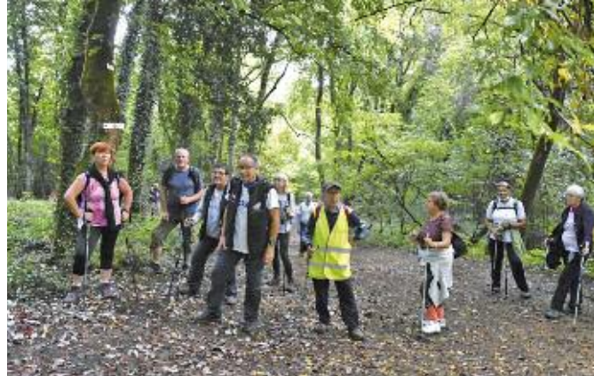
Sur le chemin de la Tour. Une petite halte avant la montée finale