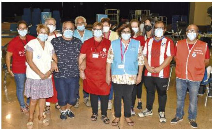
L'Amicale des Donneurs de Sang bénévoles de Rombas-Pierrevillers est toujours heureuse de vous accueillir