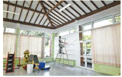
Travaux de peinture à la maternelle du Rond Bois