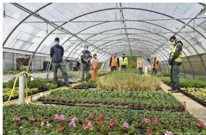
Le service des Espaces Verts de la Ville produit ses propres fleurs