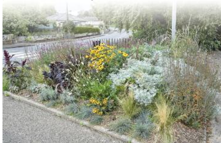
Le fleurissement évolue : aujourd'hui plus d'herbacées, de vivaces, d'espèces locales

Fort de ces découvertes, le jury national a statué lors de son assemblée plénière du 22 septembre 2021 et a décidé de maintenir Rombas au plus haut niveau parmi les Villes et Villages fleuris de France.