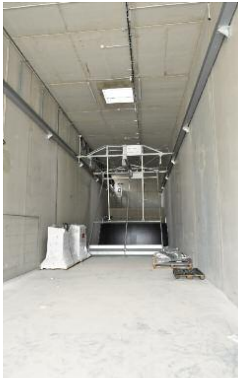
Le local de stockage des plaquettes forestières qui alimenteront les chaudières bois