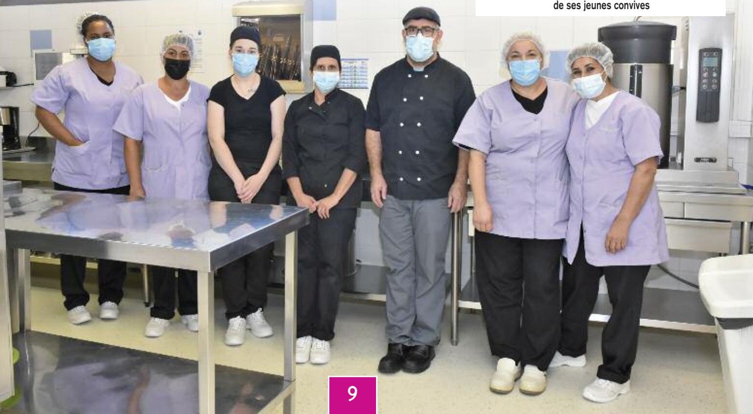
Toute l'équipe de restauration : cuisine et service