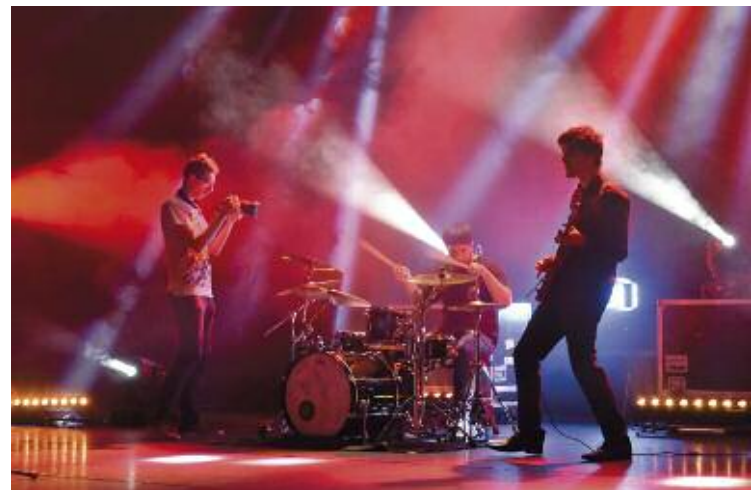
Le groupe "Soledad" a enregistré son clip Migraine à l'Espace Culturel au cours de l'été