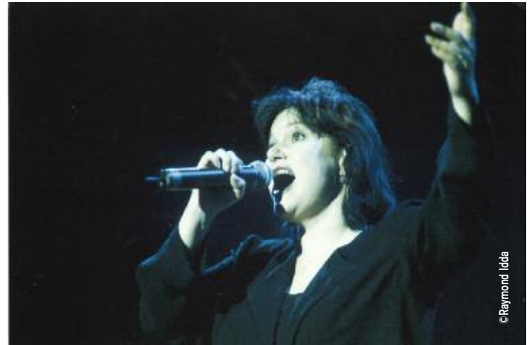
Gérard Darmon et Maurane, deux des innombrables artistes qui ont fait vibrer l'Espace Culturel et ses spectateurs