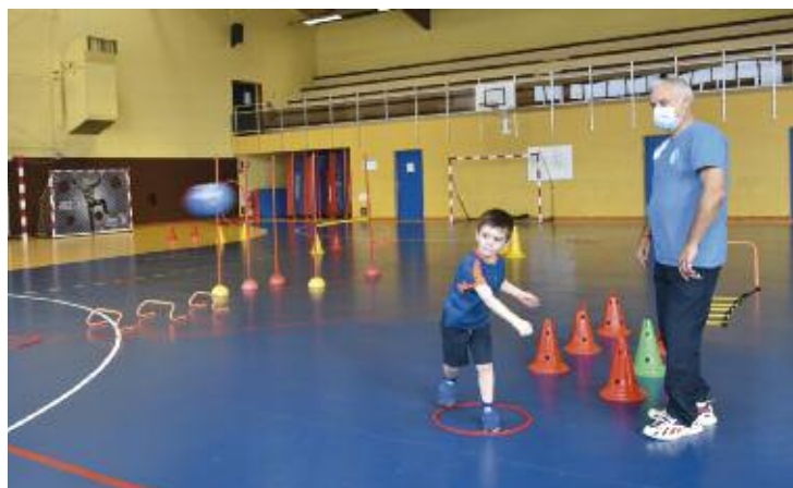
Atelier du Hand Ball Club au COSEC