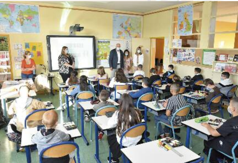
Ecole élémentaire de Villers