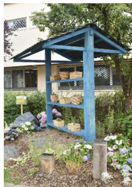
Le troc aux plantes, place de l'Hôtel de Ville

Ce troc aux plantes a été construit conjointement par le service des Espaces Verts et les Ateliers municipaux. Il est situé place de l'Hôtel de Ville à deux pas de la Mairie devant le bureau des Finances Publiques.