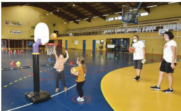
Initiation au basket par le Rombas Olympic Club au COSEC