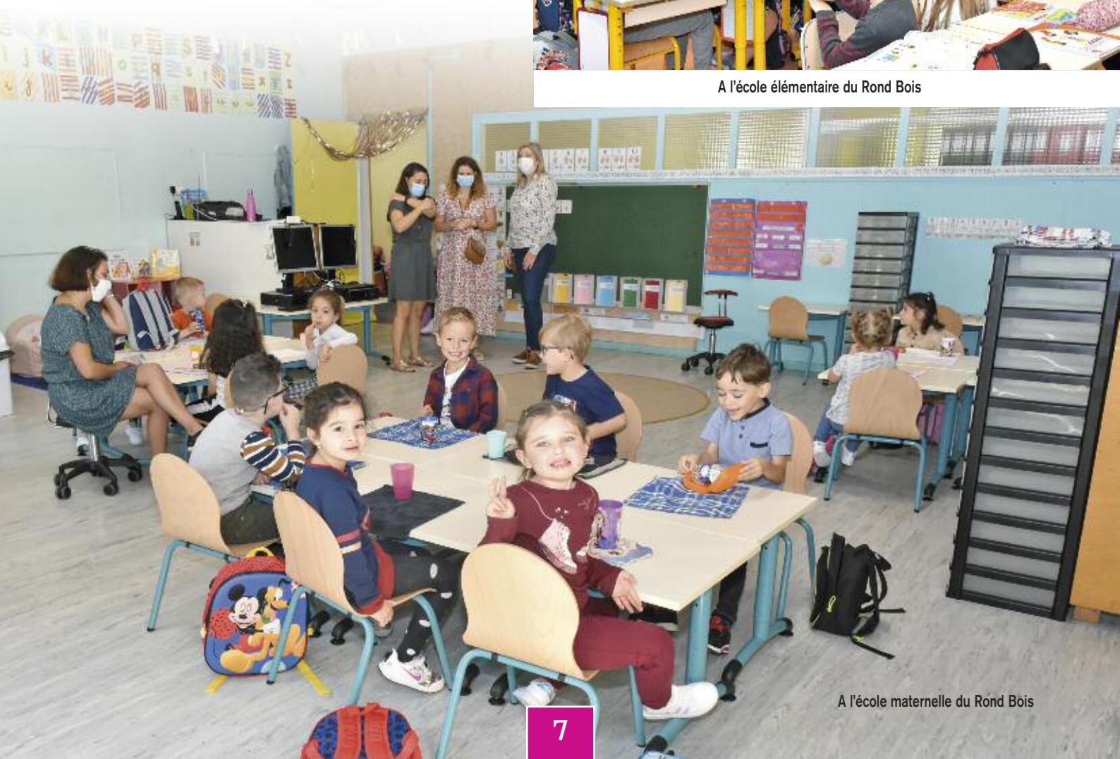
A l'école maternelle du Rond Bois