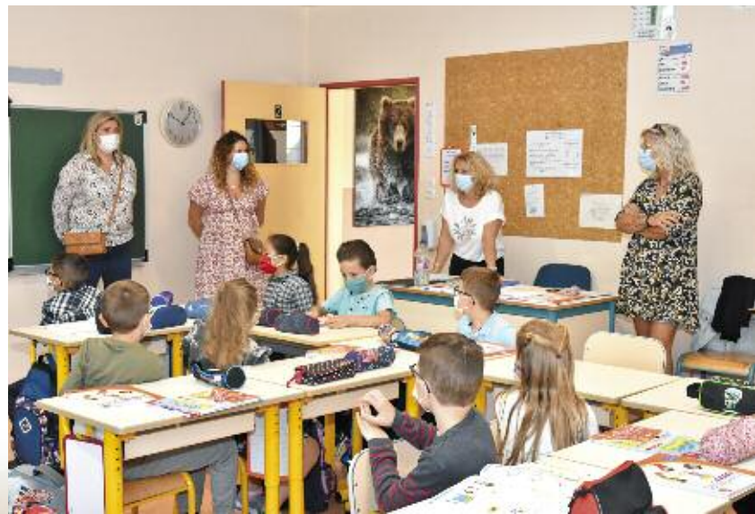
A l'école élémentaire du Rond Bois

Pour cette année scolaire 2021-2022 ce sont 278 élèves de maternelle et 509 élèves de classes élémentaires qui sont accueillis dans les écoles de Rombas.