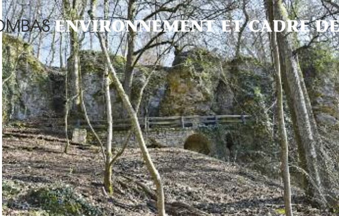
Le site des Roches à 20 minutes de marche du Fond Saint Martin