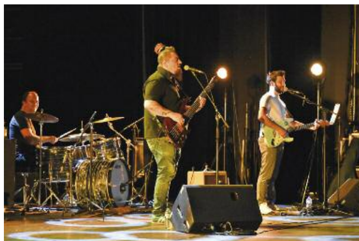
Le groupe "The Bend" a animé la soirée marquant les 20 ans de l'Espace Culturel