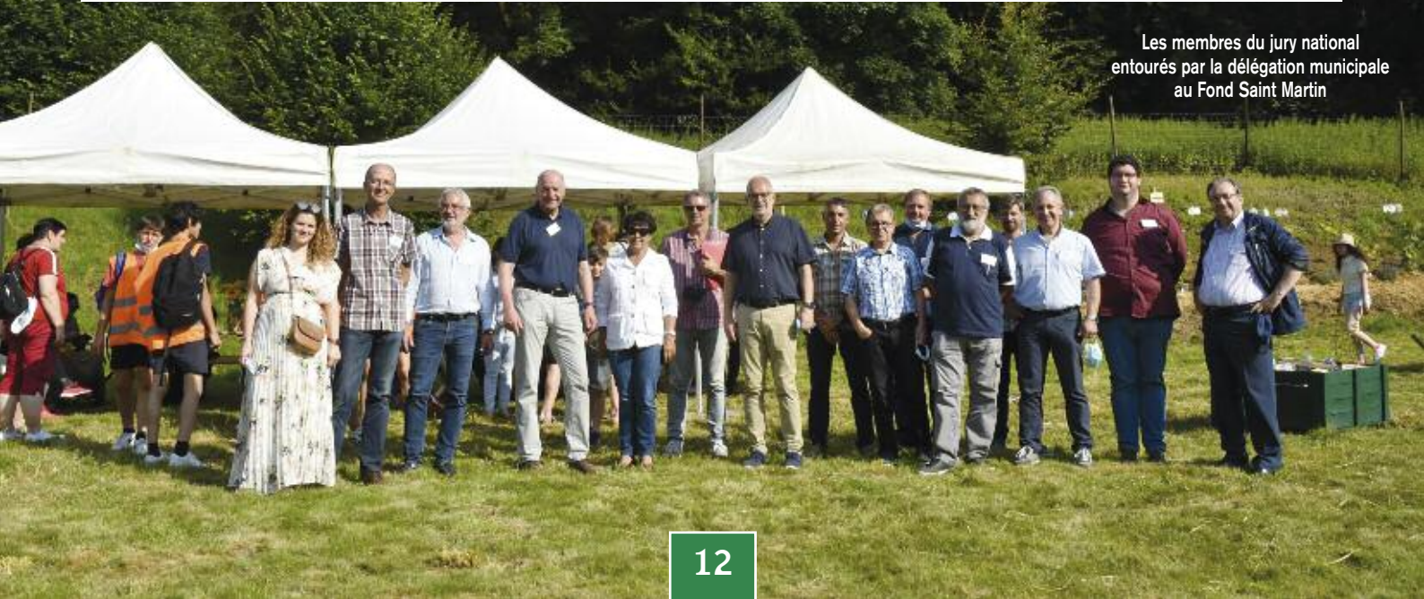
Les membres du jury national entourés par la délégation municipale au Fond Saint Martin