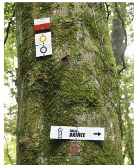
Le nouveau fléchage complète celui mis en place par le Club Vosgien