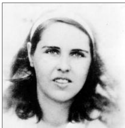
Marie HACKIN, 1 ère femme Compagnon de la Libération