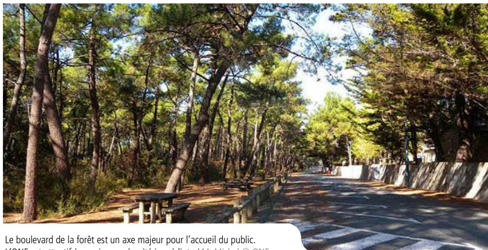
Le boulevard de la forêt est un axe majeur pour l'accueil du public. L'ONF est attentif à sa mise en sécurité immédiate

A partir du 11 mars, l'ONF effectue des coupes sanitaires et d'amélioration en parcelles 50, 51 et 52 de la forêt domaniale de Longeville, le long du boulevard de la forêt, sur la commune de la Faute-sur-Mer.