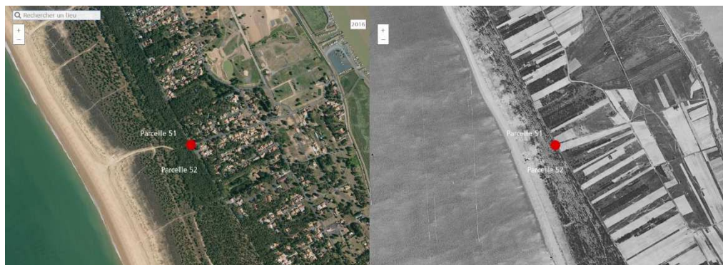
Photos aériennes des parcelles 51 et 52, à travers le temps, des années 60 à nos jours

Les forêts domaniales du littoral sont assez jeunes... seulement 150 ans ! Plantées au XIX ème siècle, l'ONF prend soin aujourd'hui de la 3 ème voire la 4 ème génération de résineux en forêt domaniale de Longeville. L'ONF y favorise son développement en y appliquant une gestion durable et maîtrisée. Pour répondre aux enjeux d'aujourd'hui et demain, et pour que l'histoire continue, les forestiers interviennent tous les ans en forêt pour maintenir la bonne santé et le renouvellement des peuplements tout en assurant la sécurité de tous.