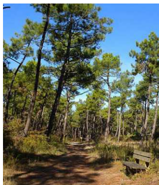
M. Michel © ONF