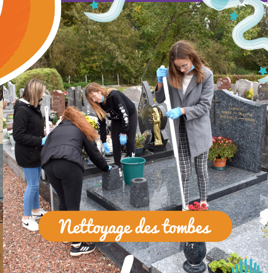
Nettoyage des tombes