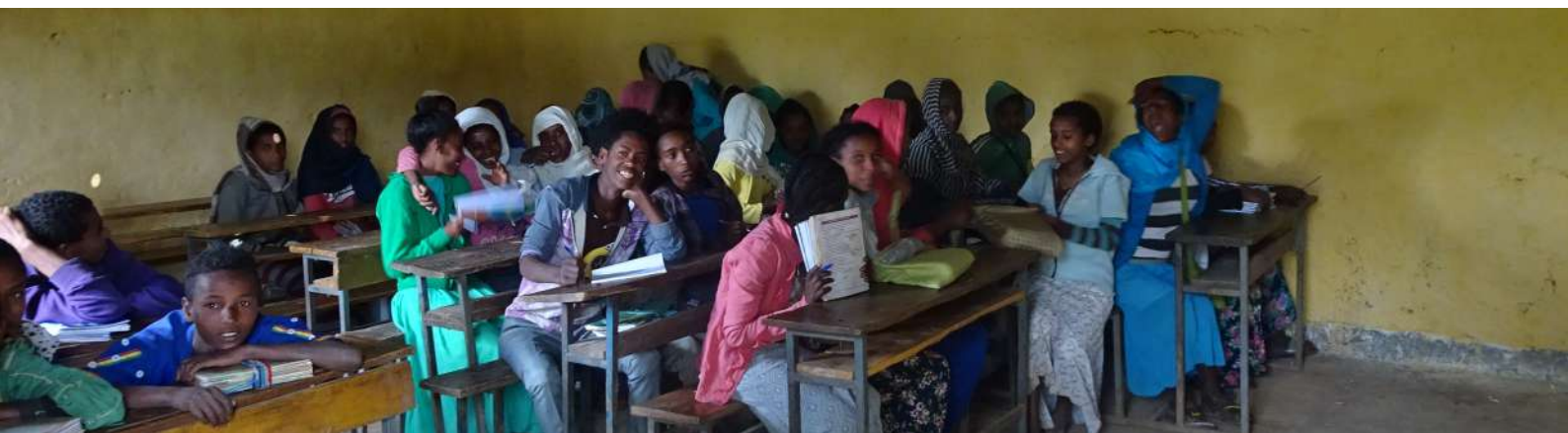
La nouvelle salle d'activité et l'équipe pédagogique

En concertation avec le directeur et l'équipe pédagogique de l'école, l'association a participé à la construction d'une nouvelle salle d'activité. Celle-ci de 60 m 2 sert de bibliothèque, de salle d'arts graphiques et d'informatique. Du matériel a été acheté pour équiper cette salle (tables, chaises, étagères et aussi deux ordinateurs supplémentaires). La mise en place de deux panneaux solaires sur le toit permet d'utiliser les 3 ordinateurs qui servent aux instituteurs et aux élèves du secondaires.