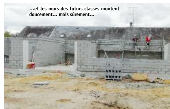
...et les murs des futures classes montent doucement... mais sûrement...