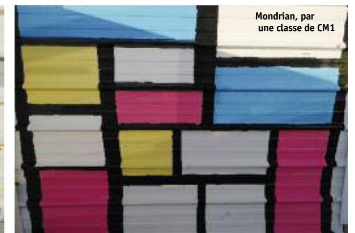
Mondrian, par une classe de CM1

pirer des œuvres de Sonia Delaunay, basées sur des motifs géométriques. L'autre classe de CM2 a commencé à réaliser un trompe l'oeil.