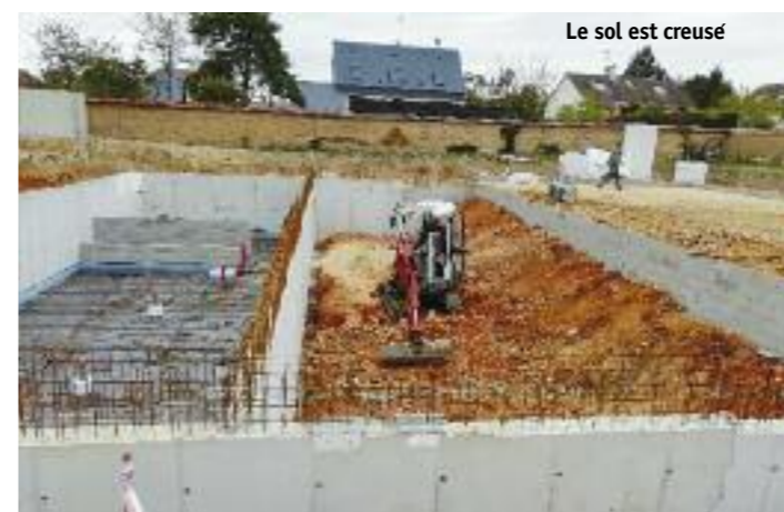
Le sol est creusé