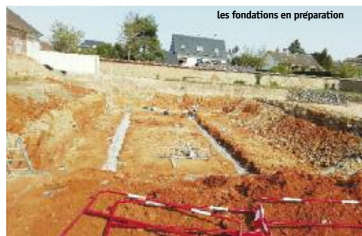
les fondations en préparation