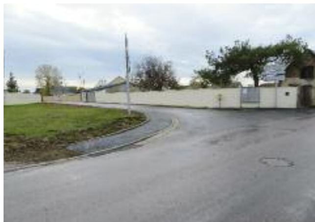
intersection rue de la Remise et des Moissonneurs

Nous déplorons beaucoup de retard du fait de la COVID-19.