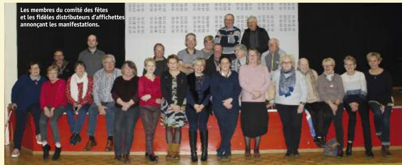
Les membres du comité des fêtes et les fidèles distributeurs d'affichettes annonçant les manifestations.

L'équipe du comité des fêtes vous présente ses meilleurs vœux pour l'année 2021 et espère vous retrouver très vite.