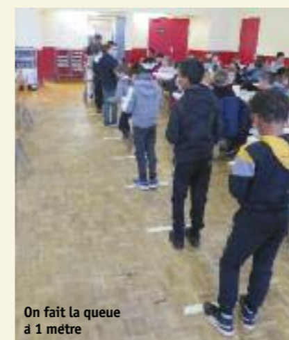
On fait la queue à 1 mètre

2 c'est le nombre de cars qui font la rotation entre les écoles et la salle des associations.