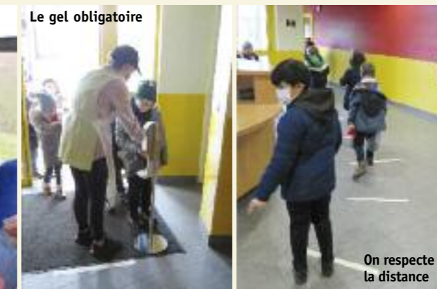
Le gel obligatoire