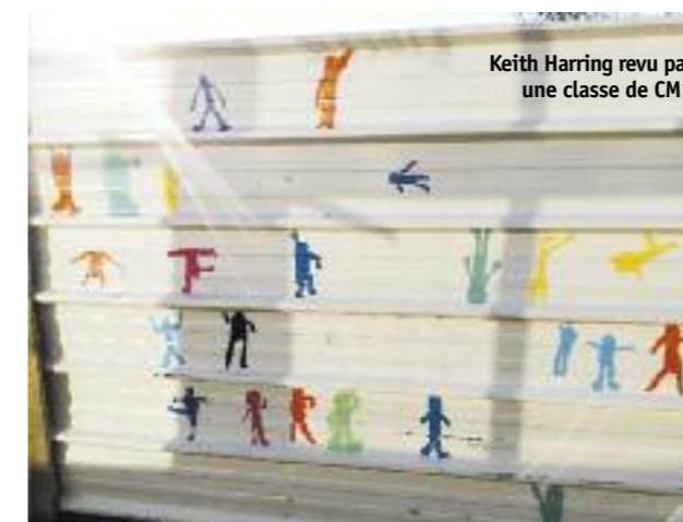
Keith Haring revu par une classe de CM1