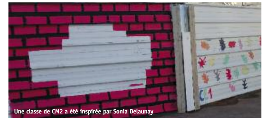
Une classe de CM2 a été inspirée par Sonia Delaunay

La fescue n'est pas encore terminée, mais la cour est déjà devenue plus gaie et colorée. Bravo aux petits et grands artistes !