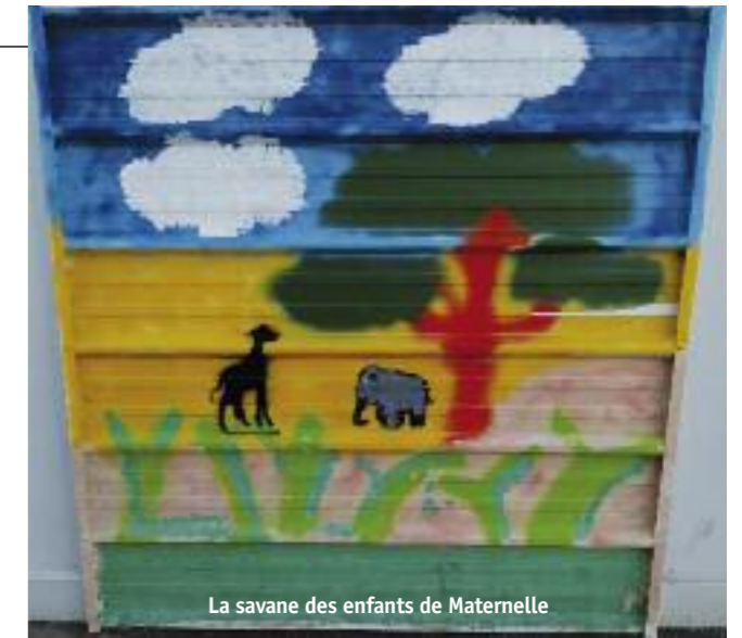
La savane des enfants de Maternelle

Les enfants de maternelle ont donc pu commencer sur le thème de la savane. Les deux classes de CE1 ont poursuivi en se référant au peintre Matisse, puis une classe de CM1 sur le modèle de Mondrian. La deuxième classe de CM1 a poursuivi en s'appuyant sur les œuvres de Keith Haring alors qu'une classe de CM2 va s'ins-