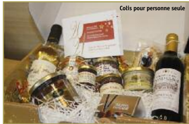
Colis pour personne seule

Cette année le CCAS a fait appel au magasin « Rendez-vous des gourmets » rue Chartraine à EVREUX pour composer ces colis.