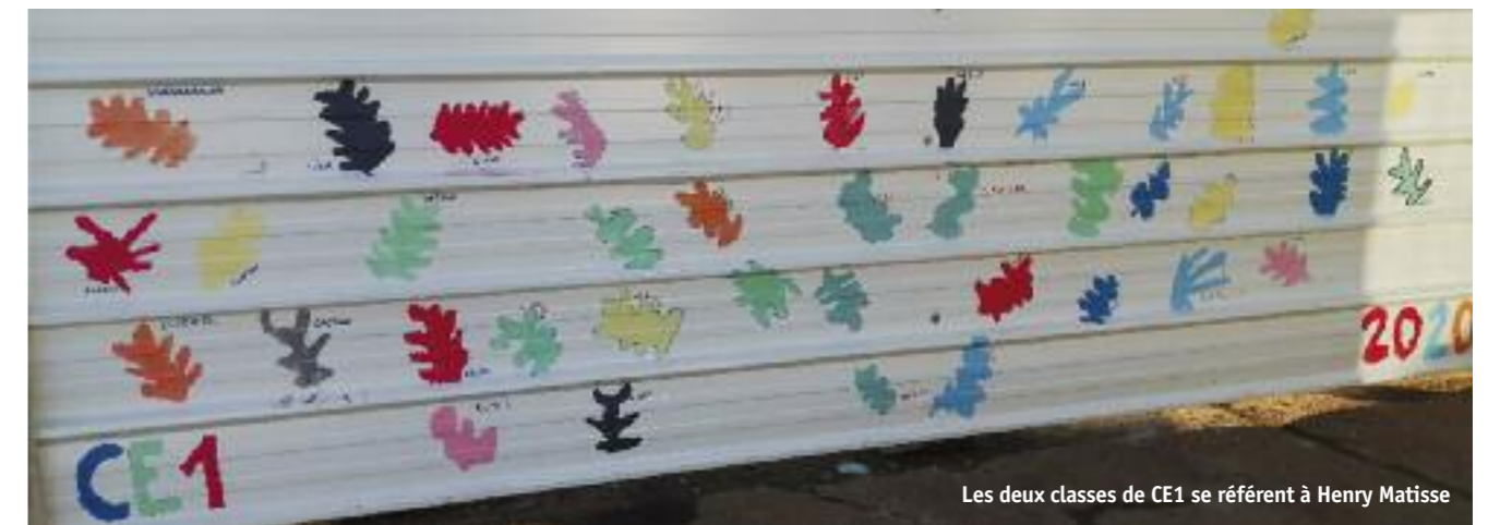
Les deux classes de CE1 se réfèrent à Henry Matisse