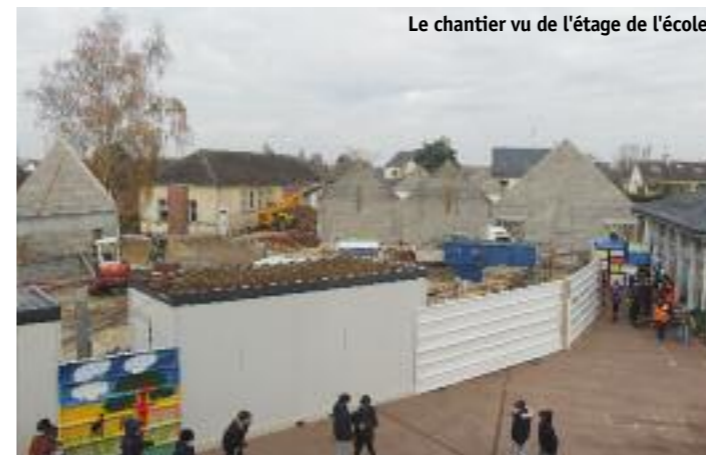
Le chantier vu de l'étage de l'école.