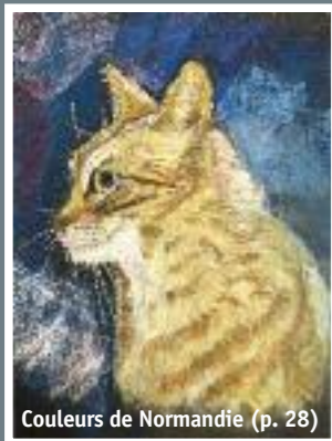
Couleurs de Normandie (p. 28)