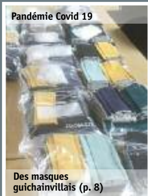
Pandémie Covid 19