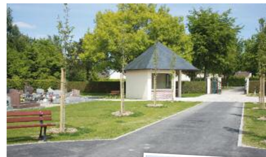
L'allée centrale retracée.

rosiers grimpants ont été plantés et fleuriront ainsi agréablement le site, dès le printemps.