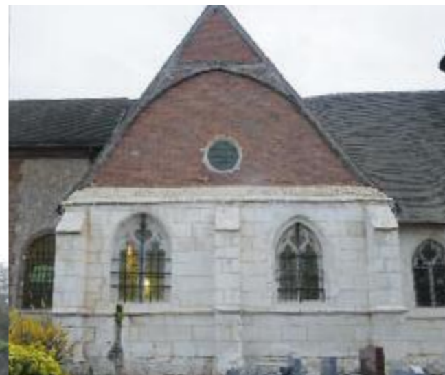
La façade nord restaurée