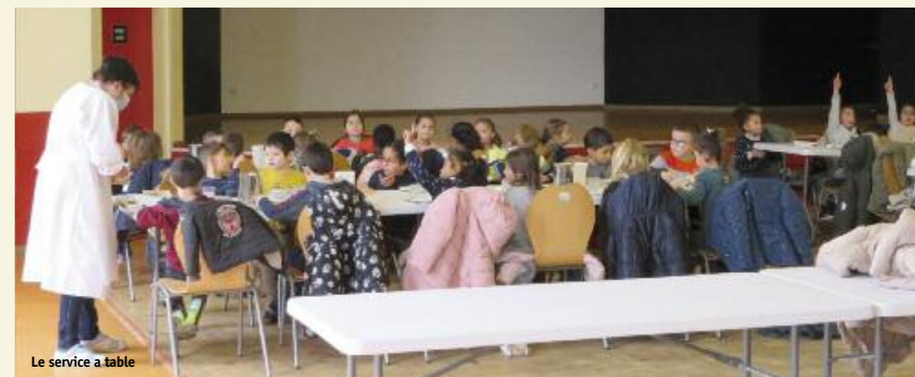
Le service a table

Bien entendu tous les protocoles sanitaires sont mis en place et respectés par toute l'équipe.