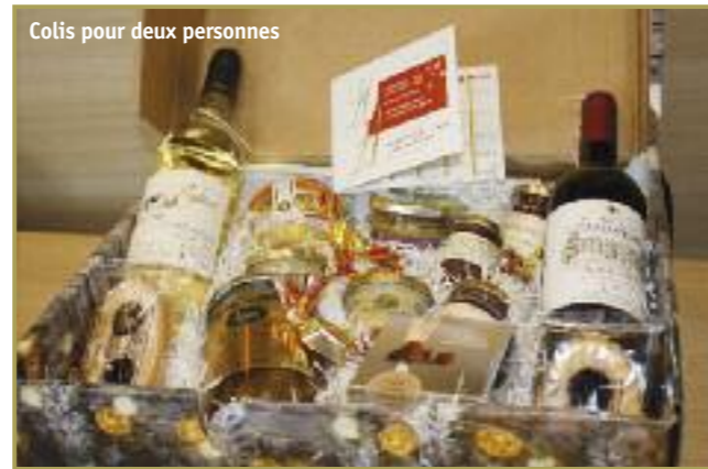
Colis pour deux personnes

Le 21 décembre dernier, pour la deuxième année, le CCAS n'a pas oublié les habitants de la commune, qui résident au foyer d'accueil médicalisé du bois de Melleville et à la maison d'accueil spécialisée de La Haye Bérou.