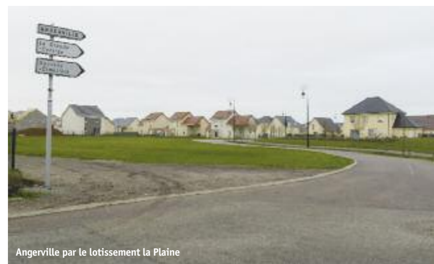
Angerville par le lotissement la Plaine