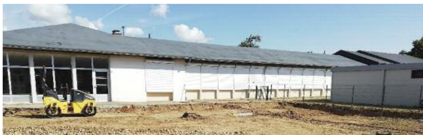
Les futures classes