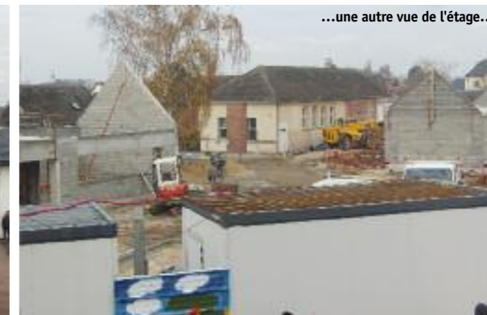
...une autre vue de l'étage...