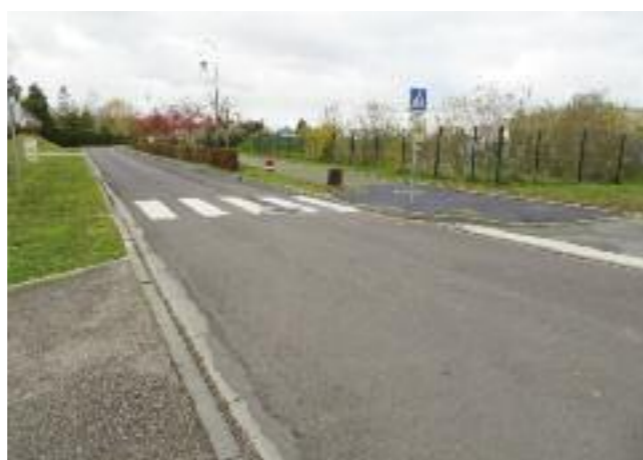
Passage protégé Salle des Associations