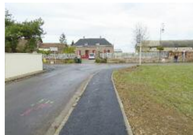
Trottoirs rue de la Remise