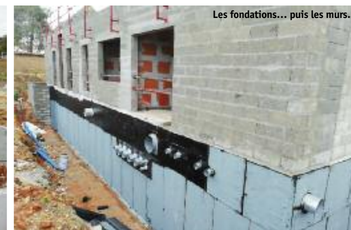
Les fondations... puis les murs...