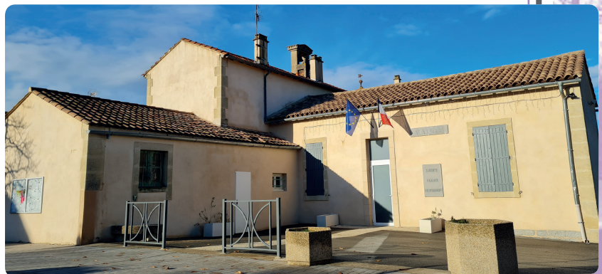
Les façades de la mairie et du secrétariat ont fait "peau neuve". Christophe Maurant a repeint les portes et volets durant l'automne.

Les rues concernées sont le début de la rue Principale et rue de l'Eglise afin de remettre en état des canalisations d'eau potable.