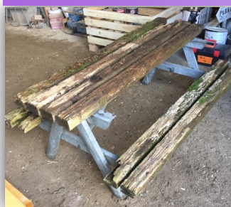
Rénovation et installation d'une nouvelle table avec bancs à l'aire de jeux