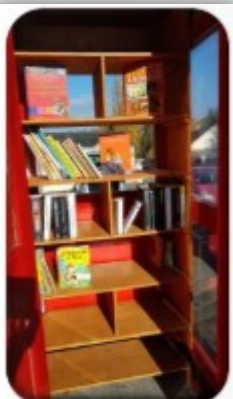
Cabine à livres