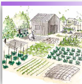
Création de jardins communaux