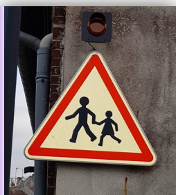
Panneau sécurité enfants