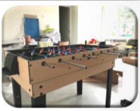
Jeux modulaires pour les enfants du périscolaire