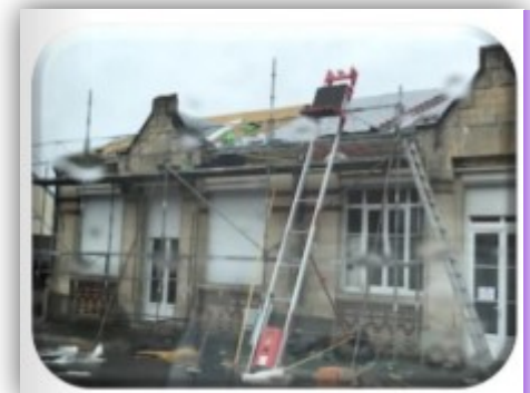
Réfection des toitures