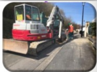
Renouvellement du réseau d'eau rue du Clos Chaly