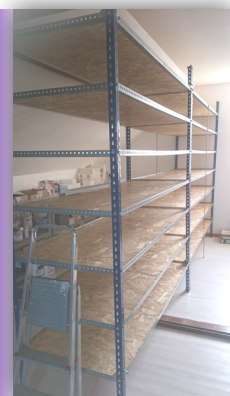
Installation de rayonnages pour les archives