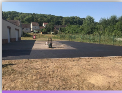
Agrandissement de la cour de l'école maternelle