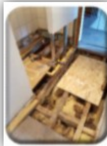
Réhabilitation d'un appartement communal