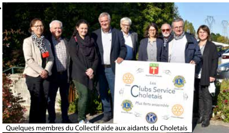
Quelques membres du Collectif aide aux aidants du Choletais

Ces animations, à la carte, doivent donner des clés aux aidants pour affronter les situations parfois délicates