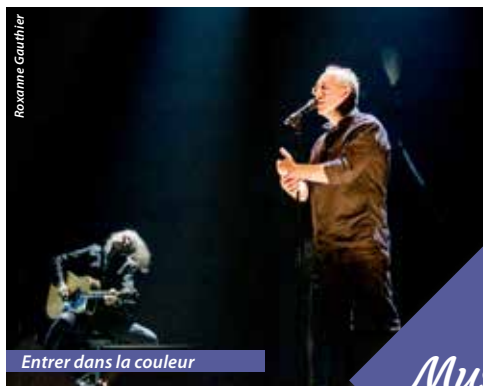
Entrer dans la couleur