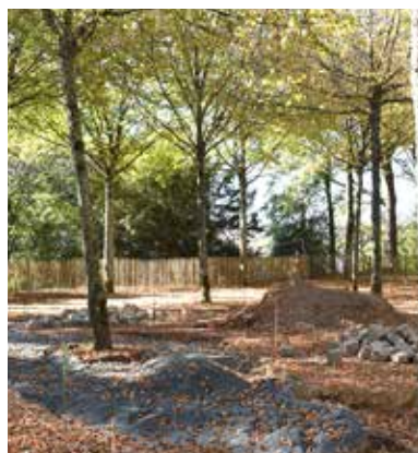
Le jardin du Mail dévoilera prochainement son nouveau visage.