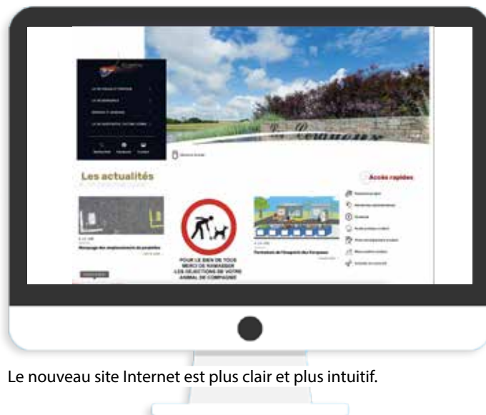
Le nouveau site Internet est plus clair et plus intuitif.

Ce nouveau site Internet n'empêche pas la communication papier. La Muni-