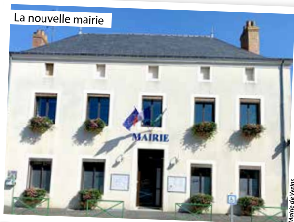
Mairie de Vezi

ns. La salle du conseil est dotée de panneaux en fer forgé découpé, de poutres mises en valeur et équipée d'un double vidéoprojecteur.