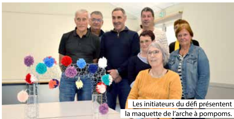
Les initiateurs du défi présentent la maquette de l'arche à pompons.

Pour réaliser ce pont multicolore garni de pompons de toutes tailles, le centre social met à disposition de ceux qui le souhaitent de la laine. Des explications rappelant comment procéder pour leur