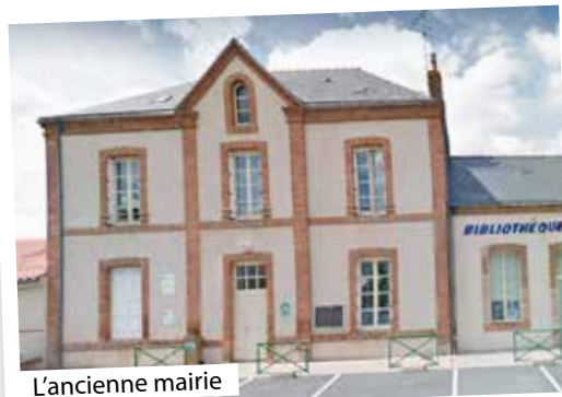
Mairie de Vezi