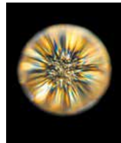
Coeur lumière E. F. Sobrino

De 10 h à 11 h, musée d'Art et d'Histoire, 27 avenue de l'Abreuvoir