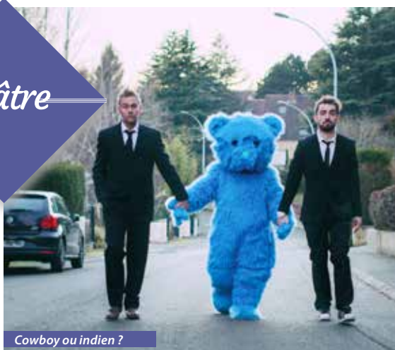
Cowboy ou indien ?