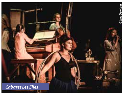
Cabaret Les Elles

Les Elles, groupe créé en 1994 par Pascaline Herveet, a élaboré un univers musical atypique.