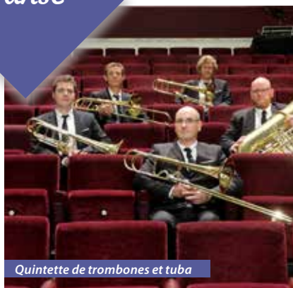
Quintette de trombones et tuba