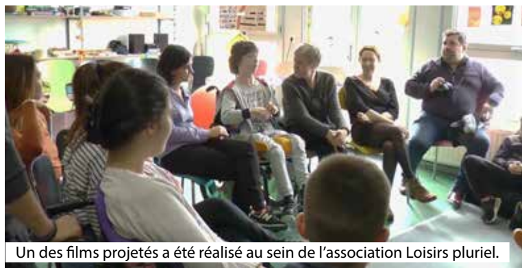
Un des films projetés a été réalisé au sein de l'association Loisirs pluriel.

Après une année d'interruption, les ciné-vidéastes amateurs vihierois organisent à nouveau leur gala d'automne, les mardi 9 et mercredi 10 novembre à 20h30, ainsi que le jeudi 11 novembre, à 15h, au Cinéfil, à Vihiers, commune déléguée de Lys-Haut-Layon. Le club a ainsi voulu marquer son 40 e anniversaire en programmant une troisième projection.