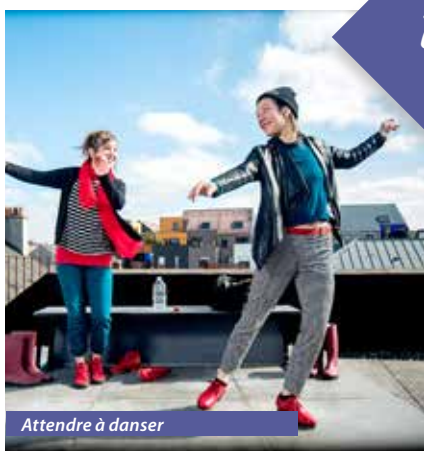
Attendre à danser