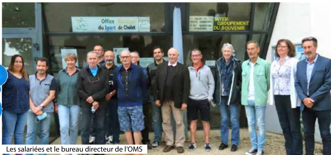
Les salariées et le bureau directeur de l'OMS