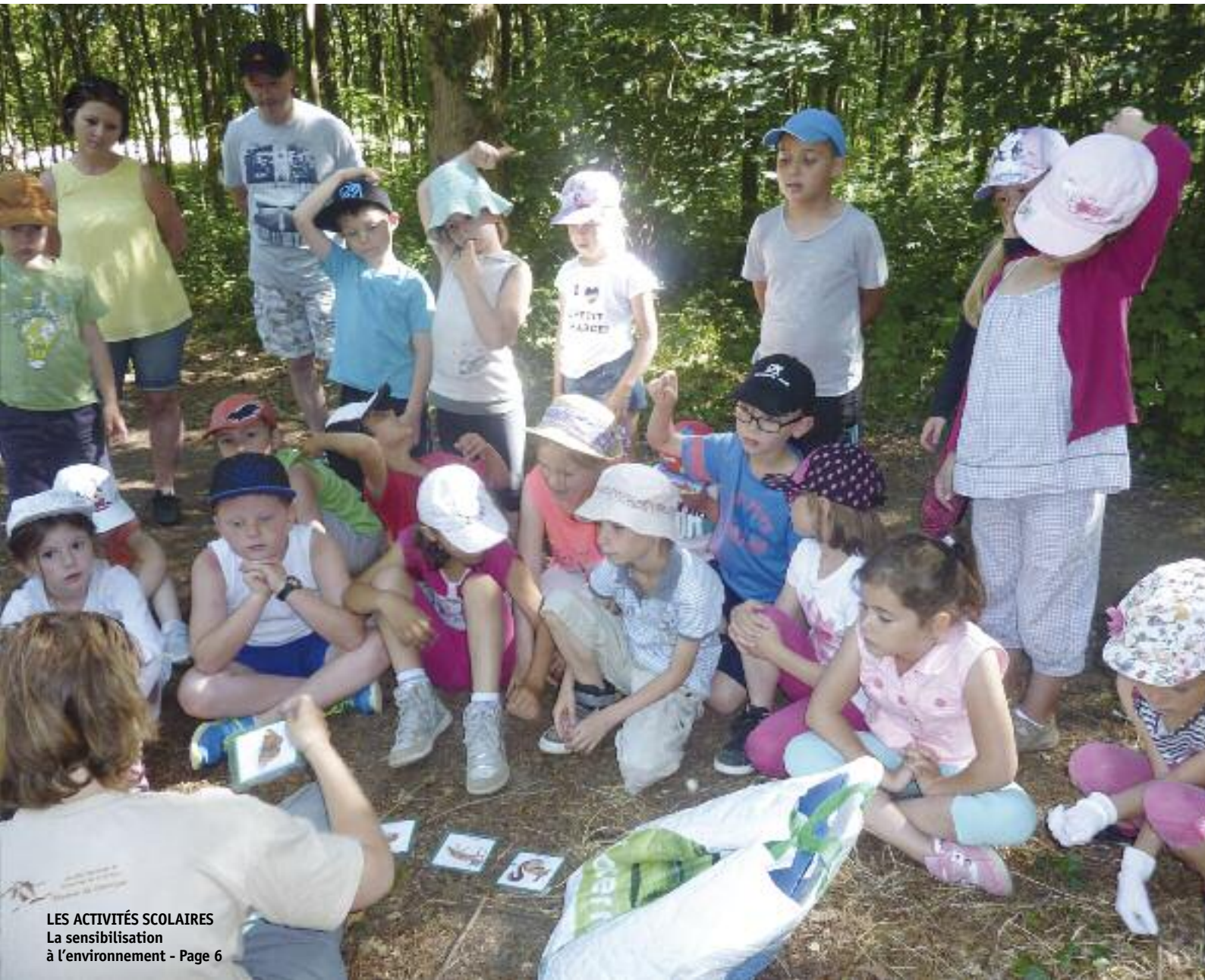
LES ACTIVITÉS SCOLAIRES La sensibilisation à l'environnement - Page 6