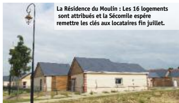
La Résidence du Moulin : Les 16 logements sont attribués et la Sécomile espère remettre les clés aux locataires fin juillet.

De Lucie Aubrac, résistante française, à Simone Veil, qui a fait voter le droit à l'avortement, de Mère Thérèse qui, par son action caritative, a consacré sa vie aux pauvres et aux malades, à Rosa Parks qui a lutté contre la ségrégation raciale aux États-Unis avec Martin Luther King, prix Nobel de la paix..., jusqu'à Nelson Mandéla leader des droits de l'homme en Afrique du Sud.