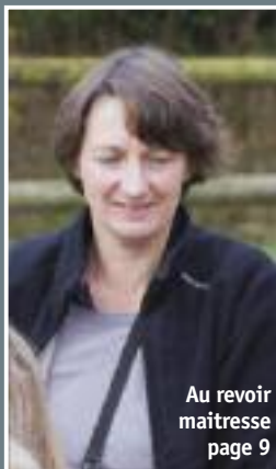
Au revoir maitresse page 9