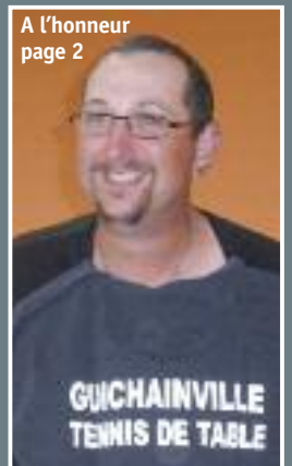
A l'honneur page 2