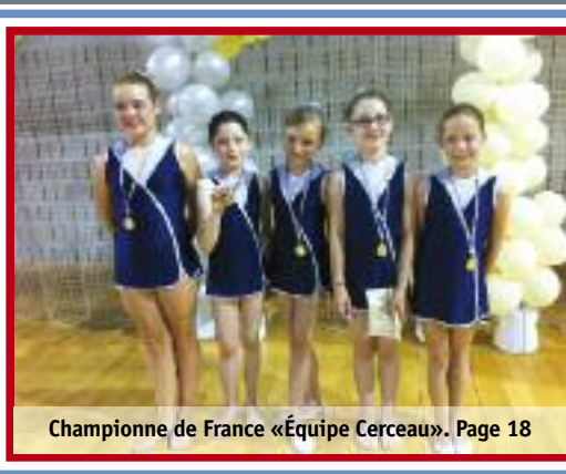
Championne de France «Équipe Cerceau». Page 18