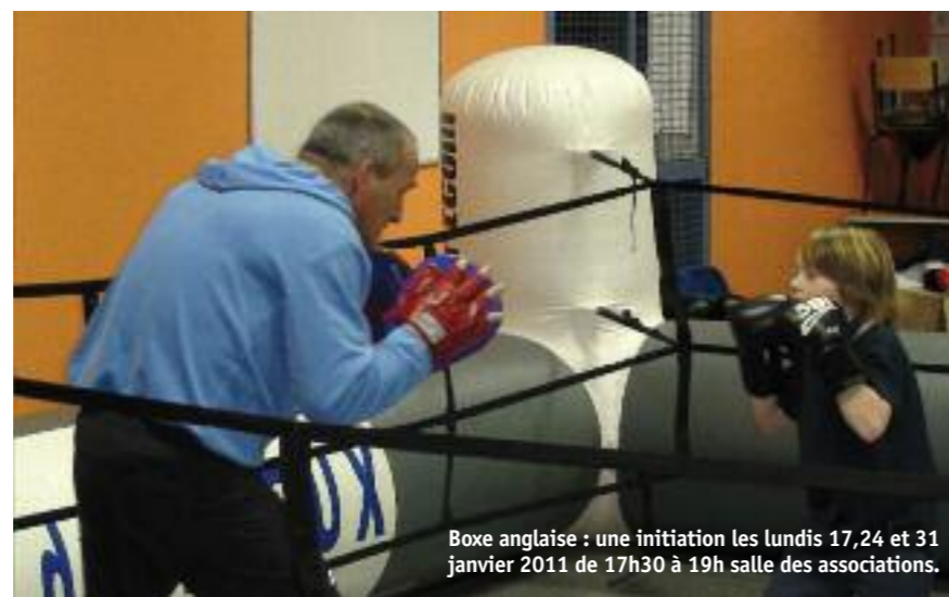
Boxe anglaise : une initiation les lundis 17,24 et 31 janvier 2011 de 17h30 à 19h salle des associations.