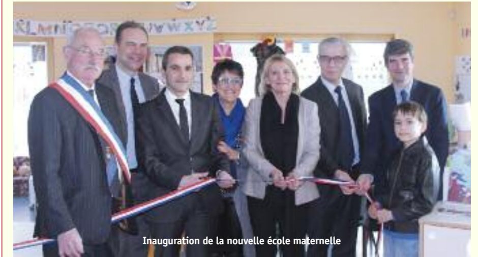
Inauguration de la nouvelle école maternelle

Guichainville se sont des écoles riches d'initiatives et des services annexes agréables, des salles d'activités vivantes, un pôle médical indispensable.