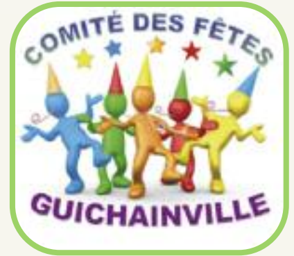
Un logo pour le comité des fêtes !