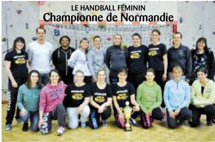
LE HANDBALL FÉMININ Championne de Normandie