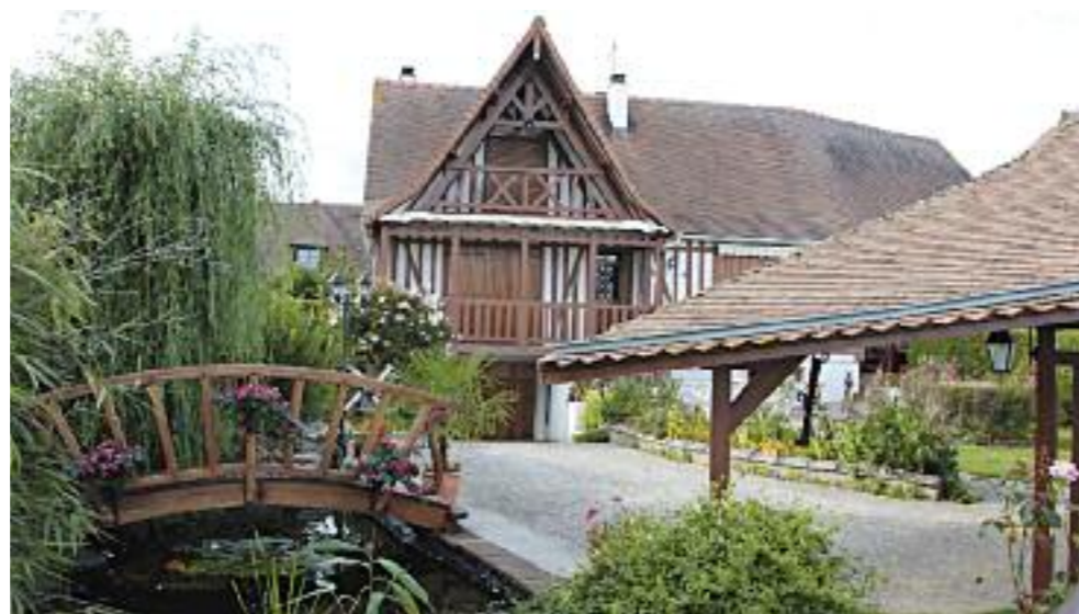
Notre premier passage a déjà été effectué mais, si le temps le permet, nous ferons un second passage, fin-août, début septembre. Alors lancez-vous... tous les participants sont récompensés !

Pour rappel, voici les photos des lauréats 2012 ! Alors n'hésitez pas plus longtemps : si vous aussi vous voulez participer, il n'est jamais trop tard !