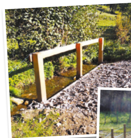
Création abreuvoir Gimond rive droite