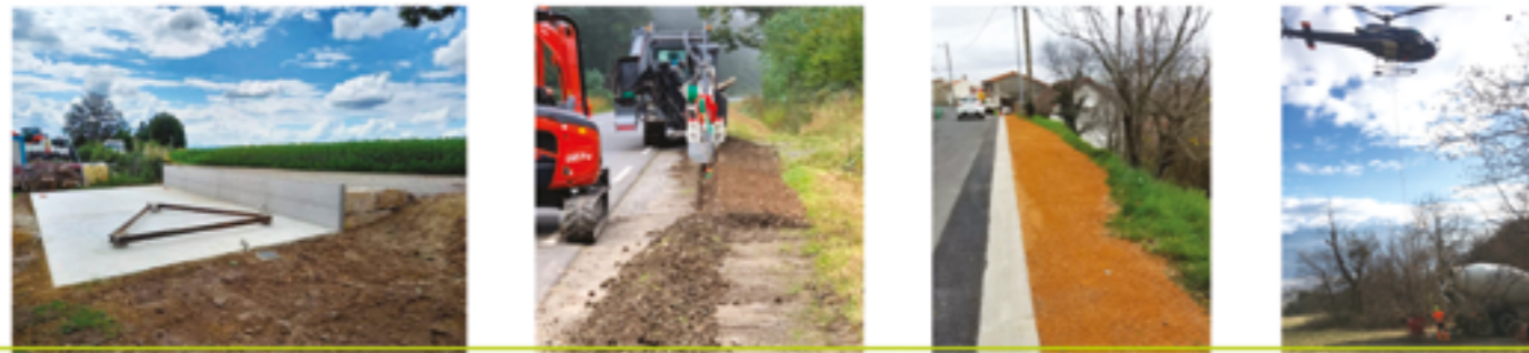
Travaux de terrassement: création de chemin d'accès, enrochement, plateforme et démolition