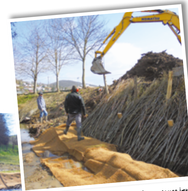
Lutte contre renouée japon concurrence par le saule