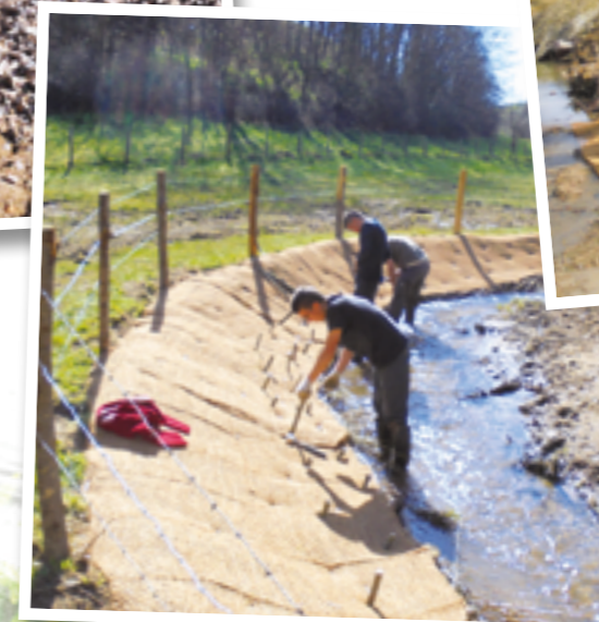
Technique végétale bouturage saules St Martin en Haut - Larajasse