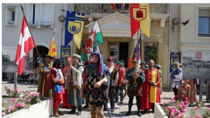
Commune de Geaune en Tursan Landes