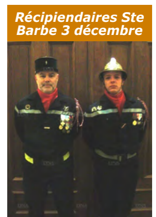
Récipiendaires Ste Barbe 3 décembre