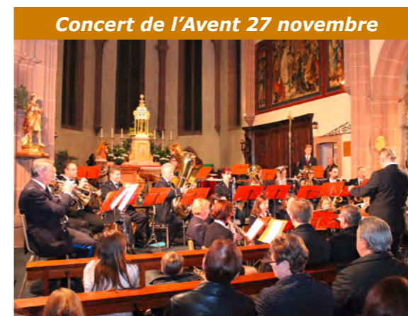
Concert de l'Avent 27 novembre