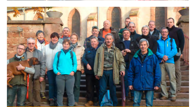
Visite des sources 28 octobre