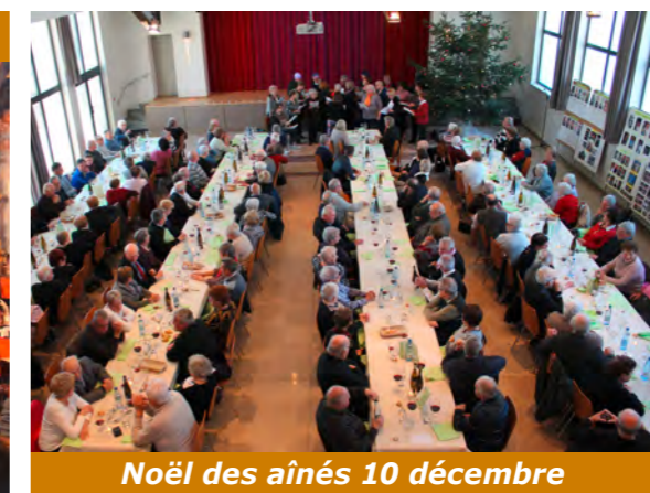
Noël des aînés 10 décembre