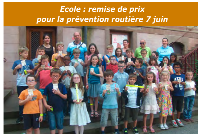
Ecole : remise de prix pour la prévention routière 7 juin