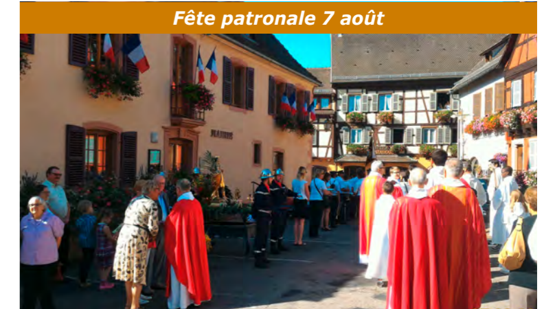
Fête patronale 7 août