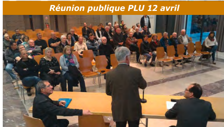
Réunion publique PLU 12 avril