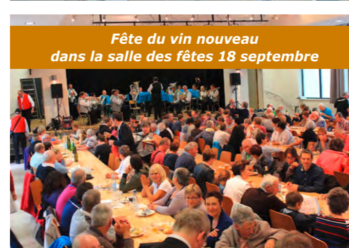
Fête du vin nouveau dans la salle des fêtes 18 septembre