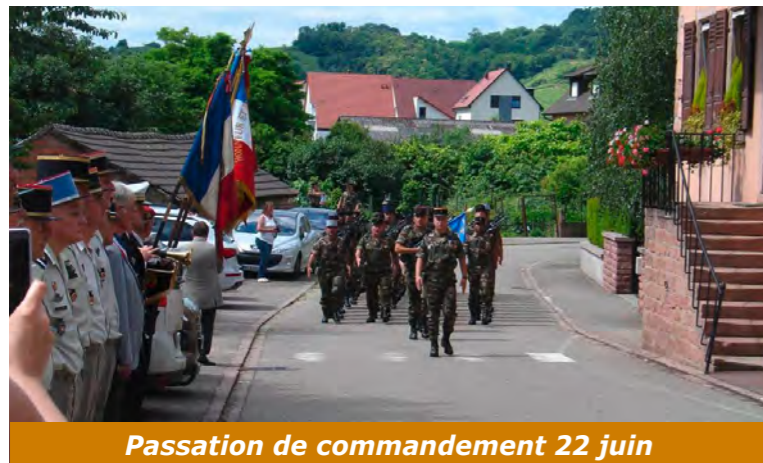
Passation de commandement 22 juin