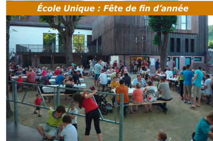
École Unique : Fête de fin d'année