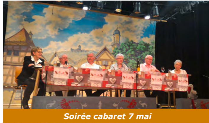
Soirée cabaret 7 mai