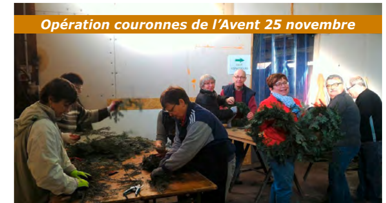
Opération couronnes de l'Avent 25 novembre