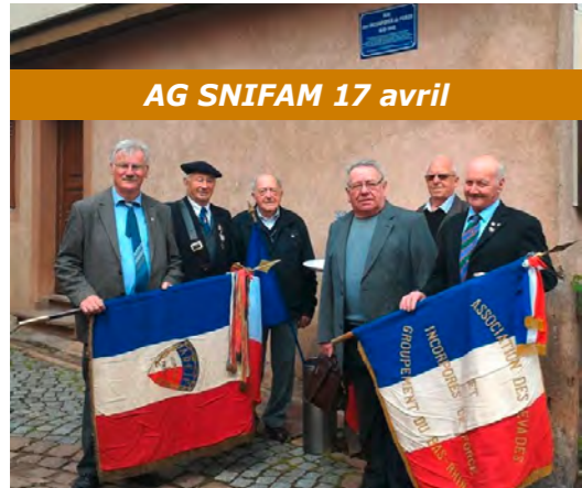
AG SNIFAM 17 avril