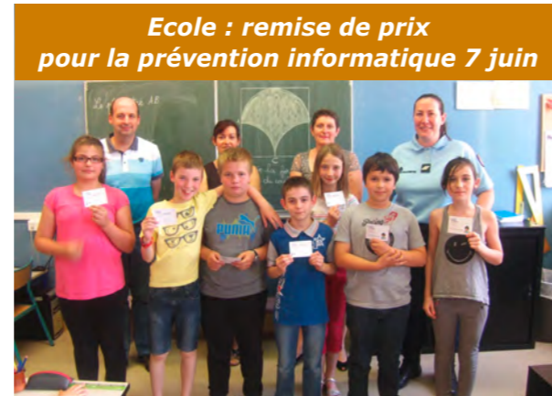
Ecole : remise de prix pour la prévention informatique 7 juin