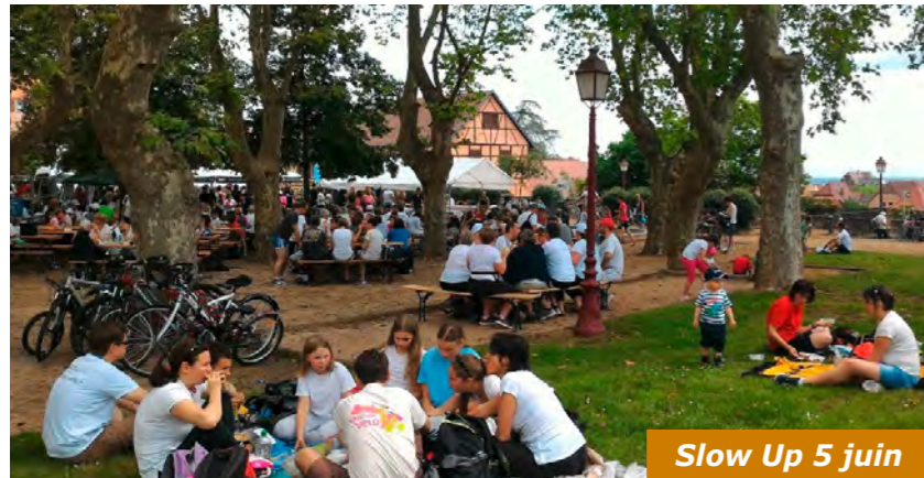
Slow Up 5 juin