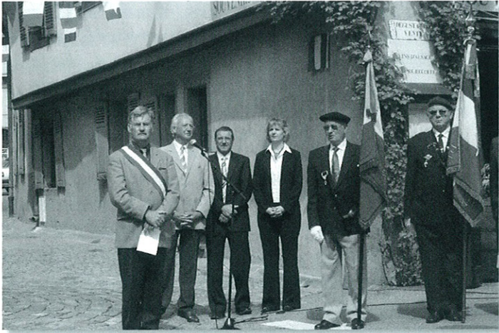
Inauguration de la plaque "Rue des incorporés de Force 1942-1945" le 7 mai 2006.