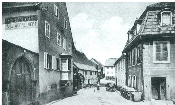
24 St-HIPPOLYTE - Rue de la Fontaine

Le Rappoltsweiler Kreisblatt de janvier 1906, donne les chiffres