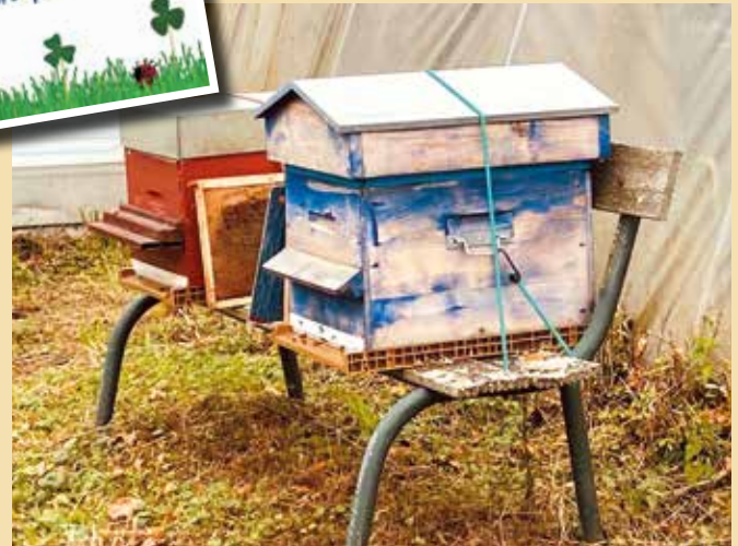
Les ruches communales au Kerpont