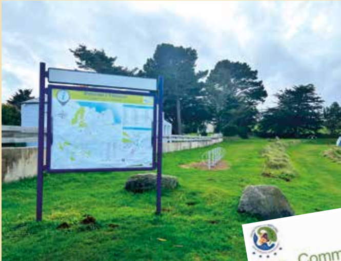
Une tonte raisonnée