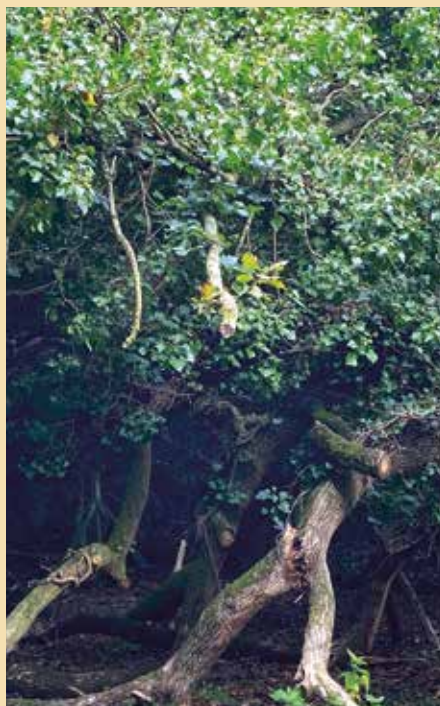
Préservation du chêne tombé suite à la tempête Alex de 2021

Un grand bravo à notre équipe et à leur travail.