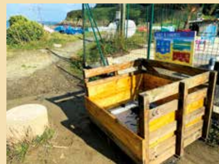
Des plages propres, grâce au bac à marée