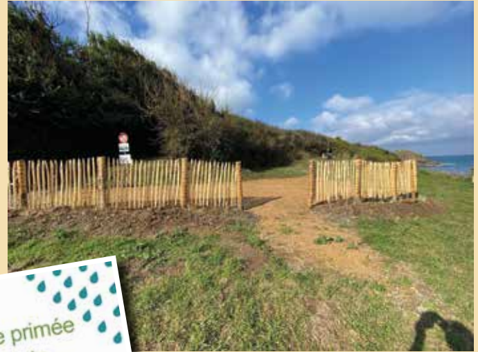
Un parc à vélo intégré