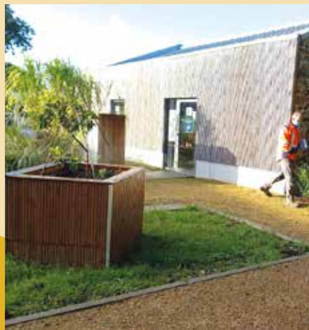
Des bacs «faits maison»