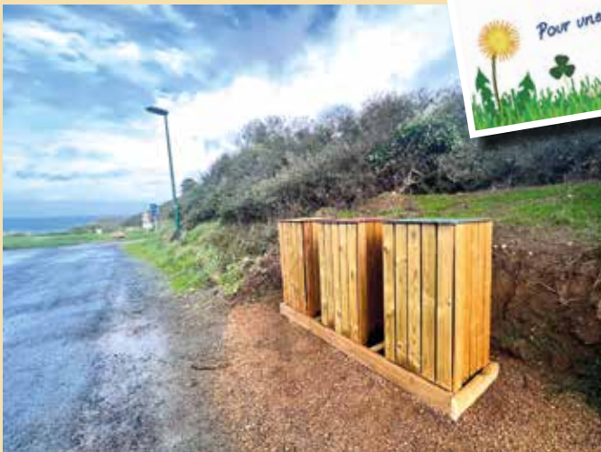
Des poubelles de tri