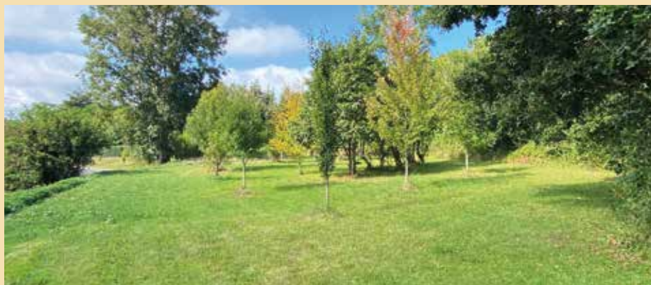
Une tonte raisonnée