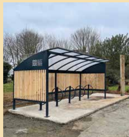
Nouvel abri à vélo place du bourg