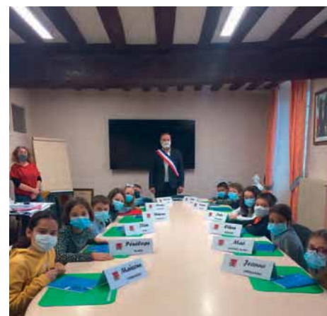
Installation des nouveaux élus du CME