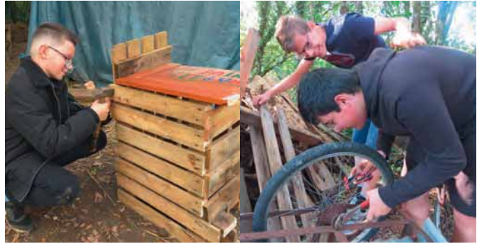
"Atelier coffre" et "Atelier vélo"

Au Martrais, nous nettoions, réparons, fagotons, préparons le déplacement du potager vers un espace plus ensoleillé. De nouveaux visages sont apparus. Les plus jeunes créent leurs loisirs verts, chacun peut s'exprimer, partager ses passions, cultiver la tolérance et le respect des différences au contact de personnes de tous âges dont des adultes handicapés de la résidence voisine.