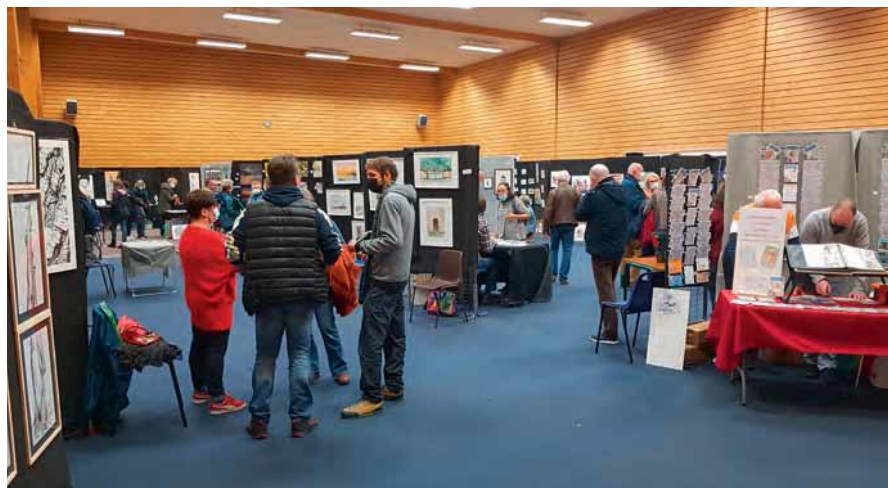
Dans les allées du Marché de l'Art salle de l'Etoile

La troisième édition du « Marché de l'Art » s'est déroulée les 20 et 21 novembre 2021 à la salle du Pontrais. Cette exposition-vente a regroupé 36 artistes (peintres, photographes, dessinateurs, sculpteurs...) et accueilli environ 700 visiteurs.