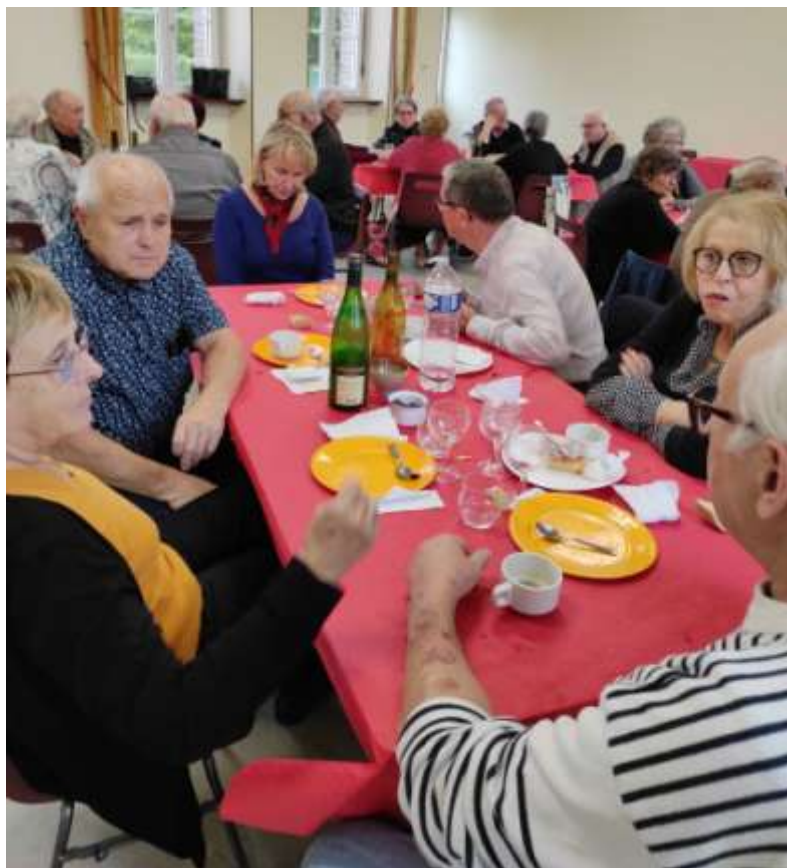
Photo : beaujolais nouveau 2021