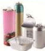
LES EMBALLAGES EN MÉTAL