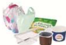
TOUS LES EMBALLAGES ALIMENTAIRES EN PLASTIQUE