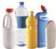
LES BOUTELLES ET FLACONS EN PLASTIQUE