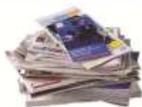
LES JOURNAUX, REVUES ET MAGAZINES