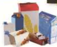
LES BRIQUES ALIMENTAIRES ET CARTONS FINS