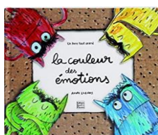
La couleur des émotions Anna LLENAS