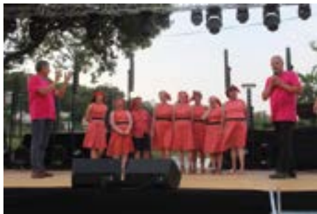
bénévoles féminines comité des fêtes