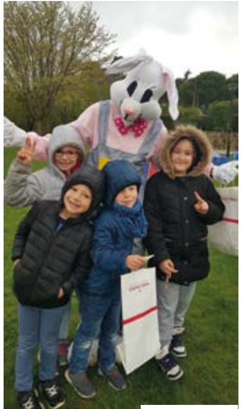
Chasse aux œufs

Le Bureau tient à remercier tout particulièrement les quelques parents et grands-parents qui ont donné un peu de leur temps, malgré leur emploi du temps parfois surchargé, pour aider à la mise en place des événements.