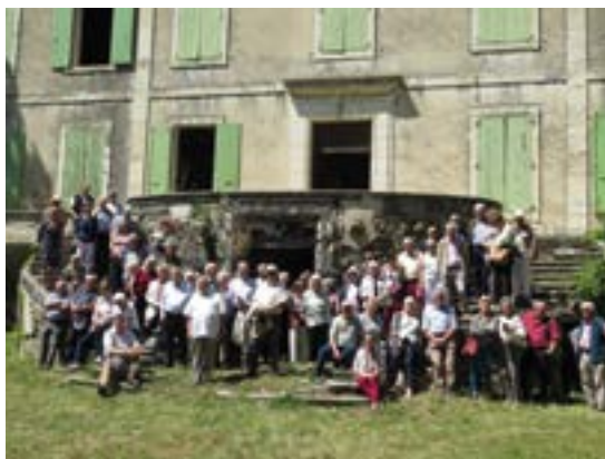
Invitée par notre Association le 13 juin 2019, une partie du groupe Sauvegarde des Monuments Anciens de la Drôme

Nouveauté importante : Les particuliers peuvent obtenir un crédit d'impôt de 66 % pour les dons destinés à financer la restauration de la Chapelle Saint-Blaise. (Renseignements auprès du Président).