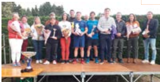
Remise des prix tournoi tennis

Pour plus d'informations sur les modalités d'adhésion, vous pouvez contacter Sébastien BOUTIN au 06 77 63 77 79 et pour les modalités des cours Arnaud MARQUE au 06 58 27 67 66