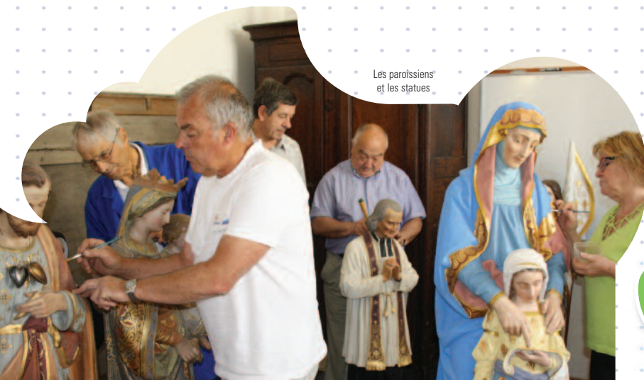
Les paroissiens et les statues