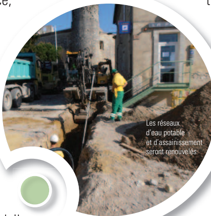
Les réseaux d'eau potable et d'assainissement seront renouvelés

Pour mener à bien cette opération estimée à 450 000 euros, la commune de Montboucher a su optimiser les aides auxquelles elle avait droit. L'État a accordé 112 500 euros au titre de la Dotation d'Équipement des Territoires Ruraux, le Département 125 000 euros et la Région 34 530 euros à travers le Fonds d'intervention pour les services, l'artisanat et le commerce, soit une couverture financière de plus de 60 %. Le reste est à la charge de la commune.