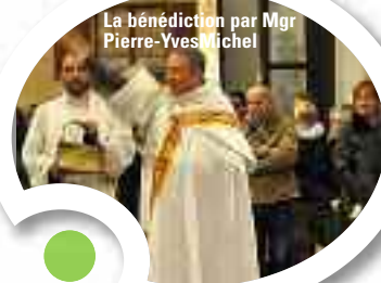
La bénédiction par Mgr Pierre-Yves Michel

Et Bruno Almorice de conclure son intervention par cette belle formule : « Restaurer, c'est faire revivre quelque chose qui s'était éteint. » La soirée s'est poursuivie par la prestation des 60 choristes de l'ensemble vocal de Fauconnières puis achevée par un diaporama et apéritif dinatoire à la salle des fêtes.