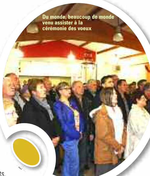
Du monde, beaucoup de monde venu assister à la cérémonie des vœux

« Oui je travaille avec mon équipe municipale sur plusieurs projets dont trois retiennent particulièrement notre attention : la réhabilitation du centre ancien de l'église St Martin jusqu'à la place des Résistants, la sécurisation des piétons au bord de la RD 540 en agglomération ainsi qu'un projet économique autour de la carrière. Ces trois projets sont issus de nos engagements électoraux de 2014. »