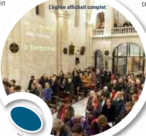
L'église affichait complet

Resplendissante ! Comment qualifier autrement l'église St Martin depuis qu'elle a été le théâtre d'une spectaculaire rénovation. Chauffage au sol, murs traités à la chaux, mise en valeur des objets eucharistiques par des jeux de lumière, travail sur les vitraux pour restituer une lumière naturelle, fabrication de nouveaux bancs : l'église est devenue un écrin digne de son riche passé.