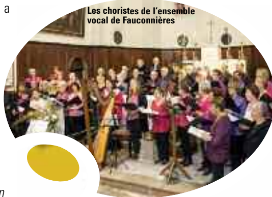
Les choristes de l'ensemble vocal de Fauconnières

« RESTAURER, C'EST FAIRE REVIVRE QUELQUE CHOSE QUI S'ÉTAIT ÉTEINT ».