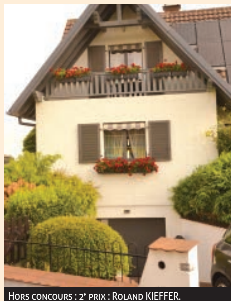
HORS CONCOURS : 2 E PRIX : ROLAND KIEFFER.