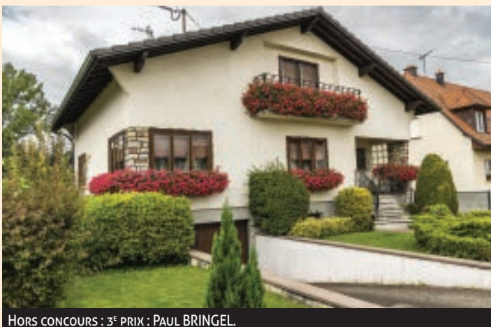
HORS CONCOURS : 3 E PRIX : PAUL BRINGEL.