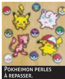
POKHEIMON PERLES À REPASSER.