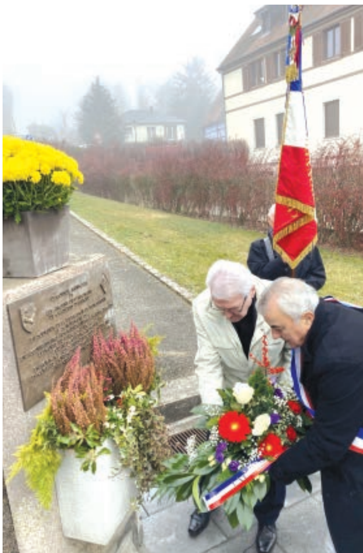
11 NOVEMBRE 2021, UNE FOIS ENCORE, UNE CÉRÉMONIE INTIMISTE MAIS EMPREINTE DE RECUEILLEMENT.

La LOI du 24 novembre 1922 fait du 11 novembre « la journée nationale pour la commémoration de la victoire et de la paix ». La loi du 28 février 2012 étend l'hommage à tous les « morts pour la France » des conflits passés et présents.