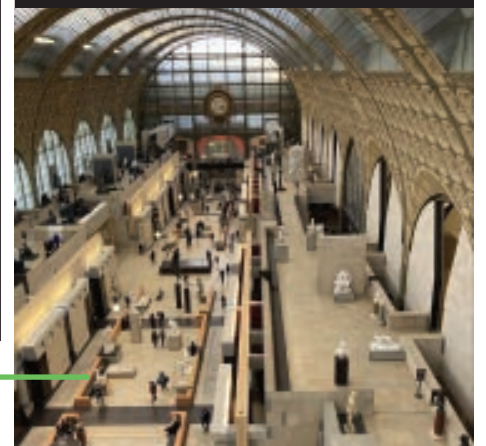
VISITE DU MUSÉE D'ORSAY POUR CLÔRE CETTE JOURNÉE.

Une belle journée qui se clôtura dans l'après-midi par la visite du Musée d'Orsay, situé non loin du Palais Bourbon et dédié à toutes les formes d'art du 19 e siècle. E. P. ■