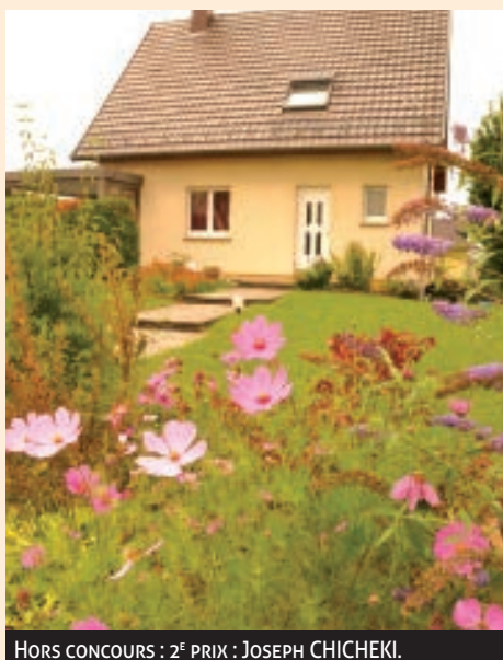
HORS CONCOURS : 2 E PRIX : JOSEPH CHICHEKI.