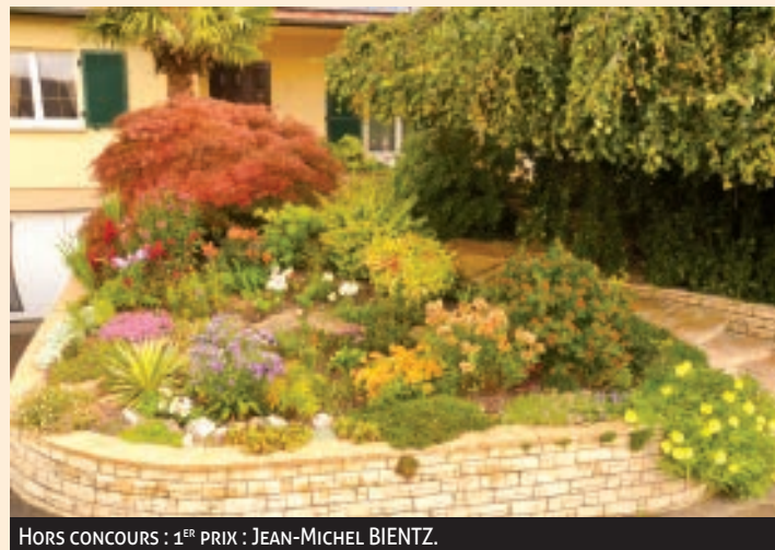
HORS CONCOURS : 1 ER PRIX : JEAN-MICHEL BIENTZ.