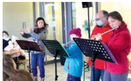
LES MUSICIENS DE L'ÉCOLE DE MUSIQUE HENRI REBER.