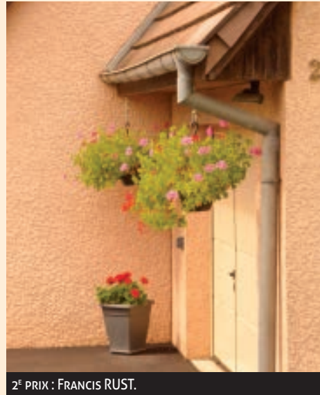
2 E PRIX : FRANCIS RUST.