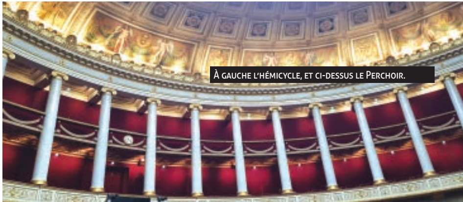
À GAUCHE L'HÉMICYCLE, ET CI-DESSUS LE PERCHOIR.