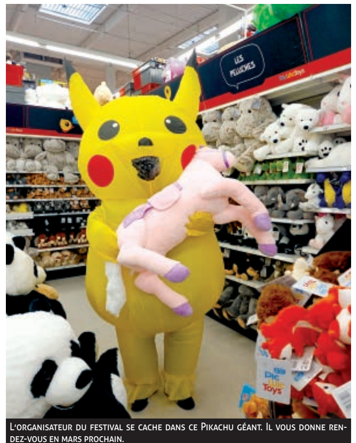
L'ORGANISATEUR DU FESTIVAL SE CACHE DANS CE PIKACHU GÉANT. IL VOUS DONNE RENDEZ-VOUS EN MARS PROCHAIN.

Dates : 19 et 20 mars. Horaires : 10 h à 18 h les deux jours. Lieu : Espace Geren. Tarif journée : à partir de 12 ans : 5 € par personne, enfant entre 3 et 11 ans : 2 €. Restauration sur place. Plus d'informations sur le site www.pokheimon.fr