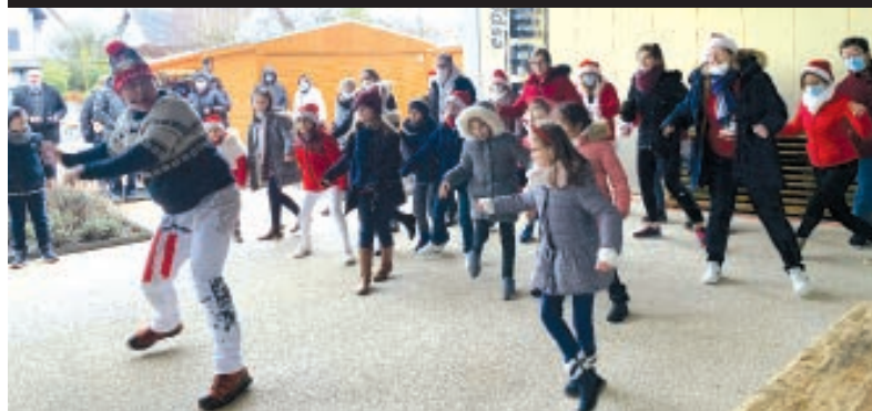
UNE DÉMONSTRATION DES DANSEURS DE SWING ET CIE.