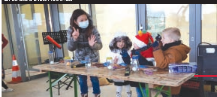
LA CLASSE D'ÉVEIL MUSICALE.

Dimanche réserva un climat plus propice. De quoi donner à Saint Nicolas (le vrai) l'envie de venir voir les enfants et de leur distri-