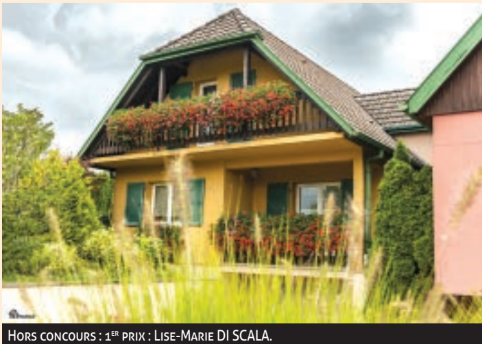
HORS CONCOURS : 1 ER PRIX : LISE-MARIE DI SCALA.