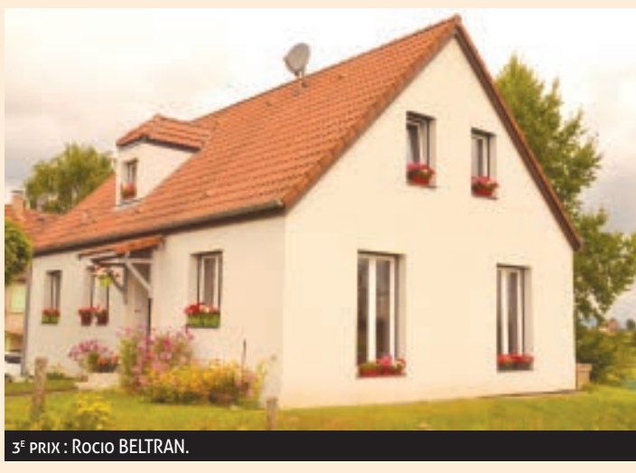
3 E PRIX : ROCIO BELTRAN.