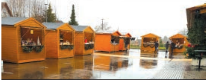
LE MARCHÉ DE NOËL INSTALLÉ SUR LE PARKING DE L'ESPACE GEREN.