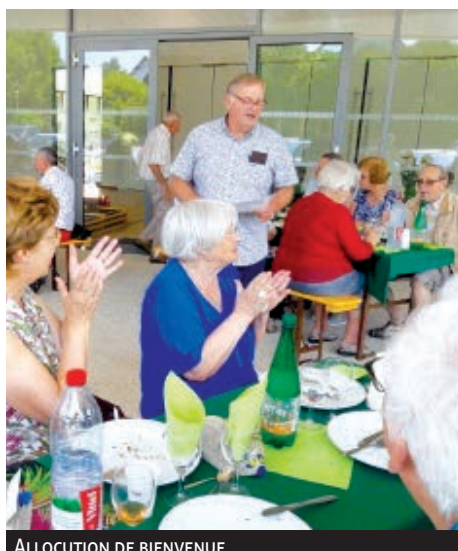
ALLOCATION DE BIENVENUE.