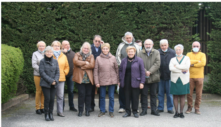
Le Conseil des Sages® a été installé le 18 mars 2021.

Le premier Conseil des Sages® a été créé en 1989 par Kofi Yamgnane, ancien Secrétaire d'État. C'est un outil de démocratie locale composé de seniors et de retraités, qui apporte à la municipalité qui le met en place, conseils et propositions. Depuis, de nombreuses communes ont mis en place cet outil, elles sont réunies dans une Fédération nationale.