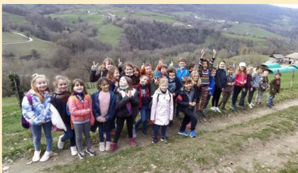
Promenades des CE au mois de mars

La remise des calculatrices – offertes aux CM2 par l'APE – et du livre « Les fables de La Fontaine » a pu être faite dans la salle polyvalente.