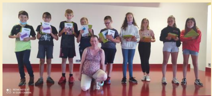
Remise des calculatrices aux CM2