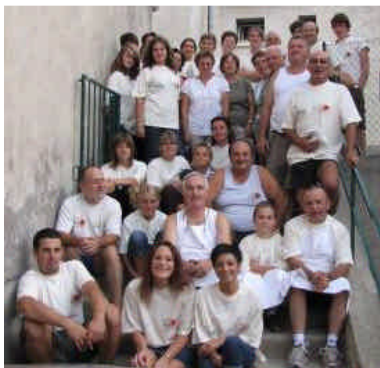
L'équipe des Bénévoles...

A cette occasion un feu d'artifice (offert par le basket avec participation de la commune) a attiré une foule importante. Beaucoup pensent déjà à la 41ème fête du village, histoire à suivre... Un grand merci à la propriétaire du terrain sans qui ce feu d'artifice n'aurait pas pu avoir lieu.