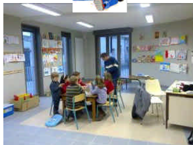
Petits travaux manuels

Nous tenons ici à remercier la mairie et l'équipe d'architectes d'avoir imaginé dans l'école un espace pour l'accueil du périscolaire.