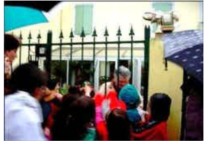
Récolte et partage des bonbons Halloween

Et cette année encore retrouvons nous pour le repas de village samedi 5 juin 2011, avec l'association Caracole 26. Le principe est simple, on installe quelques tables devant l'église à l'ombre des platanes et chacun amène un petit plat à partager dans la convivialité.