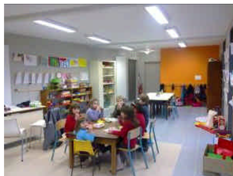
Pause goûter bien méritée