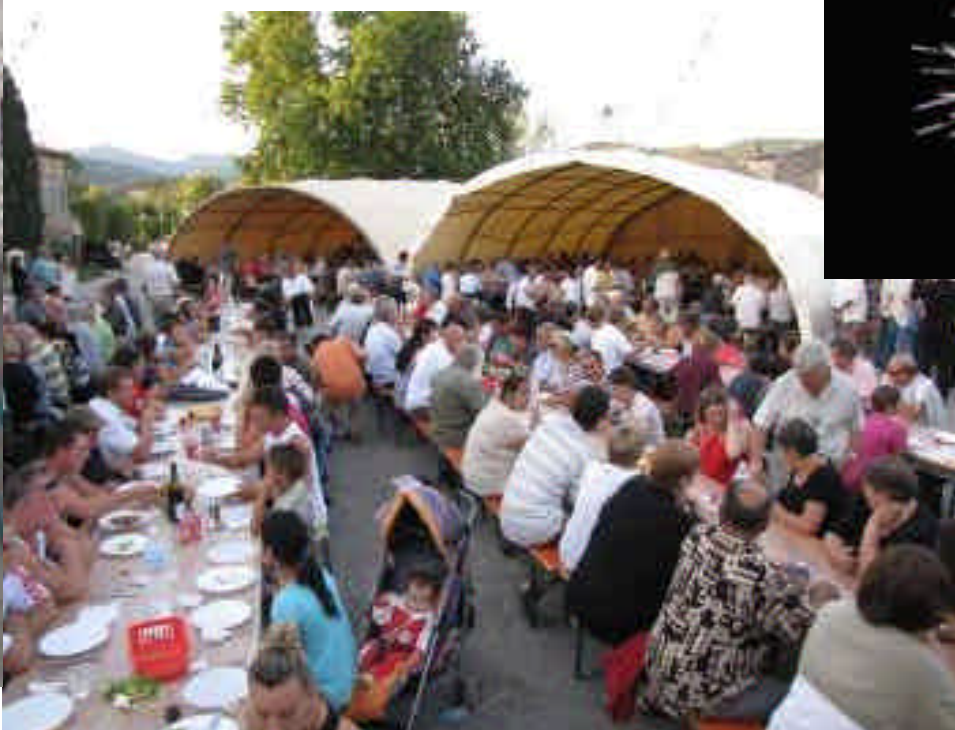
... et l'équipe des Amateurs