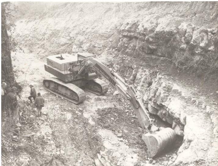
1 coup de pelle - janvier 1992

Quant aux riverains et utilisateurs de l'eau de la Gervanne, le syndicat les rassure par un engagement de ne prélever en période d'étiage (sauf accident sur la ressource de Crest), qu'un débit de 20 l/s maximum au lieu des 100 l/s de droit. Le conseil municipal de Beaufort, par délibération du 23 janvier 1991, lève son opposition au projet et une nouvelle enquête publique réalisée en juillet de la même année, permettra le feu vert à la réalisation du captage de Bourne, à sa résurgence en aval de Beaufort. Le premier coup de pelle est donné en janvier 1992 ; soit plus de 8 ans après la première réunion fédératrice d'Aouste.