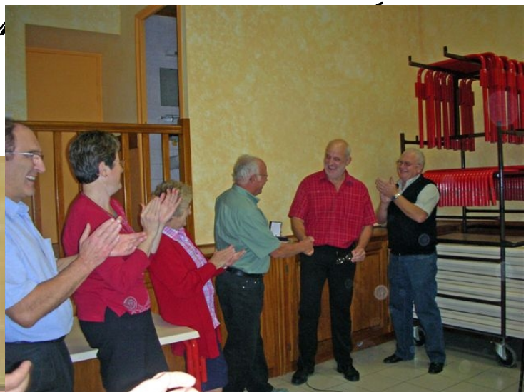
Remise de la Médaille de la commune par Monsieur le Maire