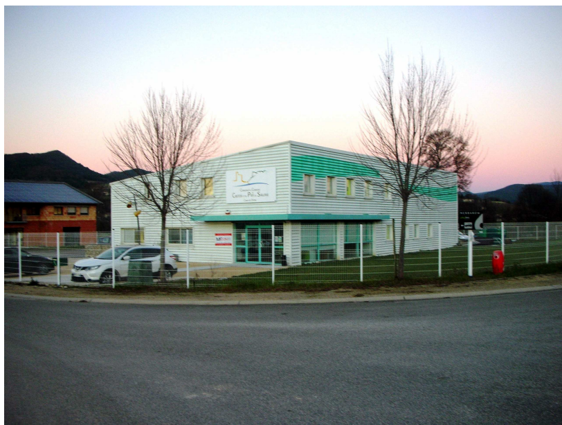
Siège social de la CCCPS - Chemin des Senteurs - ZA Les Bories - 26400 AOUSTE SUR SYE