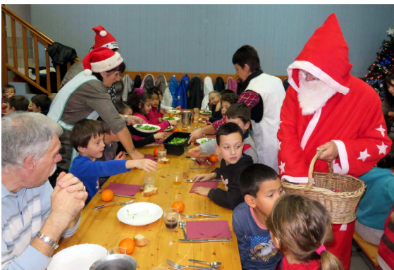
Le père Noël en visite à la cantine

C'est donc une (très) joyeuse troupe qui a fait le trajet école-cantine ce jeudi-là !