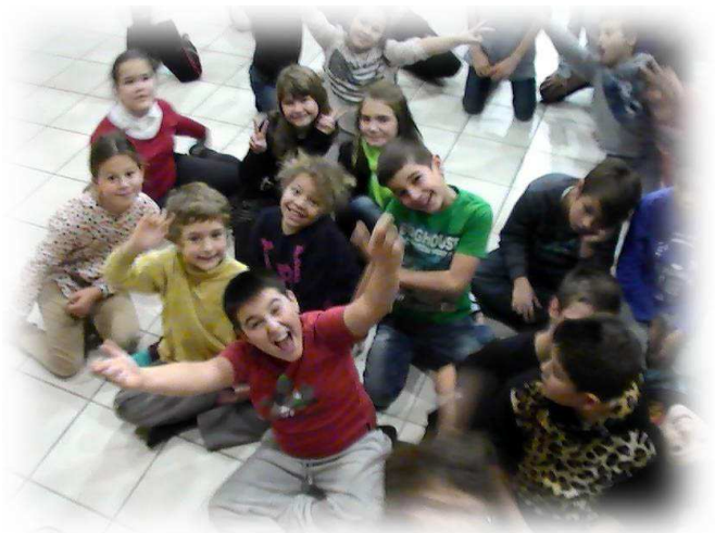
L'équipe de la MJC