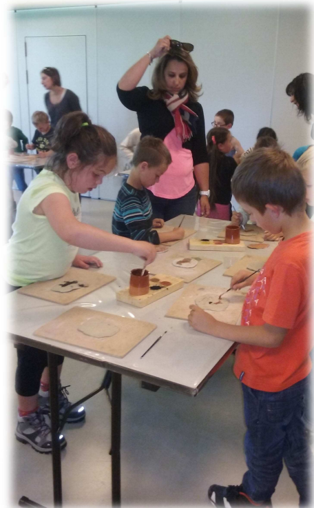
Après la théorie, la pratique