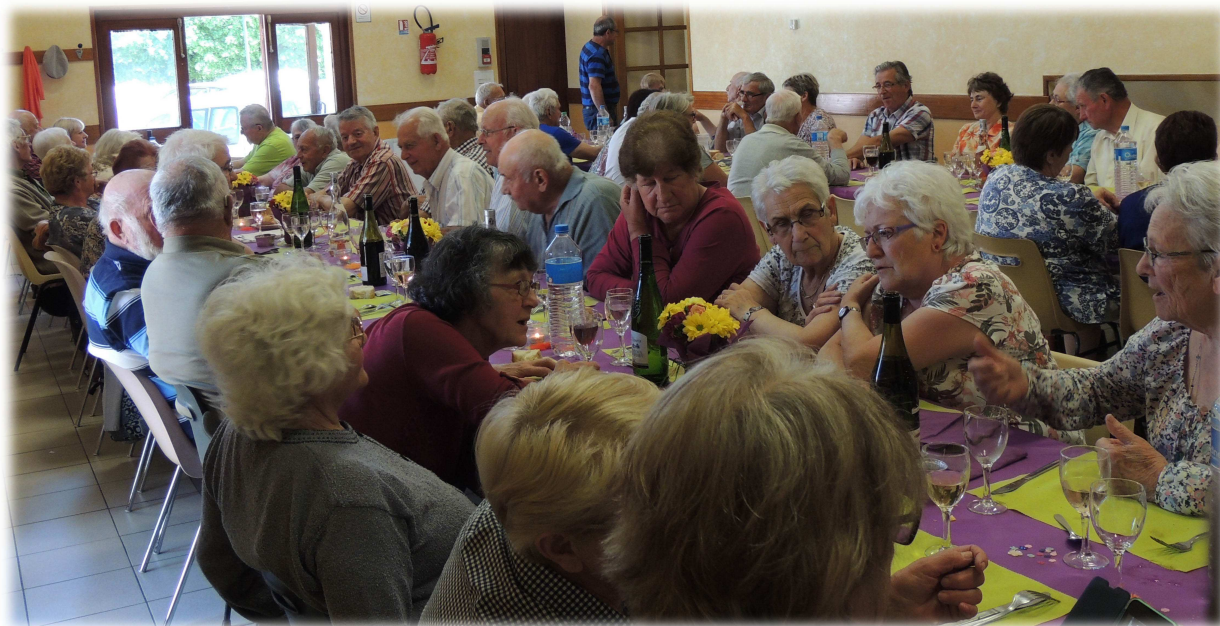
Dernière Assemblée Générale suivie du repas de clôture