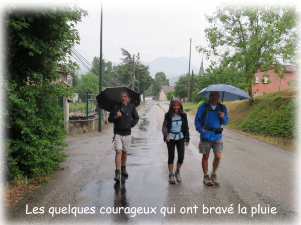
Les quelques courageux qui ont bravé la pluie

QUEL TEMPS DE CHIEN !!! Voilà la réflexion que ce sont faite les coureurs, marcheurs et bien sûr les organisateurs en se levant ce matin du 14 Juin.