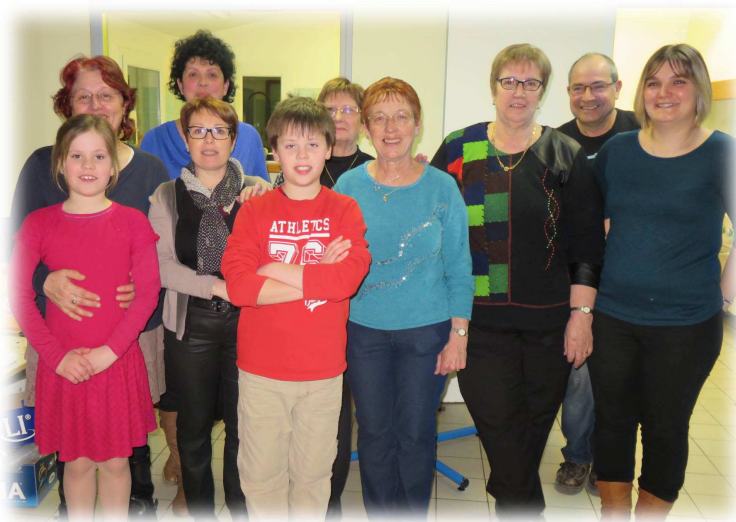
Membres de l'association lors de leur repas « Soupe au Pistou »