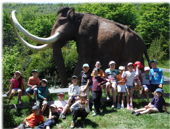
Retour vers le passé...

Suite aux dix-sept séjours à Valdrôme et à une année de réflexion, les CP sont de nouveau repartis à l'assaut de la montagne. L'occasion de faire la classe (du 27 au 29 mai) autrement pendant trois jours et de découvrir quelques aspects de « notre » Vercors drômois.