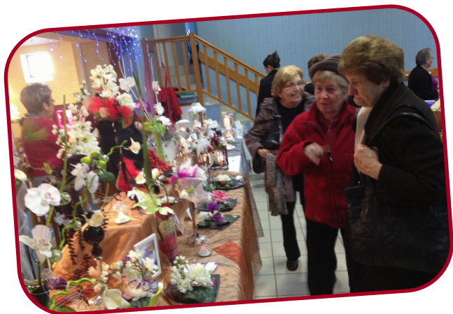
Quelques exposants répondant à l'appel du 1 er marché de Noël