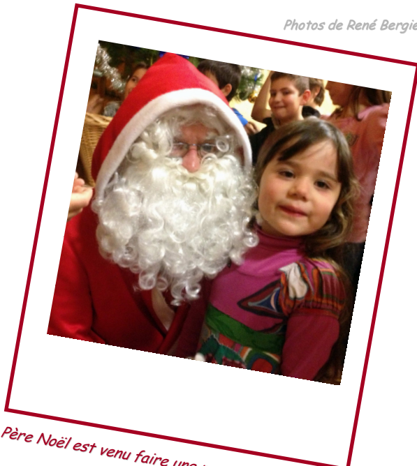
Même le Père Noël est venu faire une petite surprise aux enfants sages