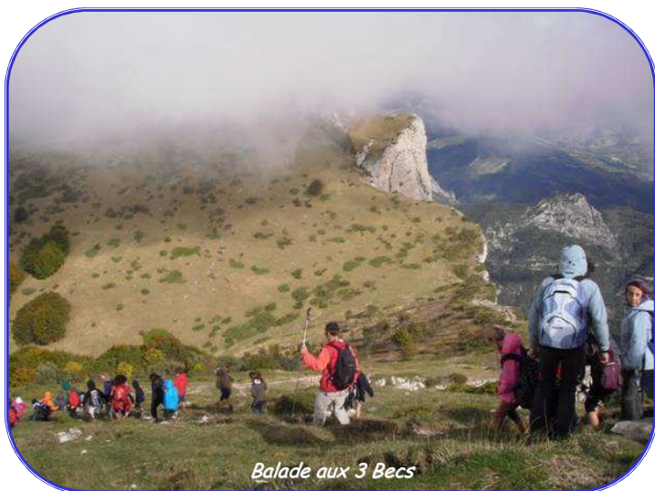
Balade aux 3 Becs

Logiquement, le prochain séjour, pour les écoliers français, devrait s'organiser en mai 2014, suivi d'un accueil des écoliers italiens en octobre 2014. Entre temps, les Français auront fait leur séjour à vélo en mai 2013.