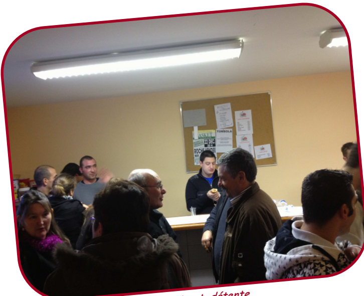
Coin buvette et détente