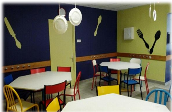
La salle du restaurant de Piégros s'est embellie, entièrement repeinte avec des couleurs choisies par les enfants !

L'association accompagne l'équipe présente en cuisine et auprès des enfants pendant leur temps de pause méridienne. Elle veille au bon déroulement de ce temps propice à l'apprentissage du goût et au développement de l'autonomie. Elle organise ce temps éducatif, gère les inscriptions et les orientations budgétaires (achats des denrées et du petit matériel).