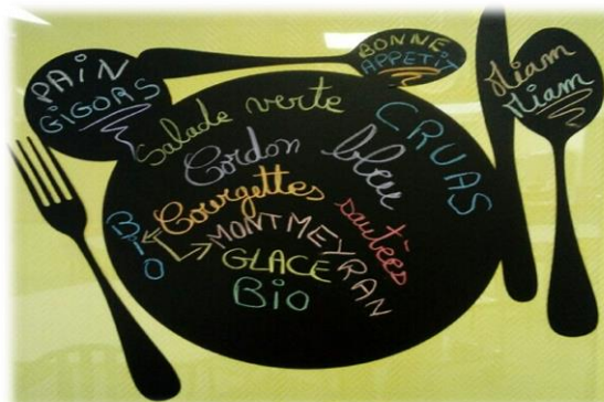
Exemple du menu du vendredi 13 septembre

Les menus tiennent compte de la saisonnalité pour développer chez les enfants le respect des cycles naturels et la connaissance des productions agricoles associées.