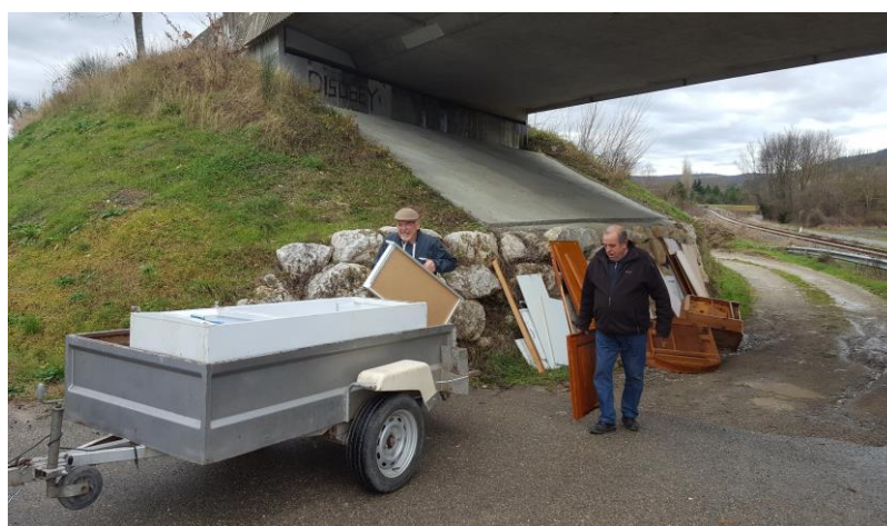
Nettoyage au jardin du Maréchal

Alors, devant ces incivilités, soyons responsables et ne faisons pas de la délation. Mais si vous êtes témoins d'actions de ce type, réagissez, intervenez, prenez des noms et n'hésitez pas à le faire savoir en mairie.