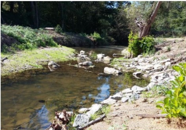
Un exemple de travaux réalisés : la renaturation du Ligneron

Le Syndicat Mixte des Marais, de la Vie, du Ligneron et du Jaunay a engagé en 2019 une étude bilan du Contrat Territorial 2015-2019 qu'il coordonne dans le cadre de la mise en œuvre du Schéma d'Aménagement et de Gestion des Eaux (SAGE) . Sur les cours d'eau et marais du bassin versant, les travaux suivants ont été réalisés :