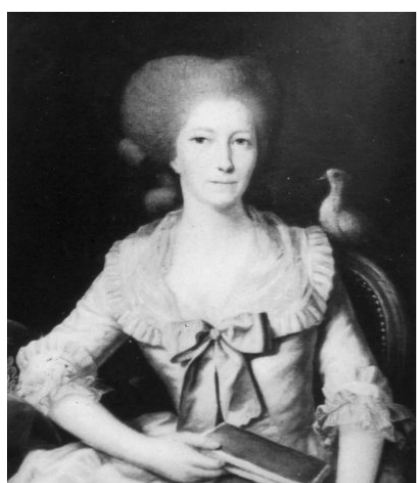
La Maréchale de Richelieu

En 1798, une personnalité peu commune s'installe au château de Fromonville avec ses cinq enfants, après deux mariages, deux veuvages et les menaces de la Terreur qui la firent s'exiler en Allemagne en 1794, puis revenir en France pour se retirer dans notre village : la Maréchale de Richelieu.