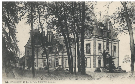
Le château en 1935

En 1944 , des éléments des Forces Françaises Libres logent un temps dans les dépendances du château. A la Libération, des officiers américains et anglais, en détachement à Fontainebleau, habitent une partie du château.