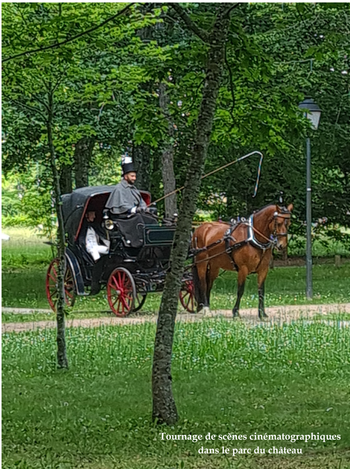
Tournage de scènes cinématographiques dans le parc du château

Le Magazine d'information bimestriel de votre commune