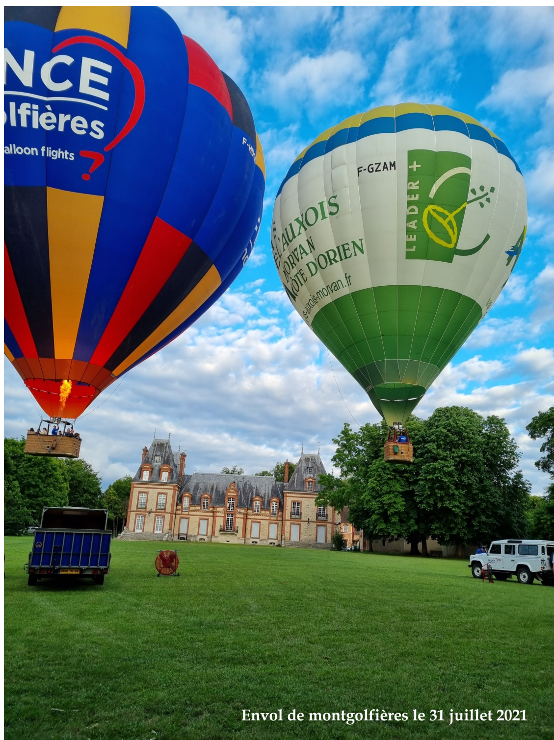
Envol de montgolfières le 31 juillet 2021

Le Magazine d'information bimestriel de votre commune