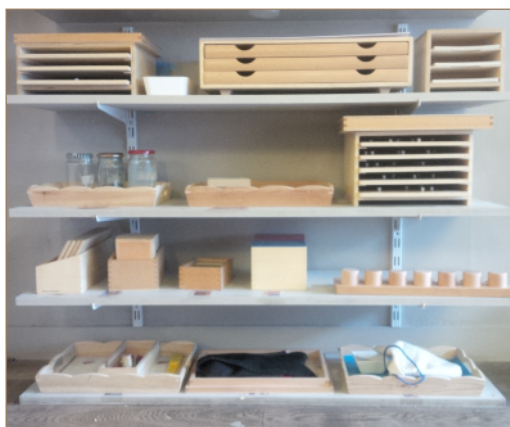
Type de matériel Montessori dans une classe d'enfants de 3 à 6 ans

La commune de Correns a donc participé pour faire bénéficier vos enfants de ce nouvel arsenal