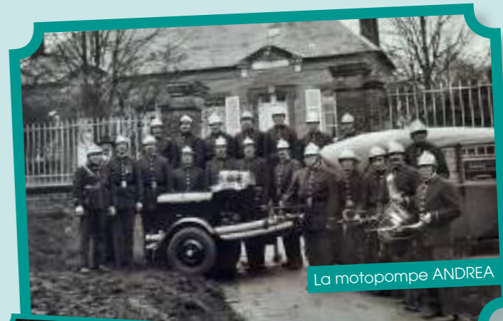
La motopompe ANDREA

Nos anciens sont notre mémoire vivante, il est toujours intéressant de les écouter.