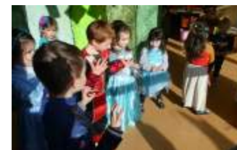
Groupe des Maternelles