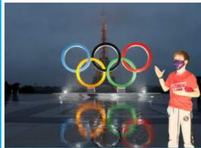
Une mise en scène réalisée dans le cadre du service périscolaire