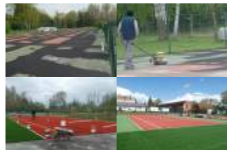
Des travaux longs et minutieux

Les travaux d'un montant de 34.000€ HT ont été financés par le Conseil Départemental de l'Oise, la mairie, le TCL (Tennis Club de Laversines), la Fédération Française de Tennis et la fondation d'Olivier Dassault.