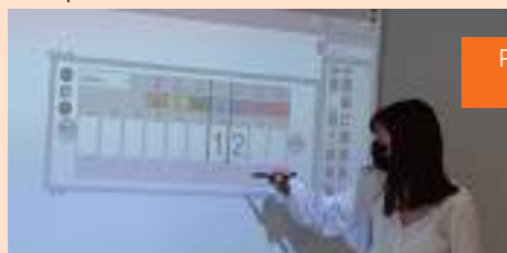
Prise en main des VPI (vidéo projecteur interactif) par l'équipe enseignante