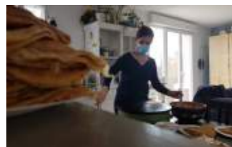
Les crêpes faites « maison »

Une journée bien sympathique, originale dans sa conception, qui prouve que tout est possible pour faire plaisir aux enfants.