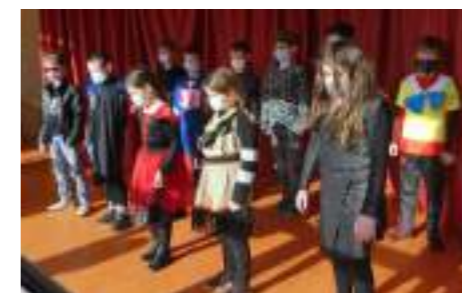
Groupe de Cours Moyens