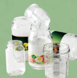
Bocaux de conserves et pots en verre