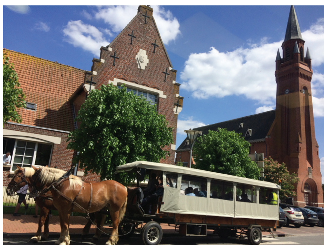
Vue sur la mairie lors du centenaire, par Juliette Duyck

Trois photos ont été reçues. Un jury délibérera pour la plus belle photo et attribuera un prix à son auteur lors de la cérémonie des vœux. Ces photos seront toutes exposées lors de la cérémonie.