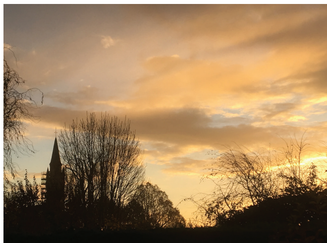
Lever de soleil d'hiver, par Edith Despringre