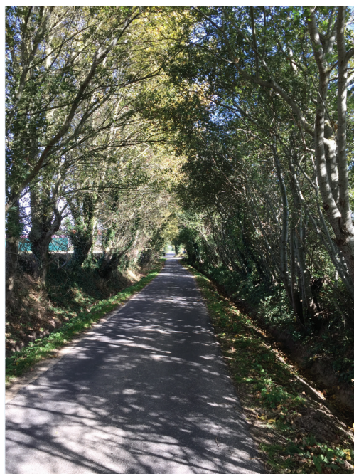
Le Chemin du Vierayms à la Fontaine, par Lucie Duborper