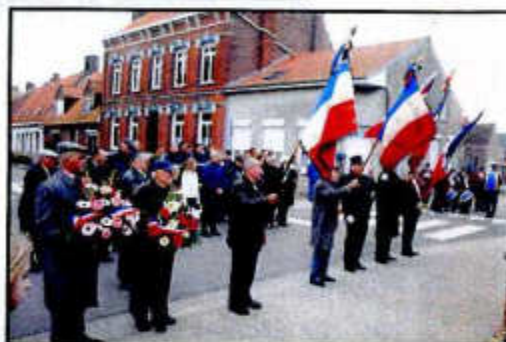
Cérémonie du 11 novembre 2011