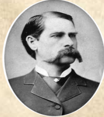
Wyatt Earp Marshall de Dodge City et de Tombstone

Après la conquête de l'Angleterre par Guillaume le Conquérant, la fonction perdura, sous le nom de vicomté. Elle reprit finalement l'appellation de shérif, tandis que vicomte devint un titre héréditaire.