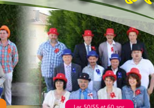
Les 50/55 et 60 ans