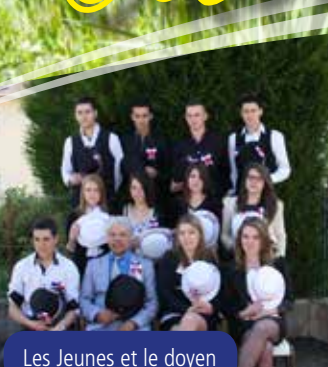
Les Jeunes et le doyen