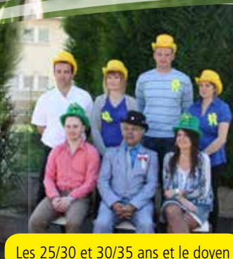
Les 25/30 et 30/35 ans et le doyen