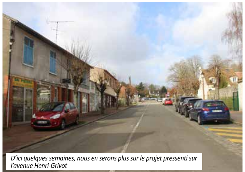
D'ici quelques semaines, nous en serons plus sur le projet pressenti sur l'avenue Henri-Grivot

Des étapes importantes pour finaliser le projet sont en train d'être franchies et très prochainement, la commune pourra présenter les résultats de toutes ses réflexions et études.