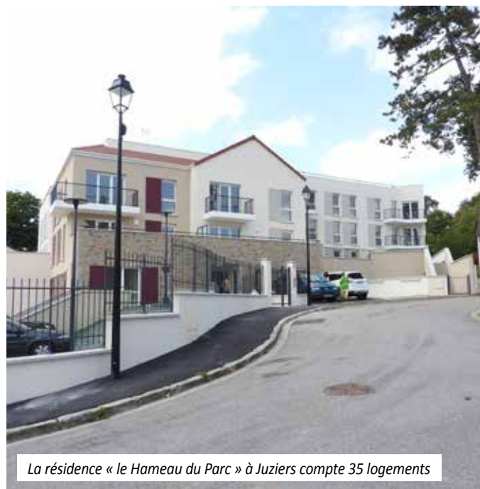
La résidence « le Hameau du Parc » à Juziers compte 35 logements

Le principe d'intervention n'est donc pas lié à la taille du projet mais à ses contraintes techniques et financières. Quelle que soit la dimension du projet, notre établissement à une valeur ajoutée sur les projets complexes nécessitant une intervention