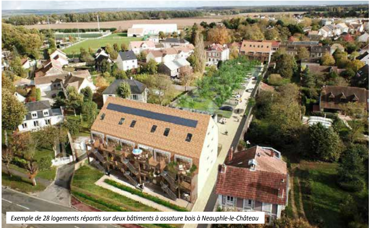
Exemple de 28 logements répartis sur deux bâtiments à ossature bois à Neauphle-le-Château