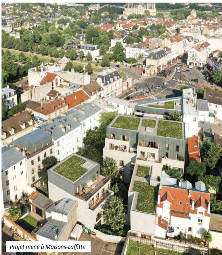
Projet mené à Maisons-Laffitte

Nous avons lu sur le site de l'EPF d'Île-de-France « sur l'année 2021, ce sont 963 millions d'euros qui auront été engagés, représentant un potentiel de 20 000 logements et 500 000 m 2 d'activités. » Cela paraît énorme ? Ce sont des chiffres exceptionnels ? Combien cela représente de projets traités ?