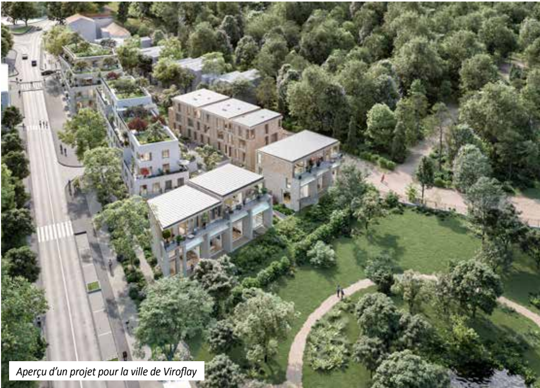
Aperçu d'un projet pour la ville de Viroflay

préalable et qui, par la suite, seront réintégrés dans un schéma classique de production par une cession à un opérateur immobilier.