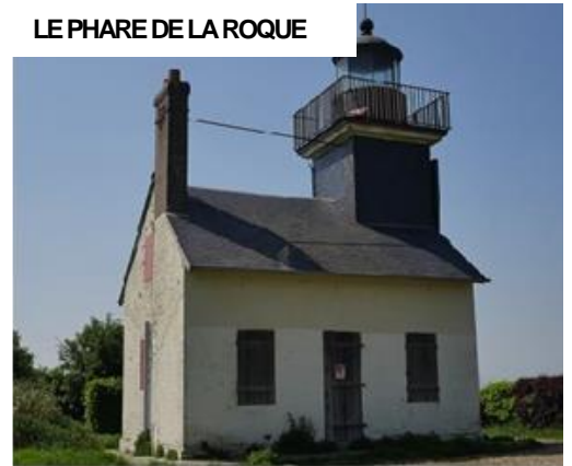
LE PHARE DE LA ROQUE