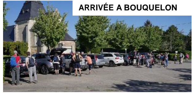
ARRIVÉE A BOUQUELON

Il fallait être bien équipé pour cette randonnée du 8 mai : boisson, casse-croûte, chapeau, et surtout anti-moustique car dès le début de la marche dans un petit chemin boisé parmi les magnifiques chaumières, les fleurs, il y avait ... les moustiques !!! Nous dûmes affronter une attaque massive de ces insectes friands de chair fraîche.